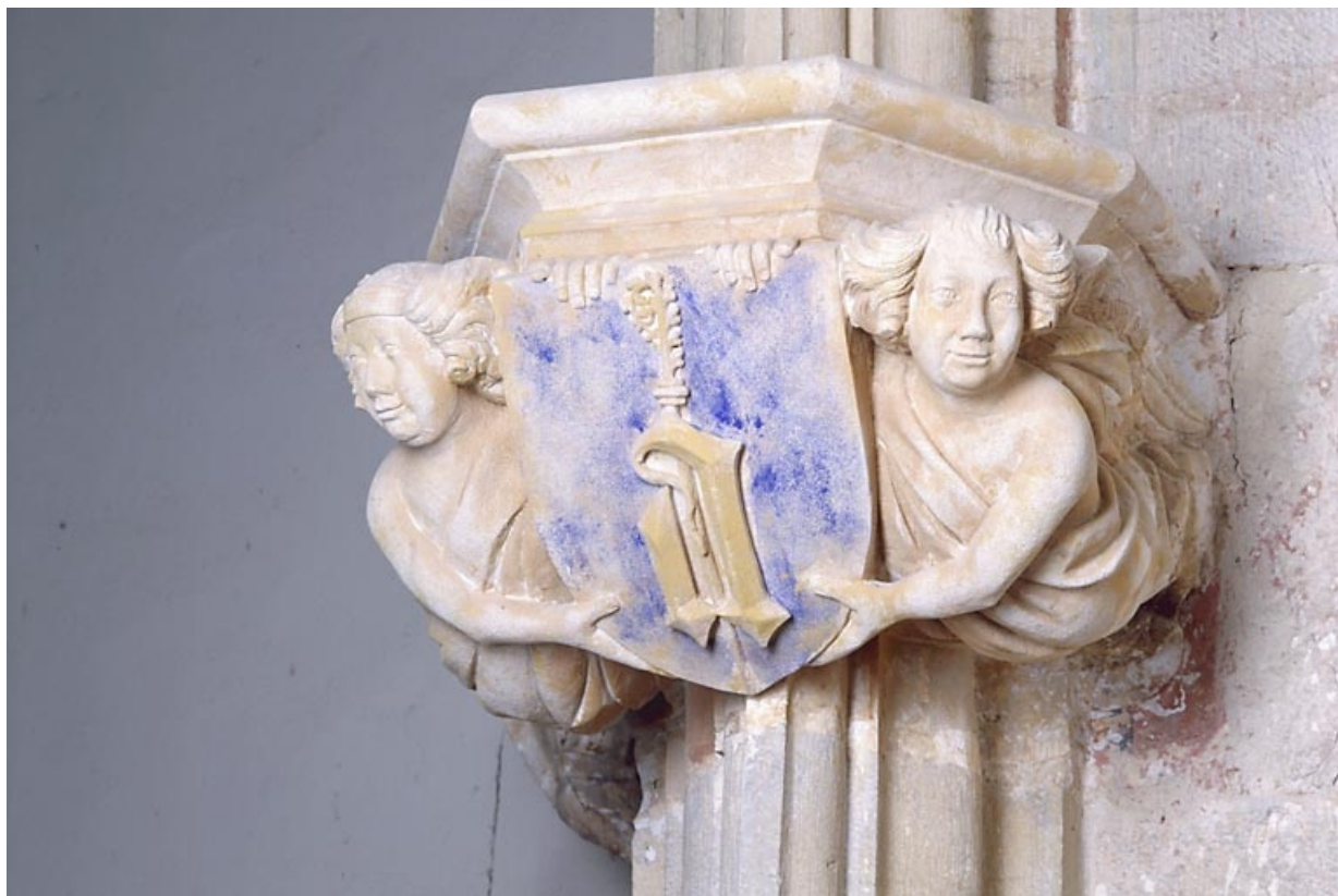
Console nord-est, vue de trois quarts. 39, Baume-les-Messieurs