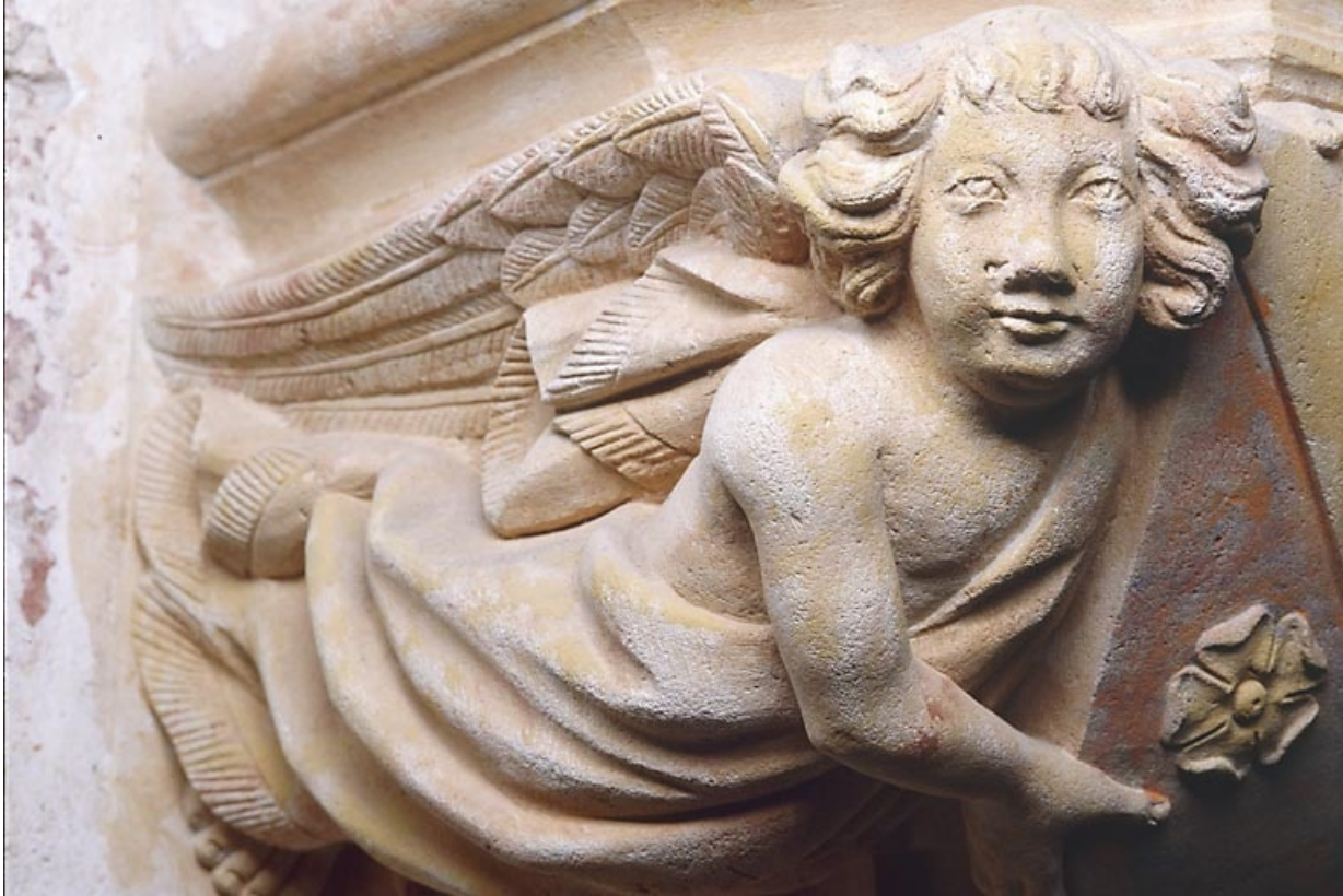
Console nord-ouest, détail de l'ange de gauche.