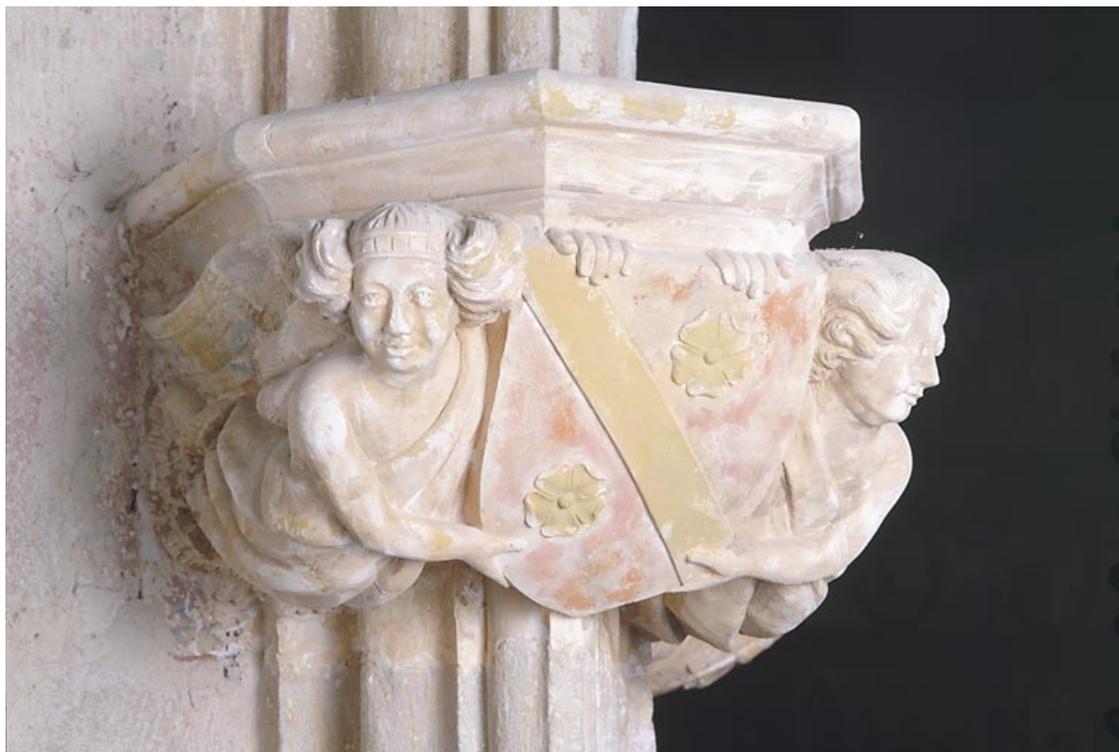
Console sud-est, vue de trois quarts. 39, Baume-les-Messieurs