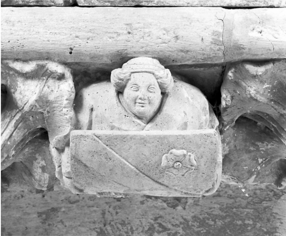
Grande console orientale : détail, ange portant les armoiries d'Amé de Chalon. 39, Baume-les-Messieurs