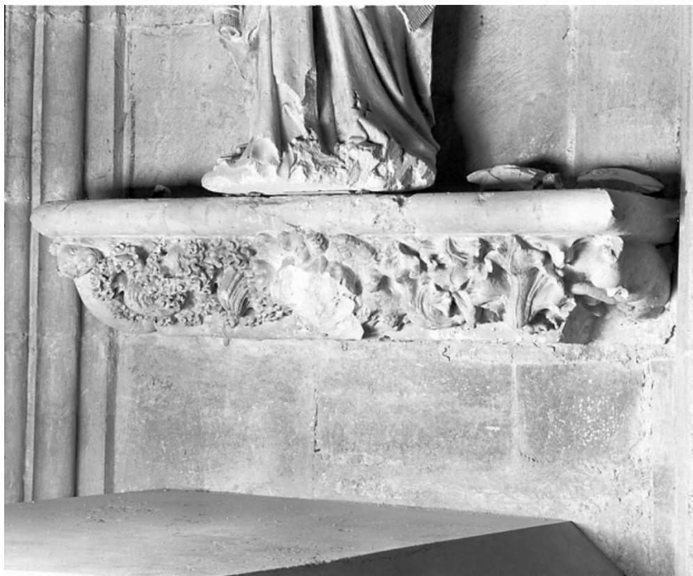
Grande console occidentale : vue d'ensemble.