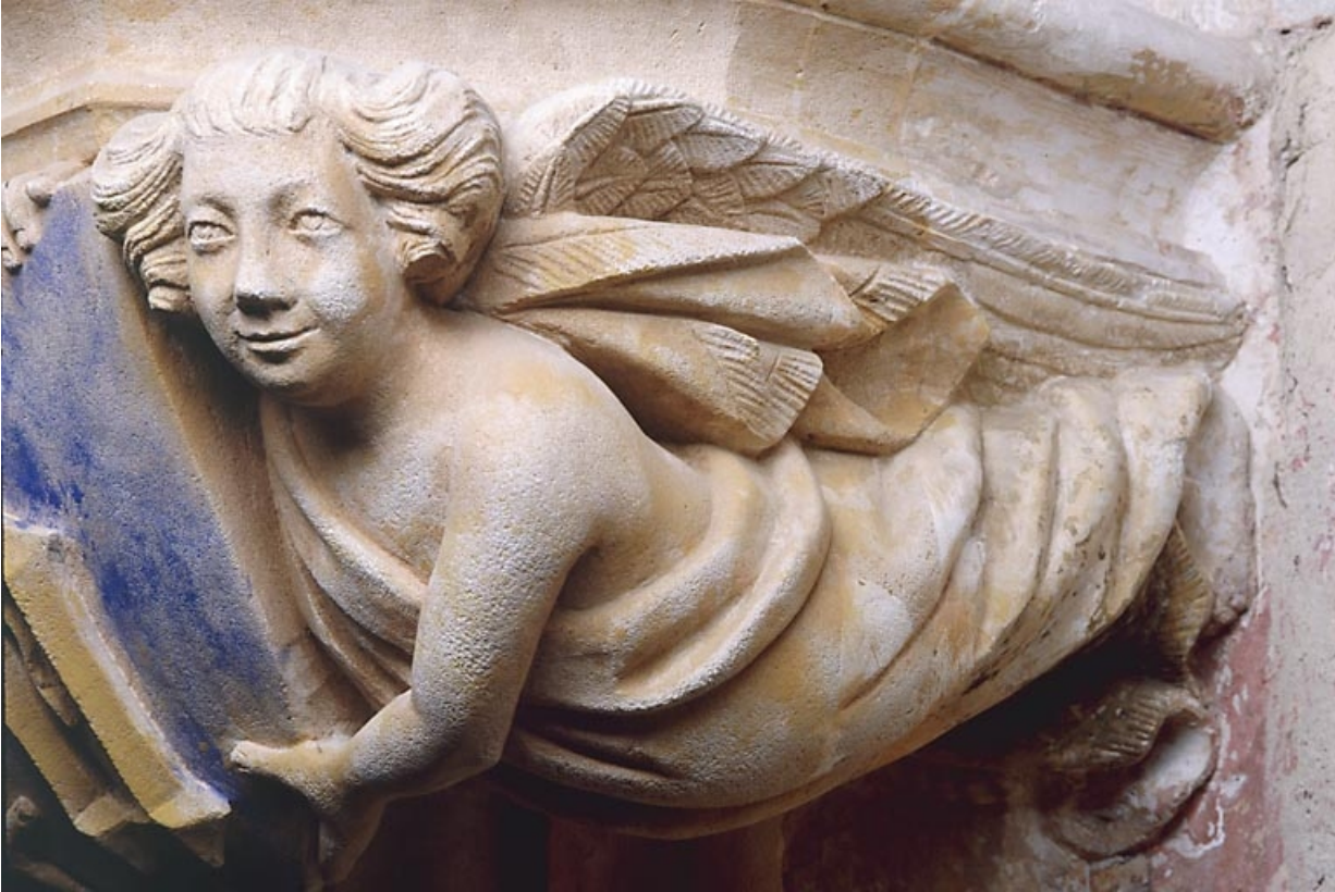
Console nord-est, détail de l'ange de droite.