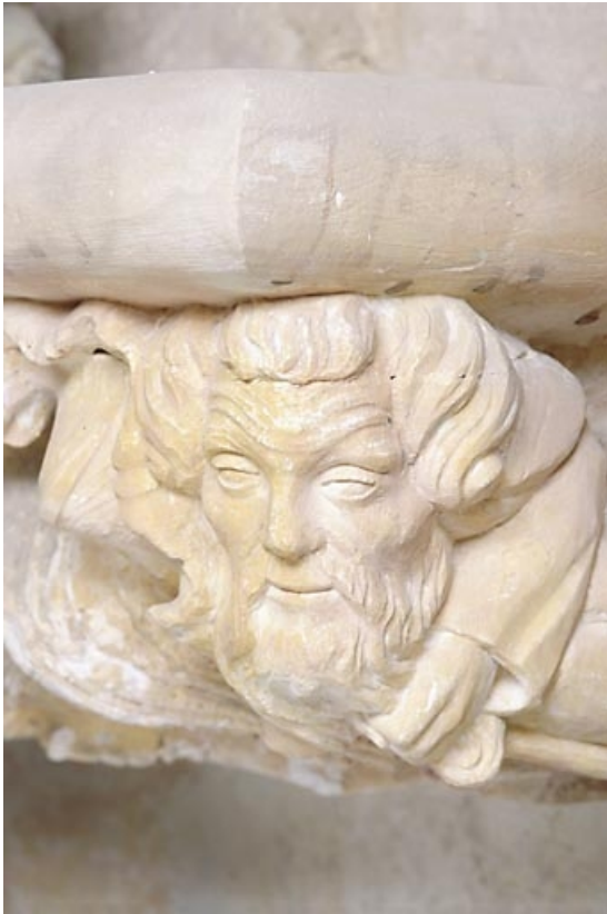
Grande console orientale : détail, tête à l'angle droit de la console orientale. 39, Baume-les-Messieurs