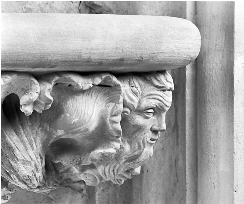
Grande console orientale : détail, tête à l'angle droit de la console orientale, vu de profil. 39, Baume-les-Messieurs