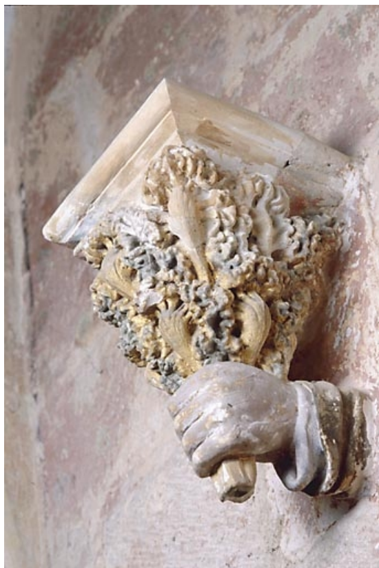
Main portant un bouquet, vue de trois quarts.