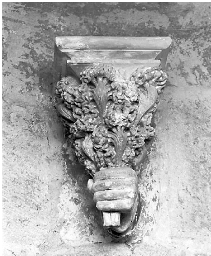
Main portant un bouquet, vue de face.