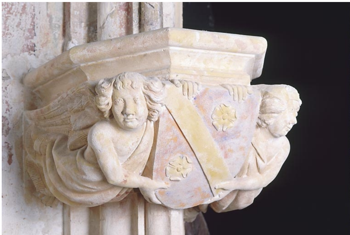
Console nord-ouest, vue de trois quarts. 39, Baume-les-Messieurs