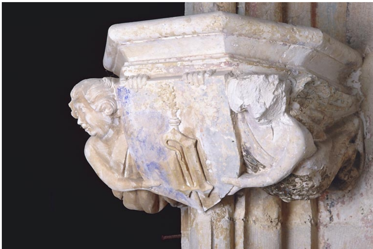
Console sud-ouest, vue de trois quarts. 39, Baume-les-Messieurs