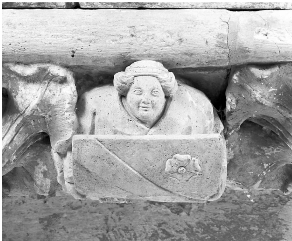
Grande console orientale : détail, ange portant les armoiries d'Amé de Chalon. 39, Baume-les-Messieurs