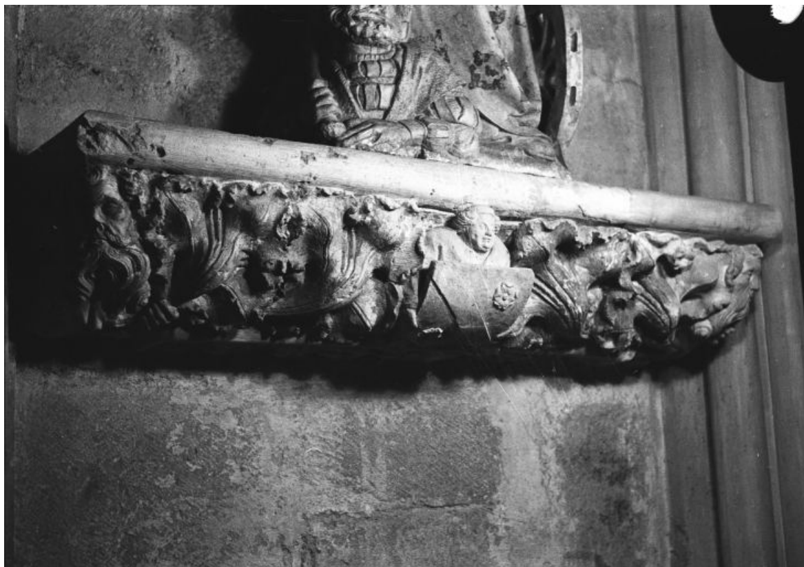
Grande console occidentale : vue de face.