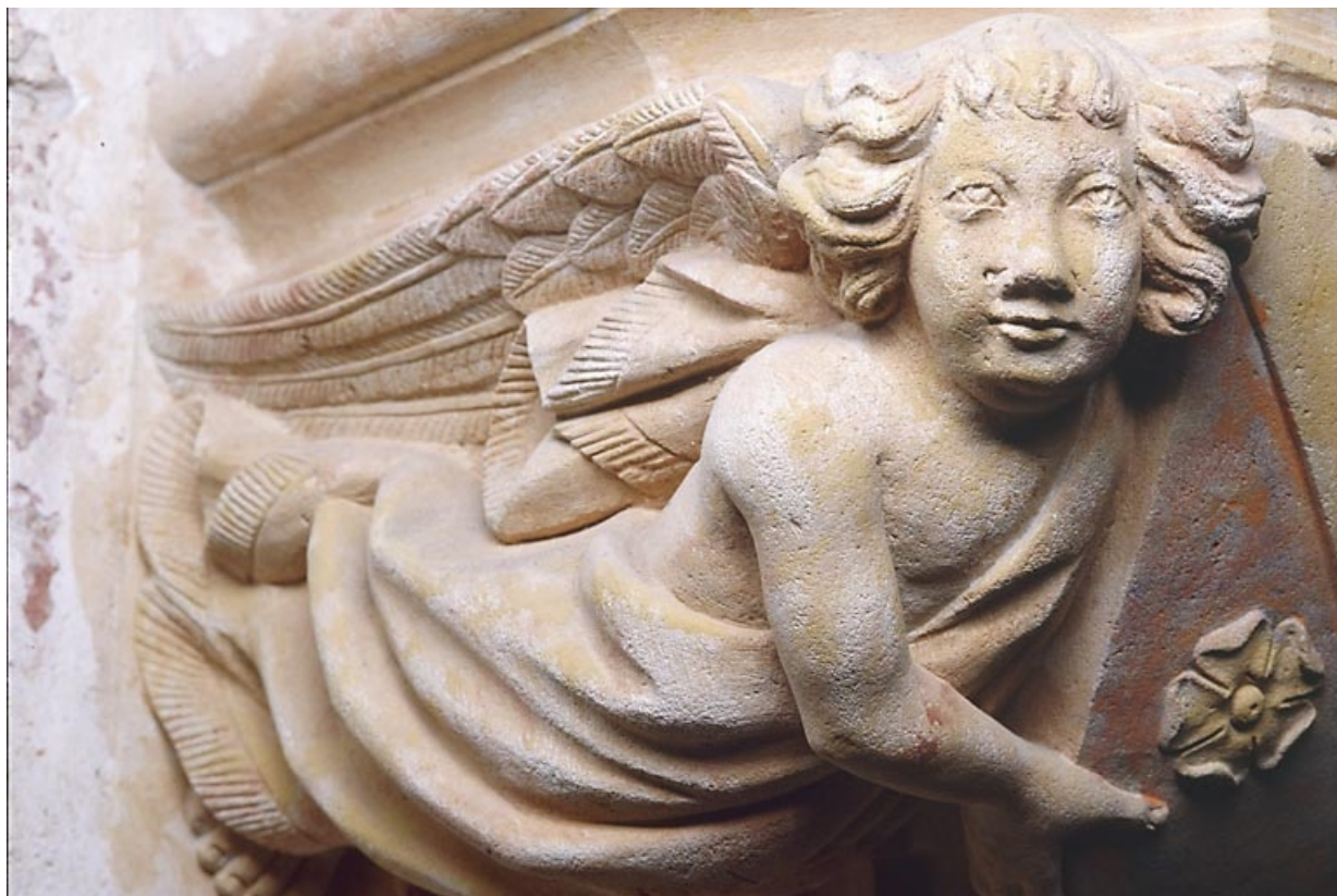
Console nord-ouest, détail de l'ange de gauche. 39, Baume-les-Messieurs