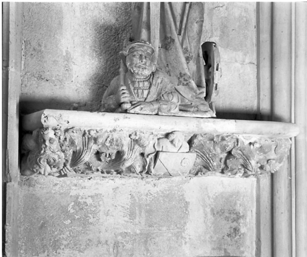
Grande console orientale : vue d'ensemble.