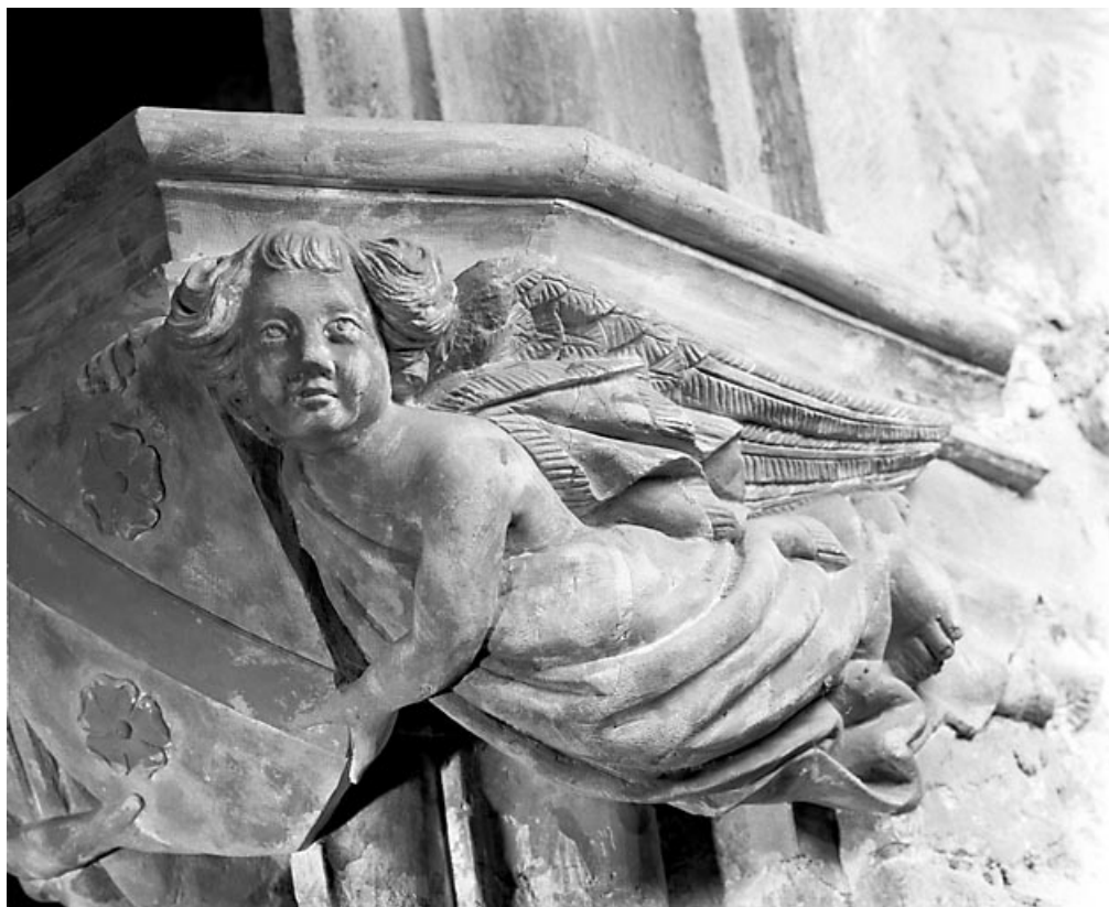
Console sud-est, détail de l'ange de droite. 39, Baume-les-Messieurs