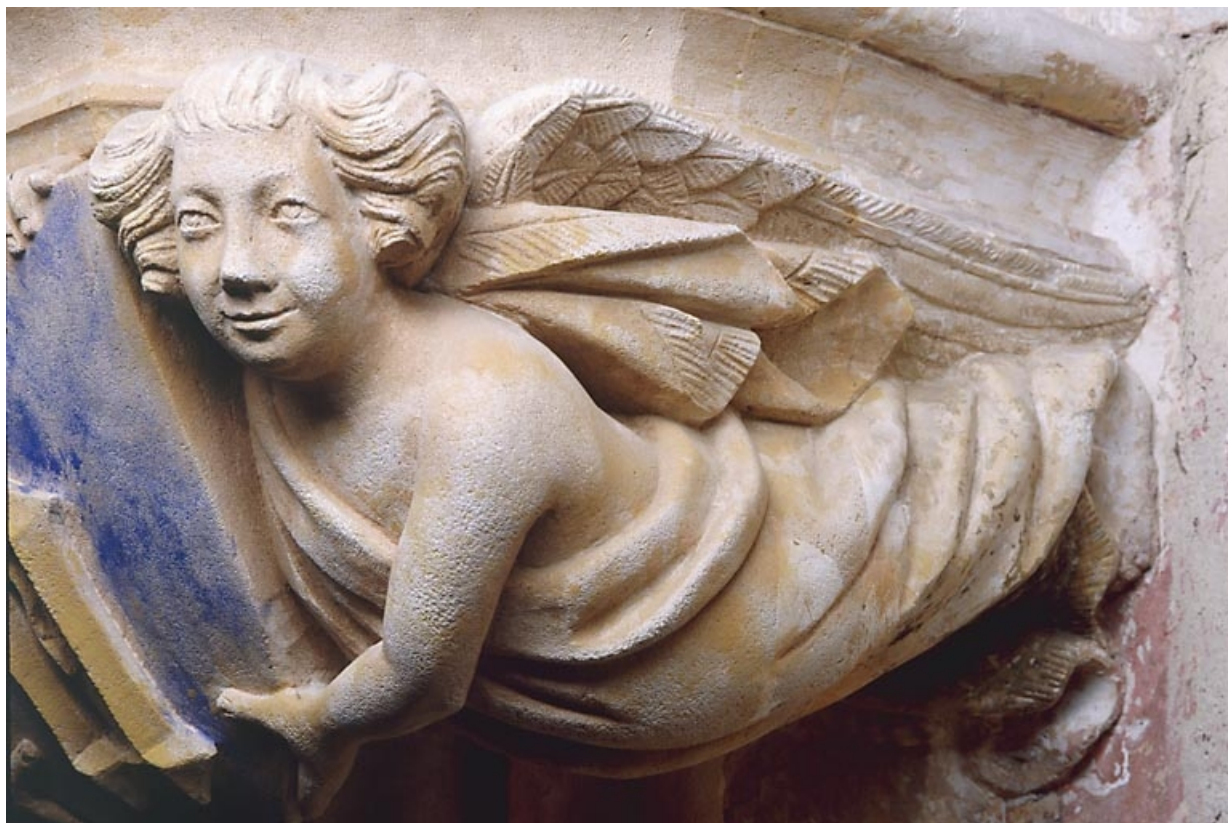
Console nord-est, détail de l'ange de droite. 39, Baume-les-Messieurs