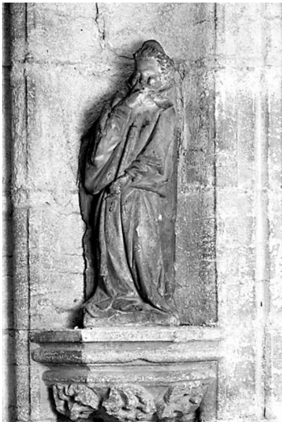
L'ange de droite.