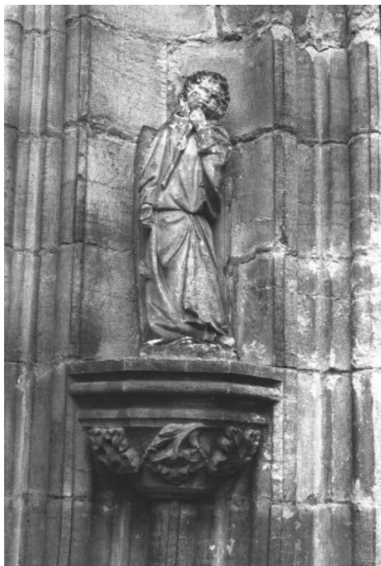
Statuette : ange buccinateur, portail occidental. 39, Baume-les-Messieurs