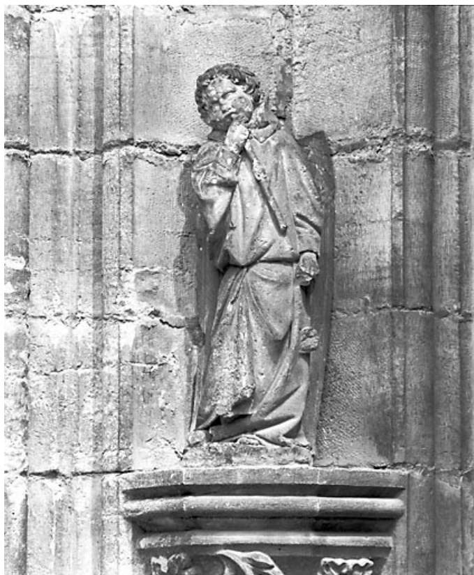
L'ange de gauche.