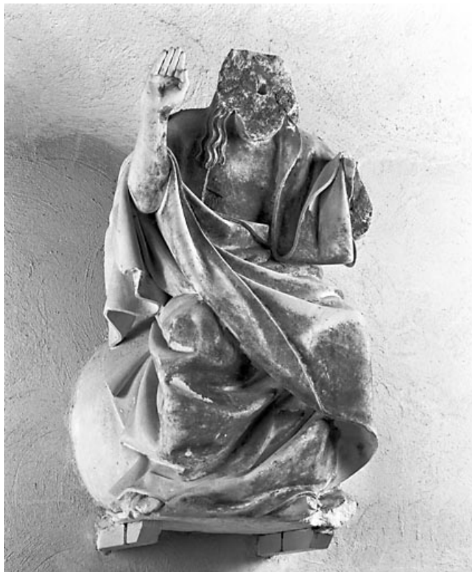
Vue de trois quarts.