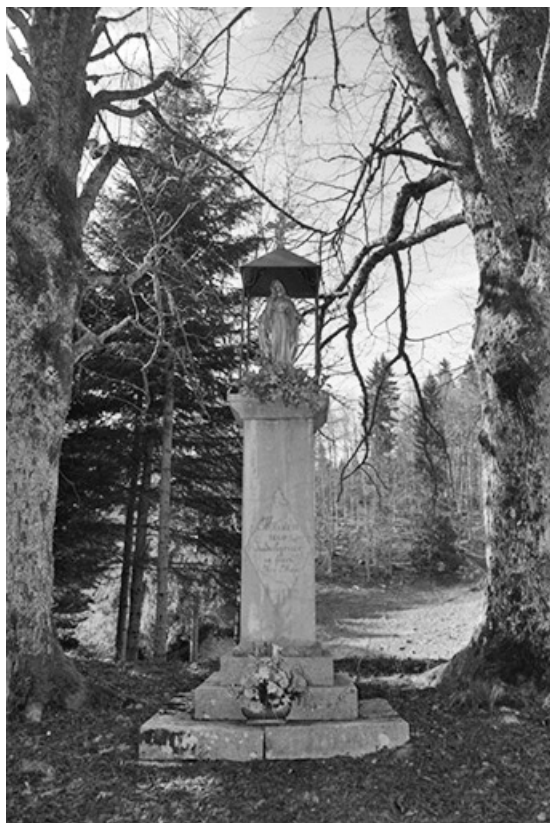
Vue générale, de face.

39, Longchaumois, lieudit : Bourbouillon