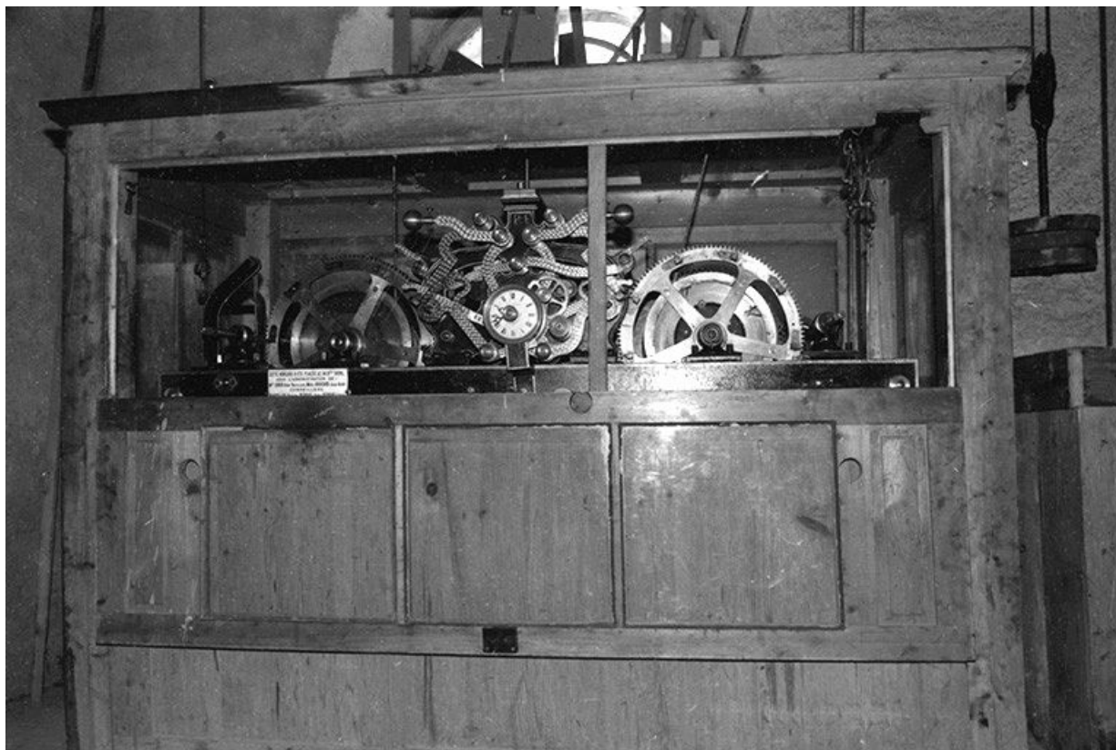
Vue d'ensemble, de face.