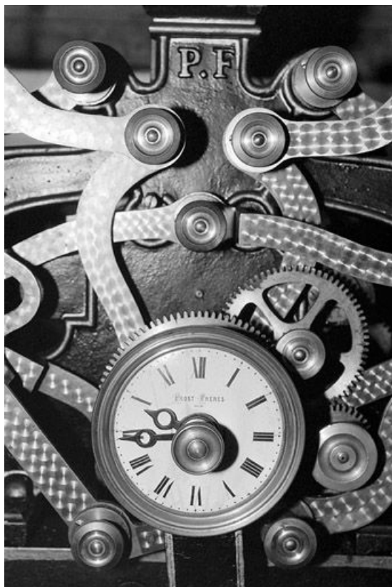
Cadran de réglage et de contrôle, et initiales. 39, Bellefontaine C.D. 18