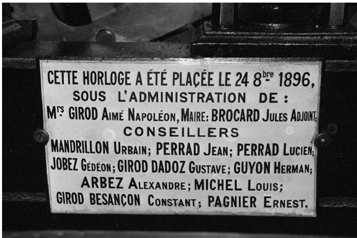
Plaque émaillée donnant la date d'installation et le nom des commanditaires.