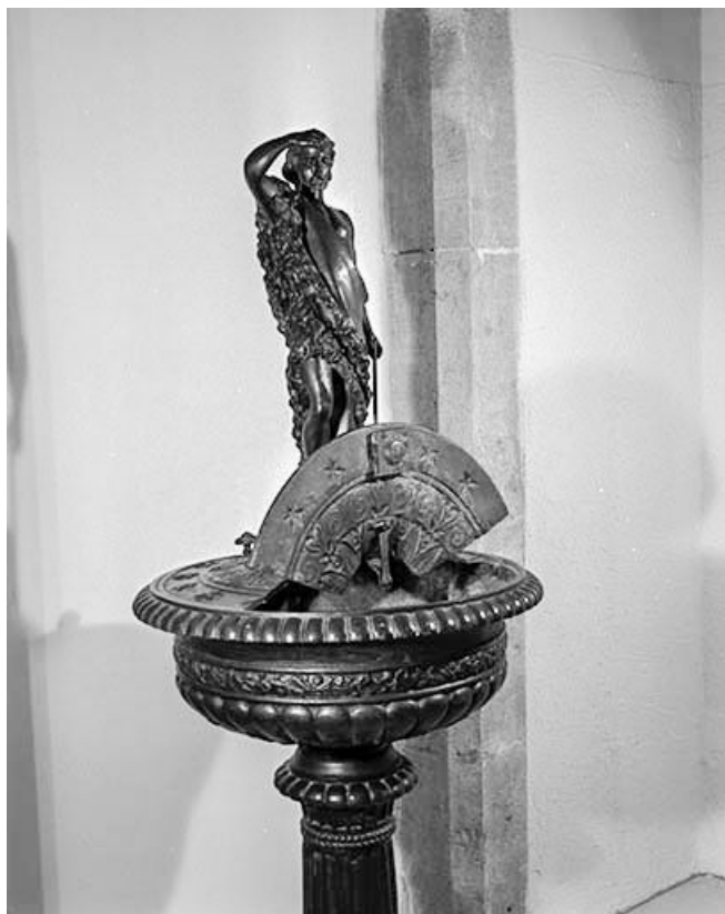
Vue de la partie supérieure.