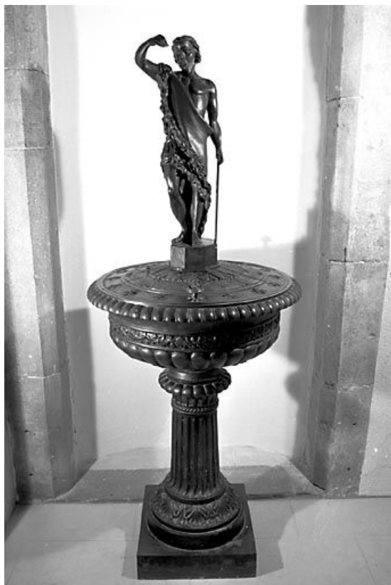
Vue générale, couvercle fermé.