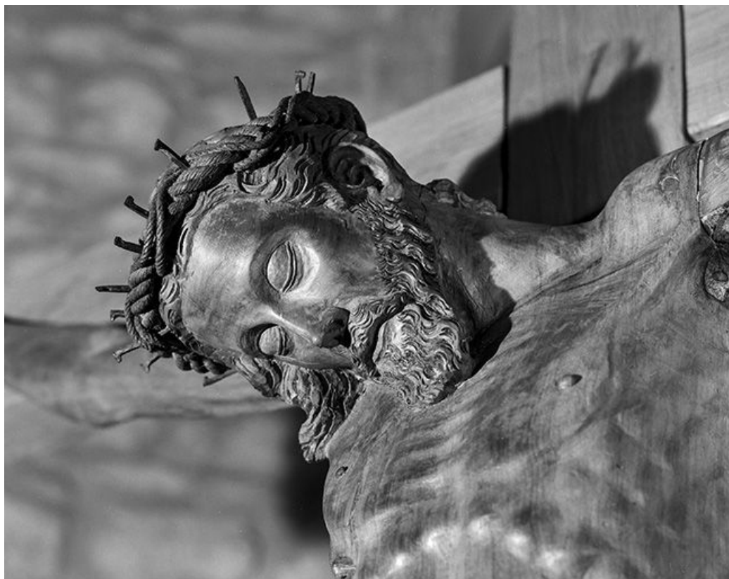
Le visage du Christ, vu de trois quarts.