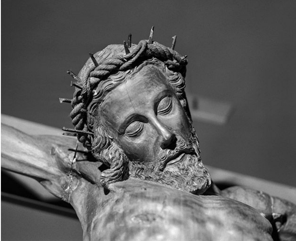
Le visage du Christ, vu du dessous.