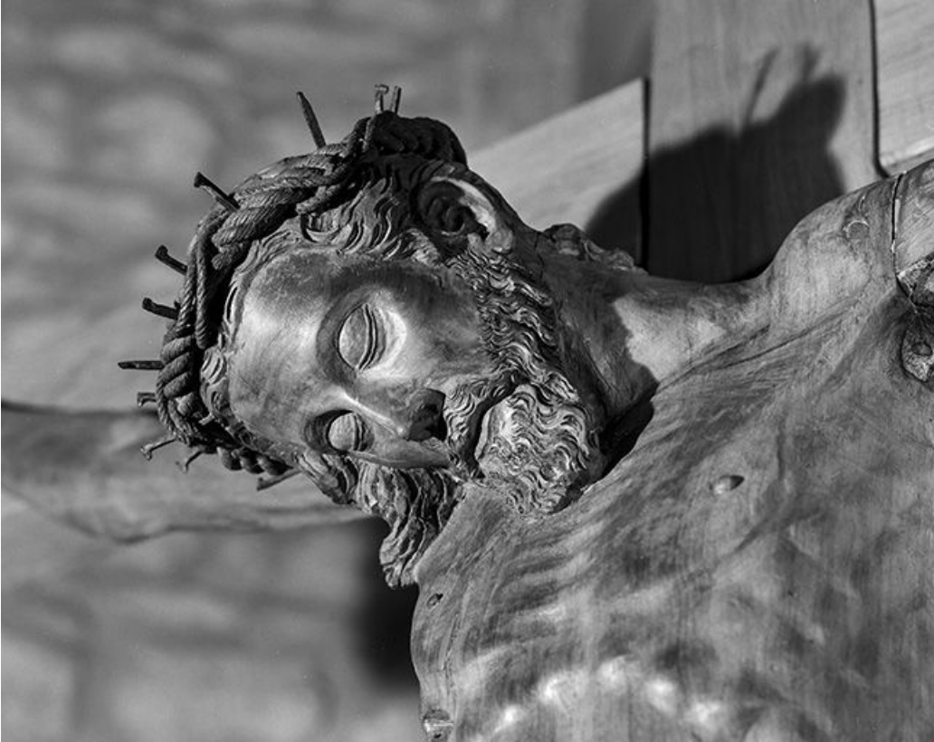
Le visage du Christ, vu de trois quarts.