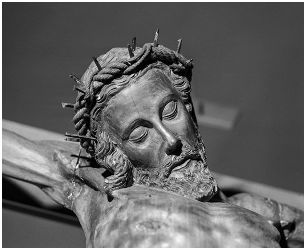
Le visage du Christ, vu du dessous.