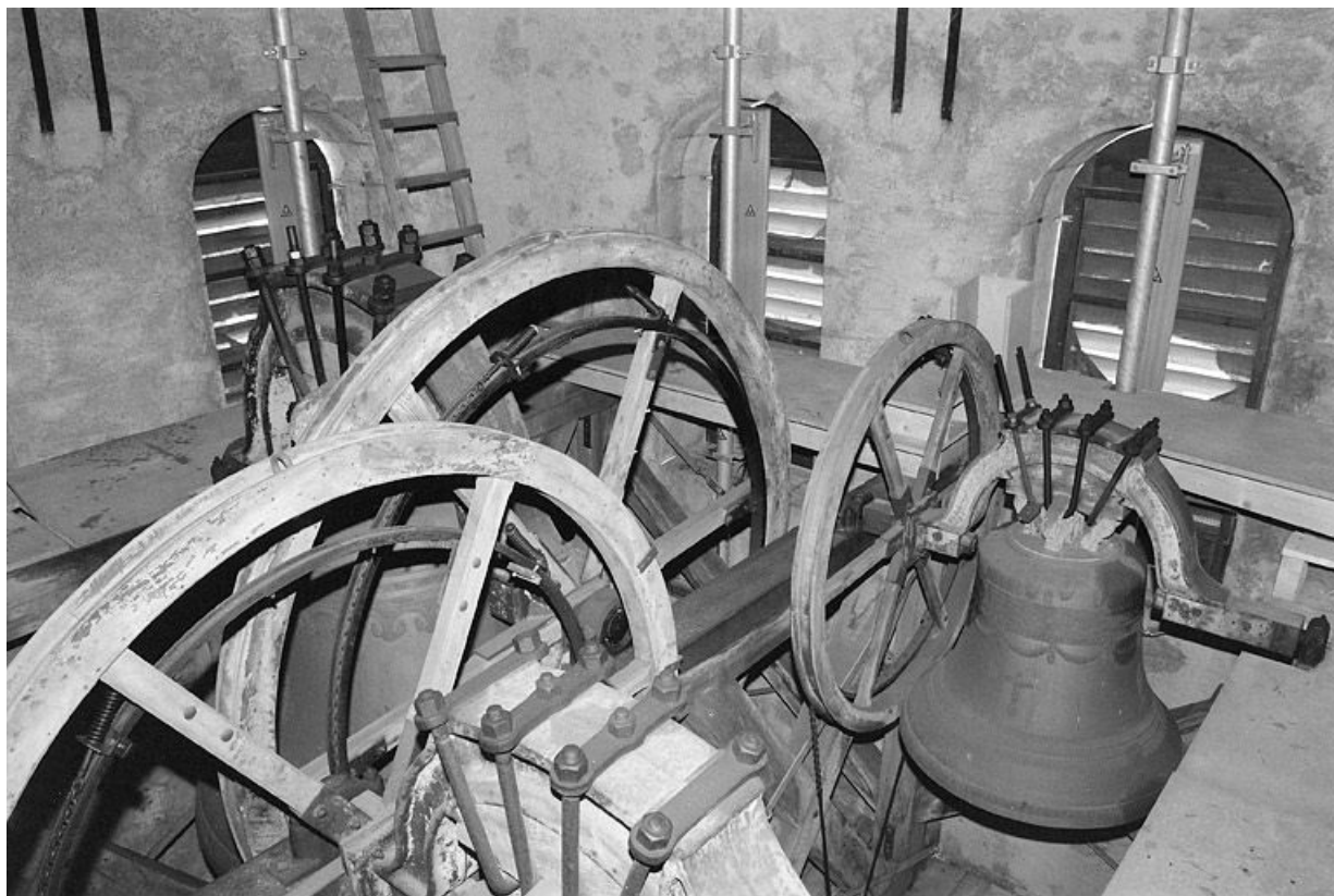
Vue d'ensemble du beffroi de charpente et de la 3e cloche.