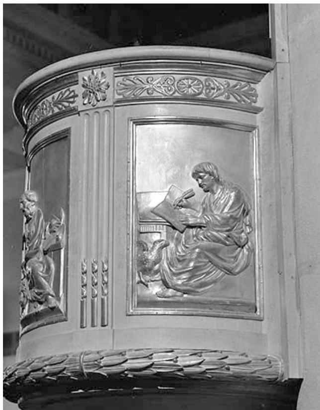
Quatrième panneau de la cuve : saint Jean.