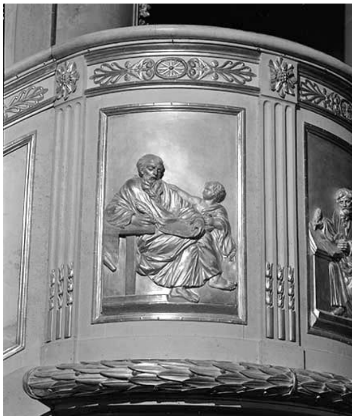
Premier panneau de la cuve : saint Matthieu.