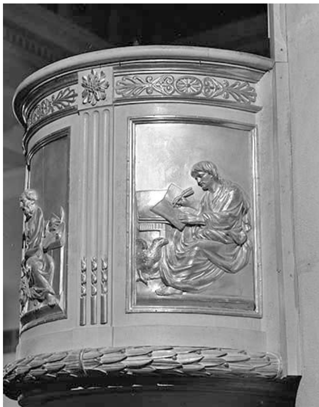
Quatrième panneau de la cuve : saint Jean.