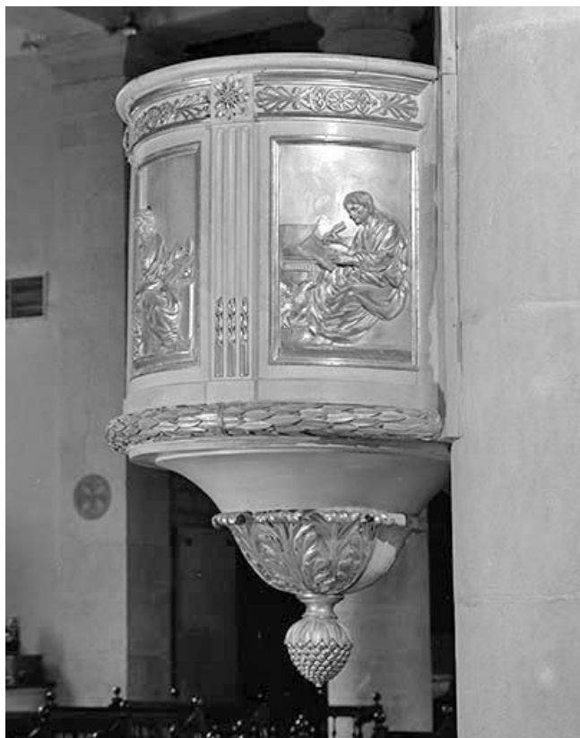
La cuve, vue de profil.