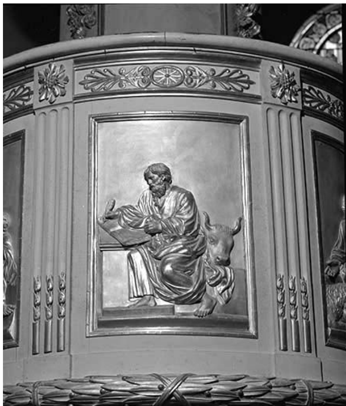
Deuxième panneau de la cuve : saint Luc.