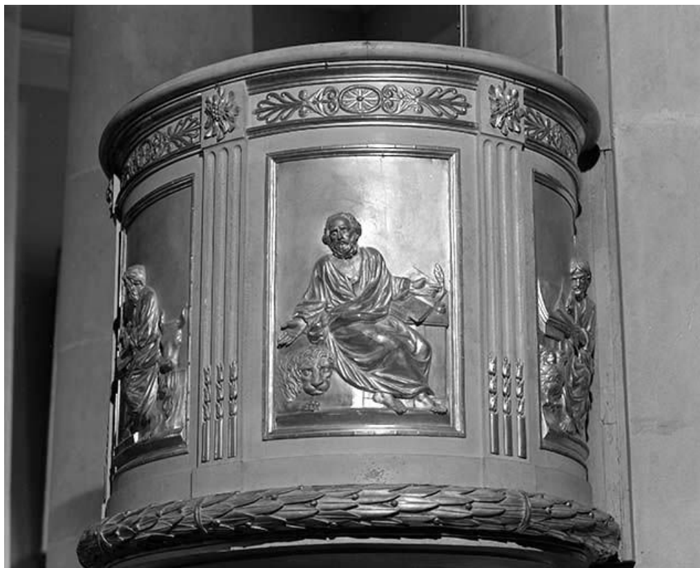
Troisième panneau de la cuve : saint Marc.