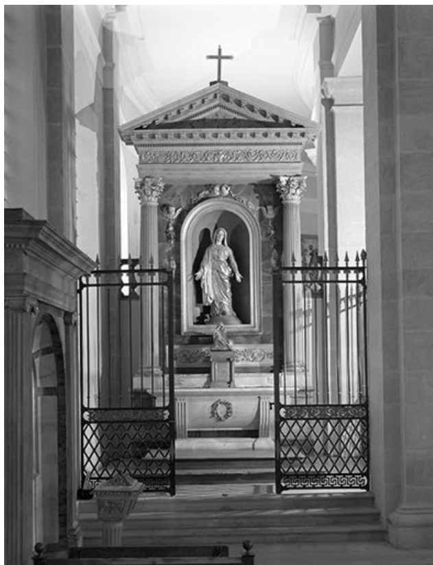
L'autel retable nord.