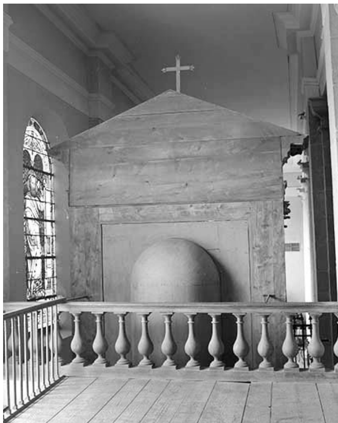
Partie supérieure du revers du retable sud.