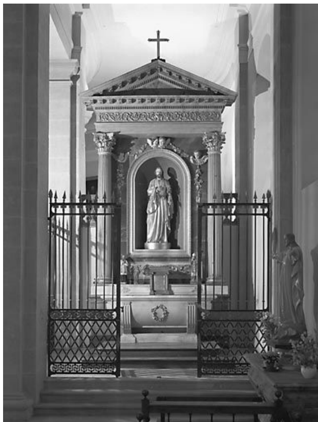
L'autel retable sud.