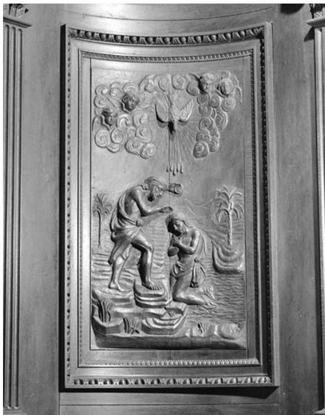
Le panneau du retable : Le Baptême du Christ.