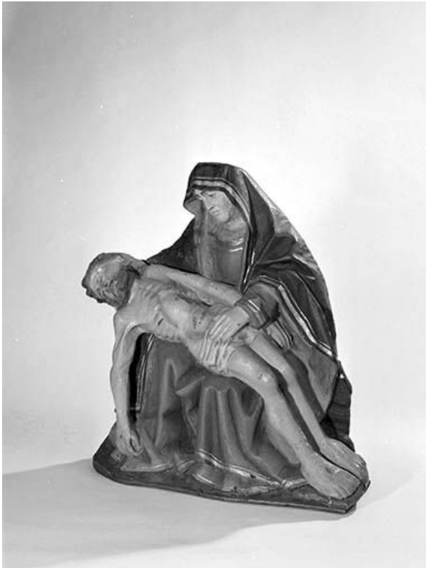
Vue de trois quarts.