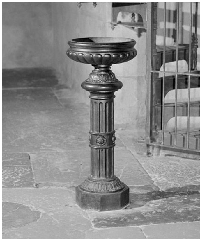
Vue générale d'un bénitier.