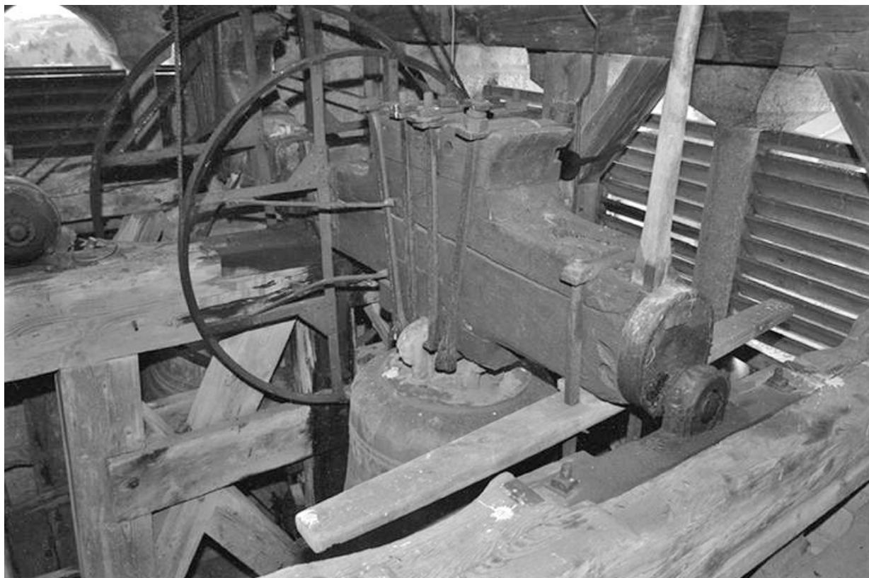
Vue d'ensemble, du sud-ouest. 39, Longchaumois rue de l' Eglise