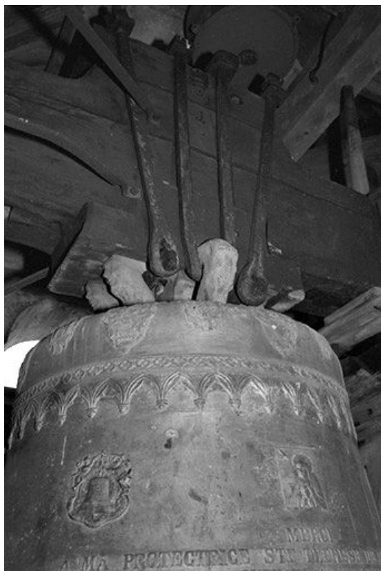
Partie supérieure de la cloche (côté sud-ouest) : décor et anses.