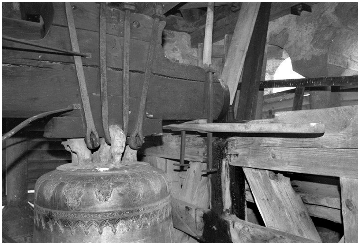
Mouton et anses, côté sud-ouest.