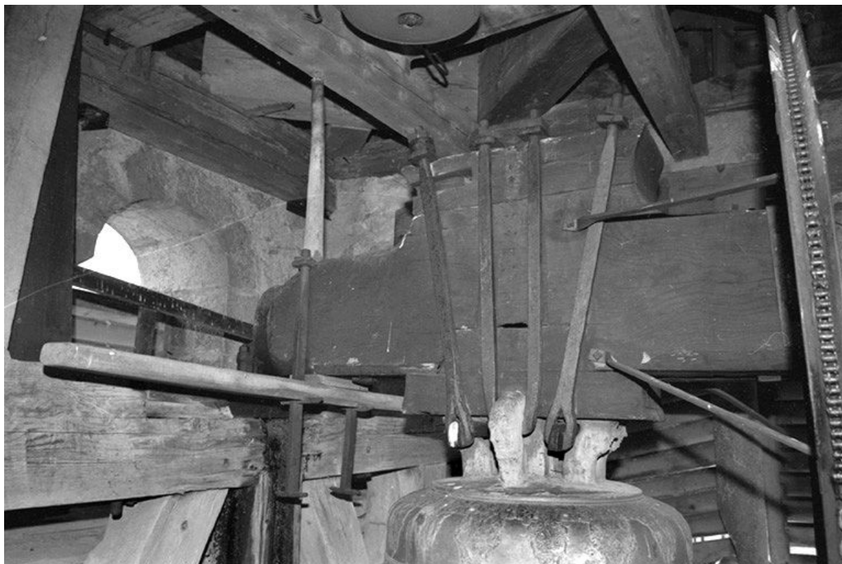
Mouton et anses, côté sud-est. 39, Longchaumois rue de l' Eglise