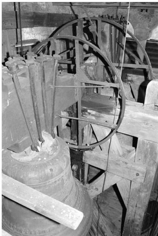
Vue d'ensemble, du sud-est.