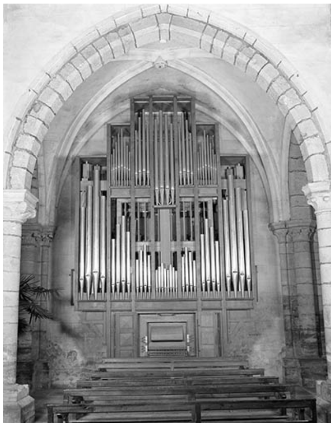
Grand orgue, vu de face horizontale.