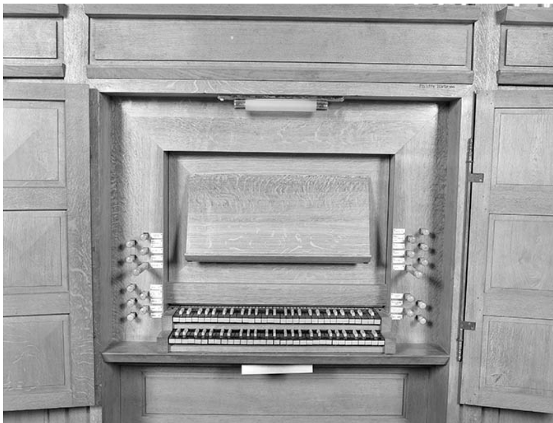
Console en fenêtre, vue de face.