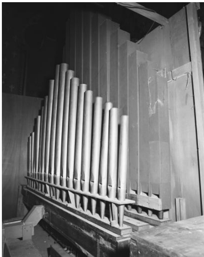
Tuyauterie de pédale, vue de trois quarts droit.