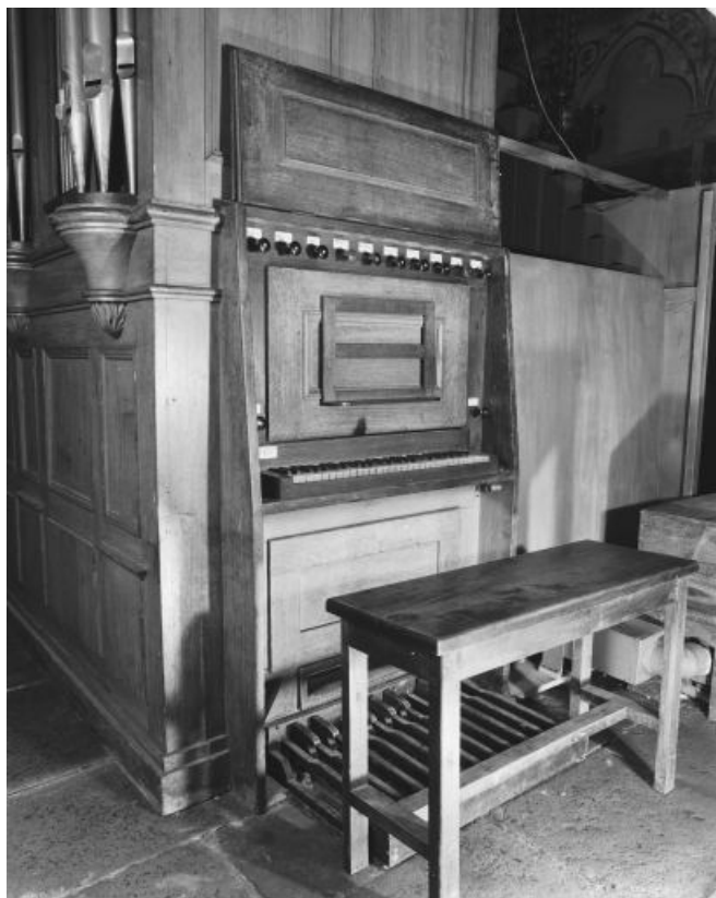
Console en fenêtre latérale, vue de trois quarts gauche.