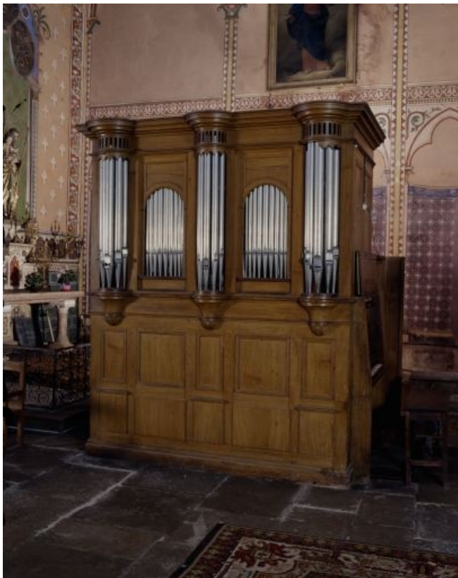
Orgue de chœur, vu de trois quarts droit.