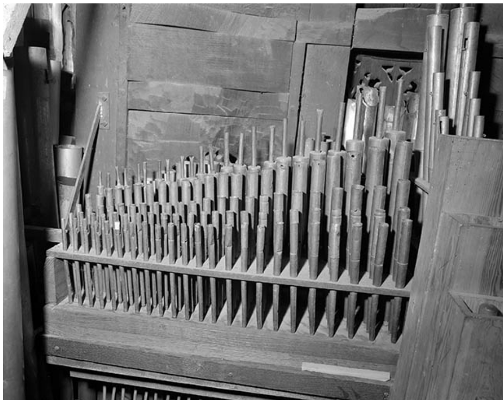
Tuyauterie : cornet du grand orgue, vu de face.