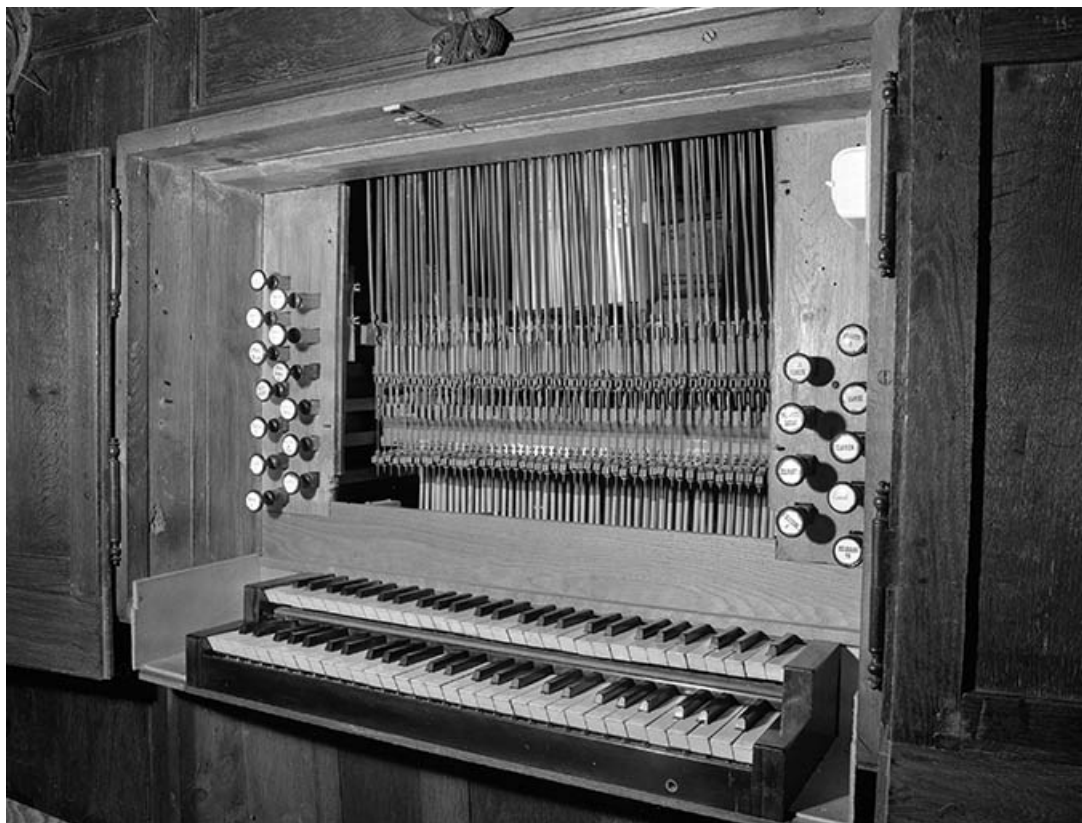
Console en fenêtre, vue de trois quarts droit.