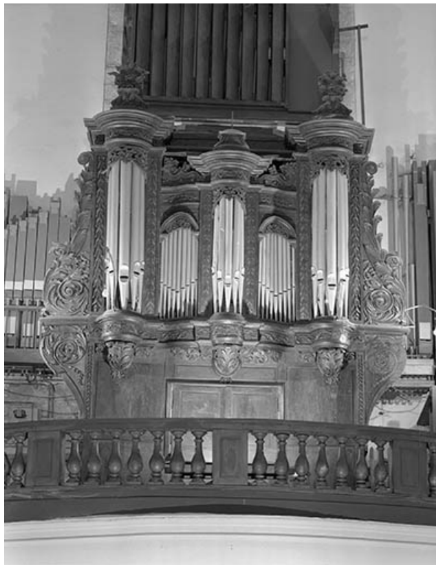
Grand orgue, vu de face en contre-plongée.