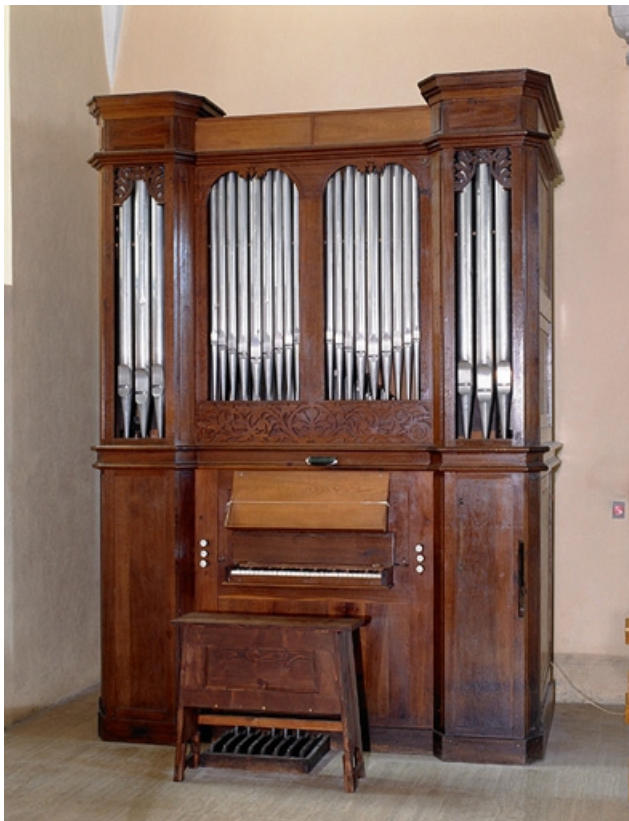
Vue d'ensemble, de trois quarts gauche.