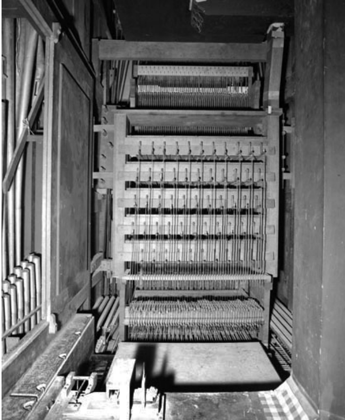
Mécanique de la machine pneumatique Barker. 39, Poligny