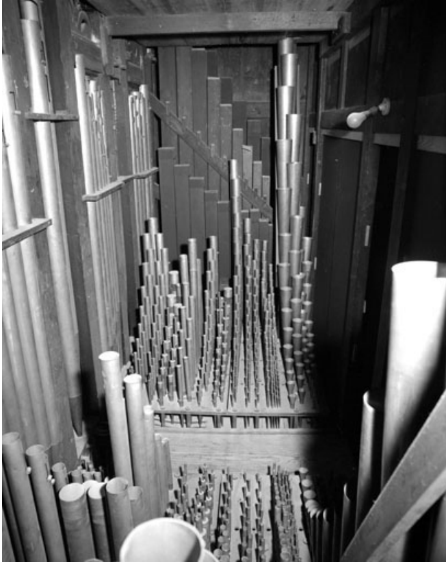
Détail des tuyaux.