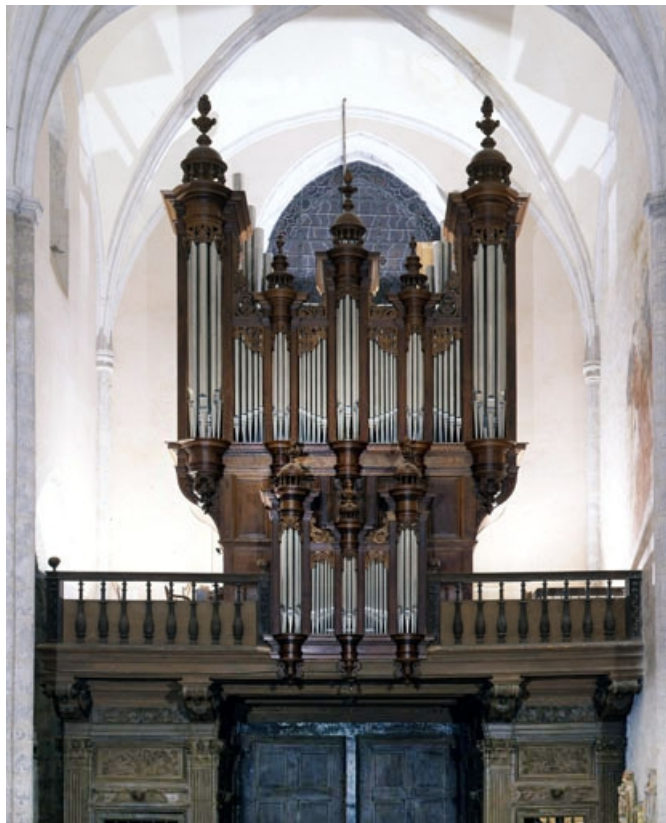
Grand orgue, vu de face.