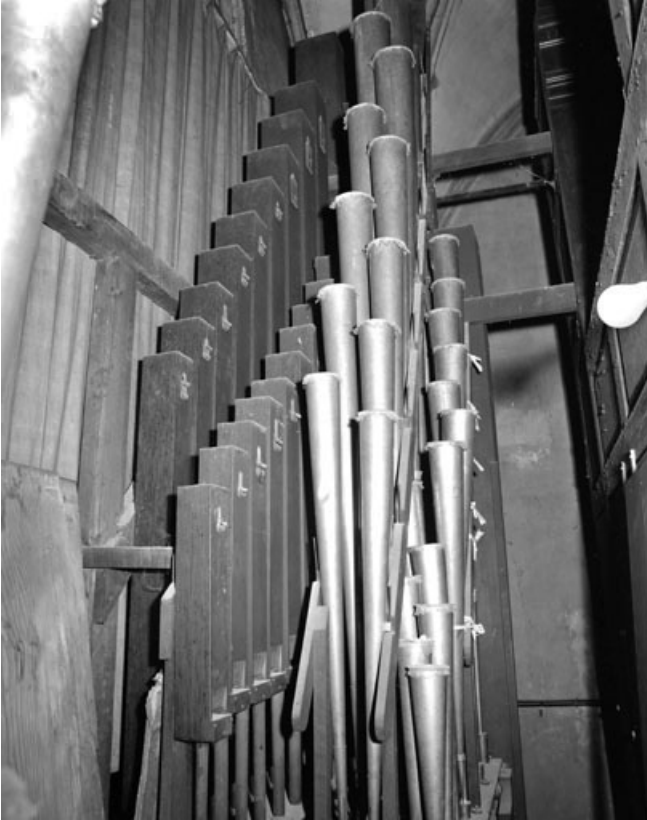
Tuyaux de pédale.