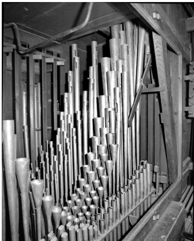
Tuyaux du récit expressif (installe dans le positif).