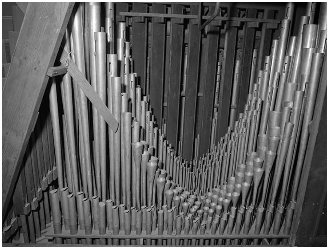
Tuyauterie du récit, vue générale de face.