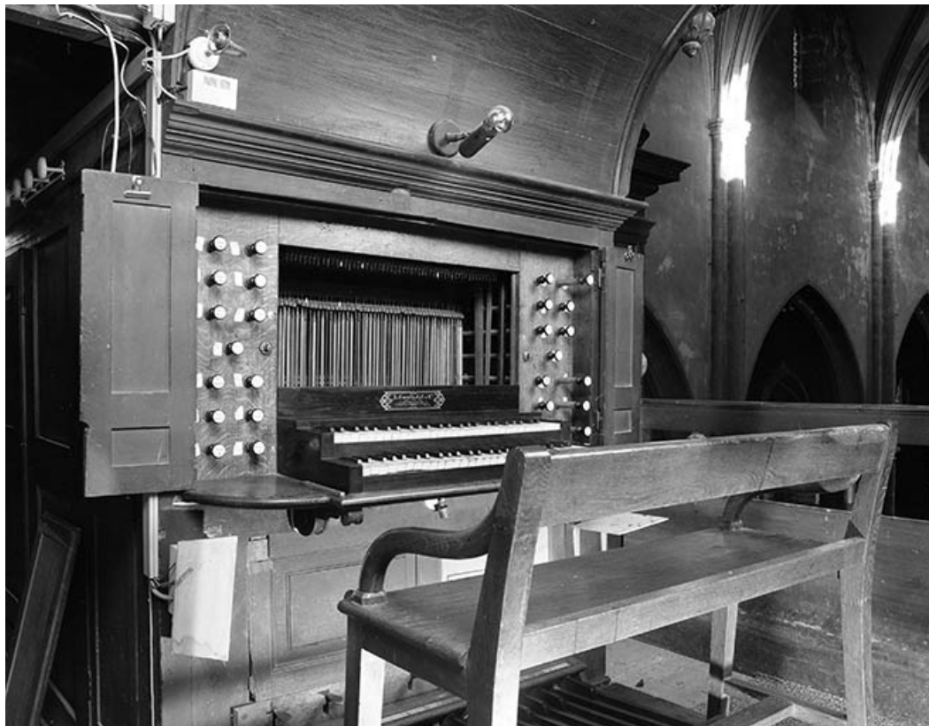
Console en fenêtre, vue de trois quarts gauche. 39, Poligny