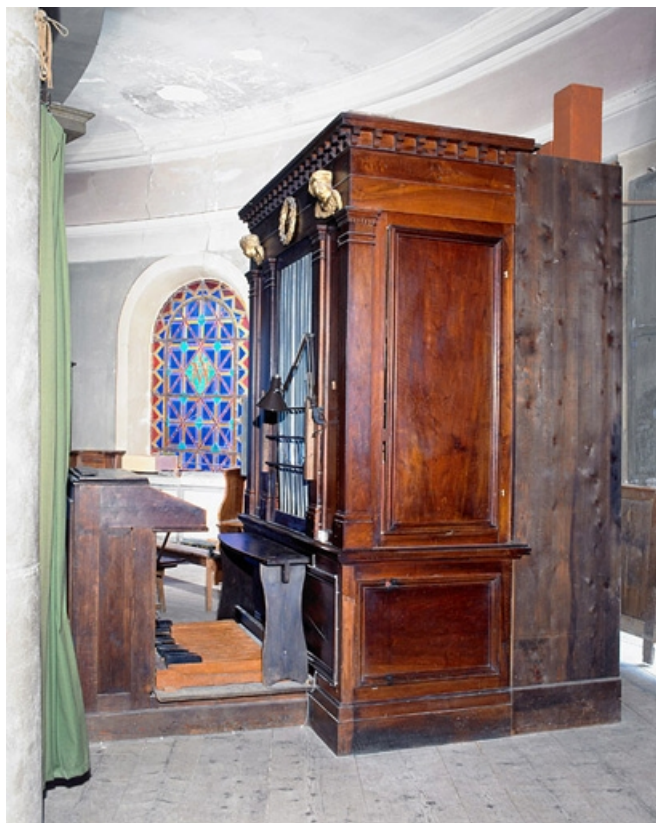
Vue d'ensemble, de trois quarts droite. 39, Morbier