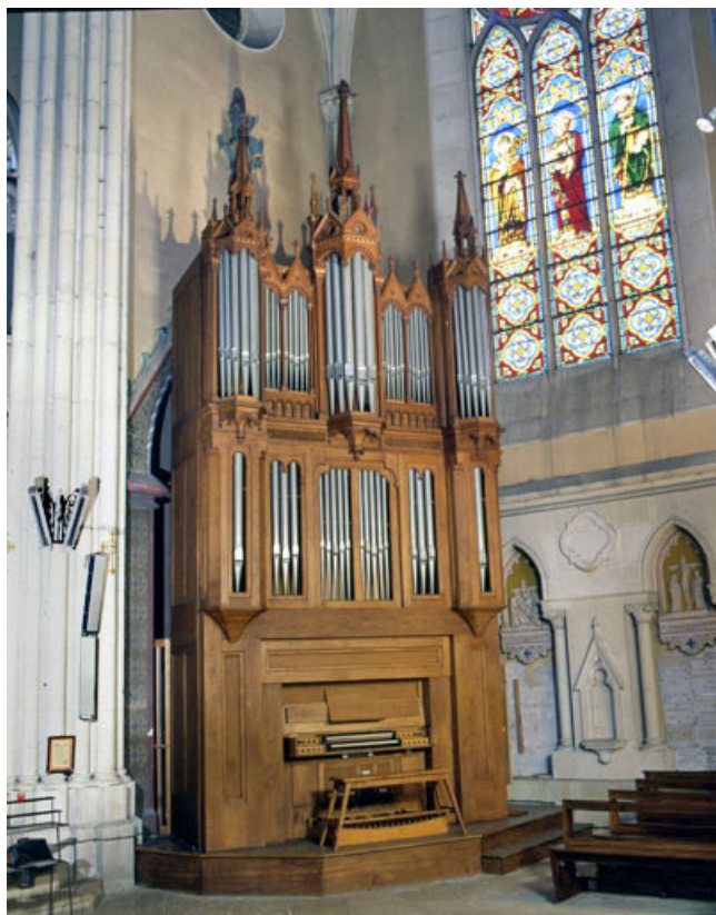
Grand orgue, vu de trois quarts gauche.