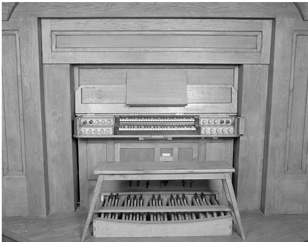
Console en fenêtre, vue de face.