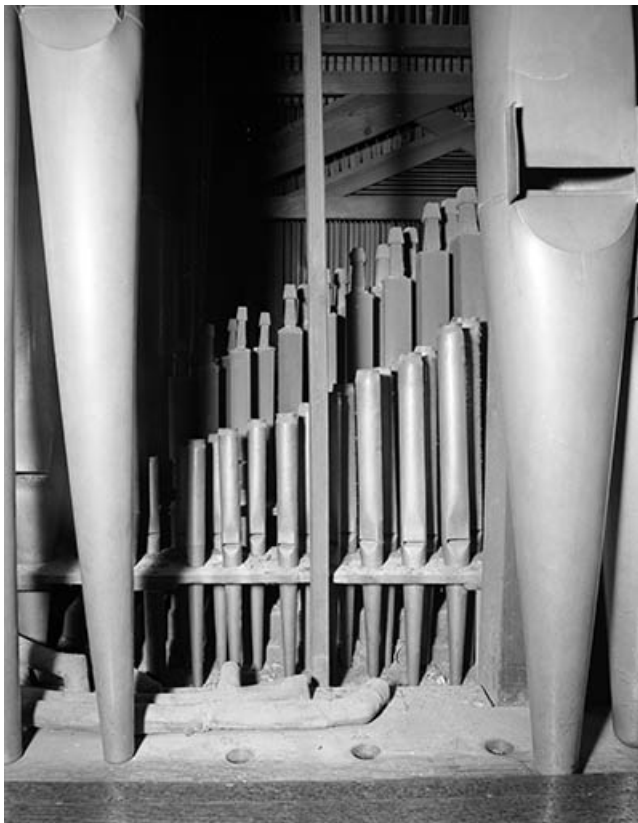
Tuyauterie du clavier du grand orgue à travers la montre, vue de face. 39, Dole place Nationale