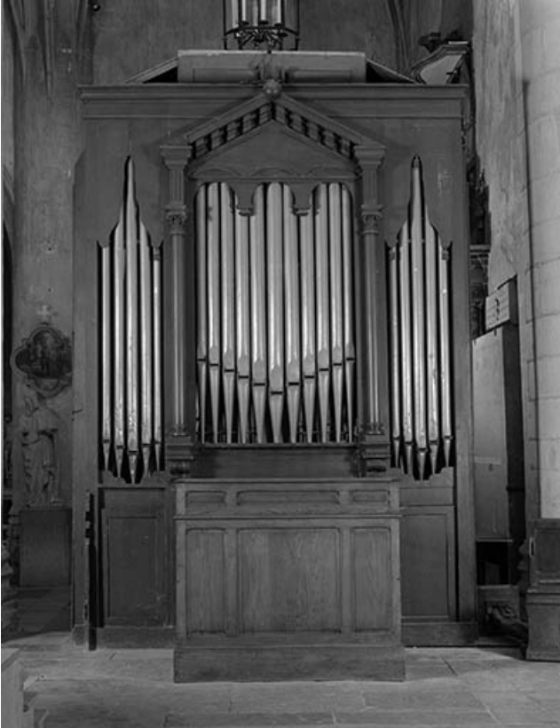
Orgue de chœur, vu de face.