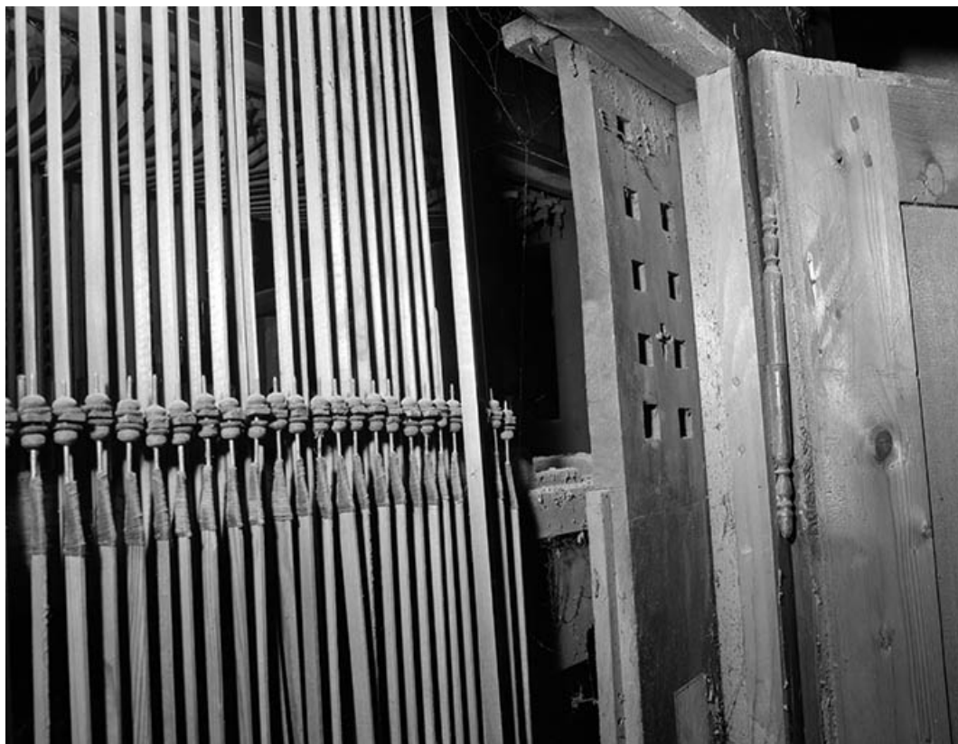
Ancienne console en fenêtre, MECANIQUE, vues de trois quarts gauche. 39, Dole place Nationale