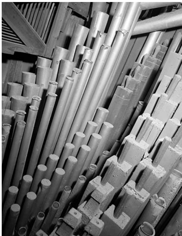
Tuyauterie du clavier du grand orgue, vue de trois quarts droit. 39, Dole place Nationale