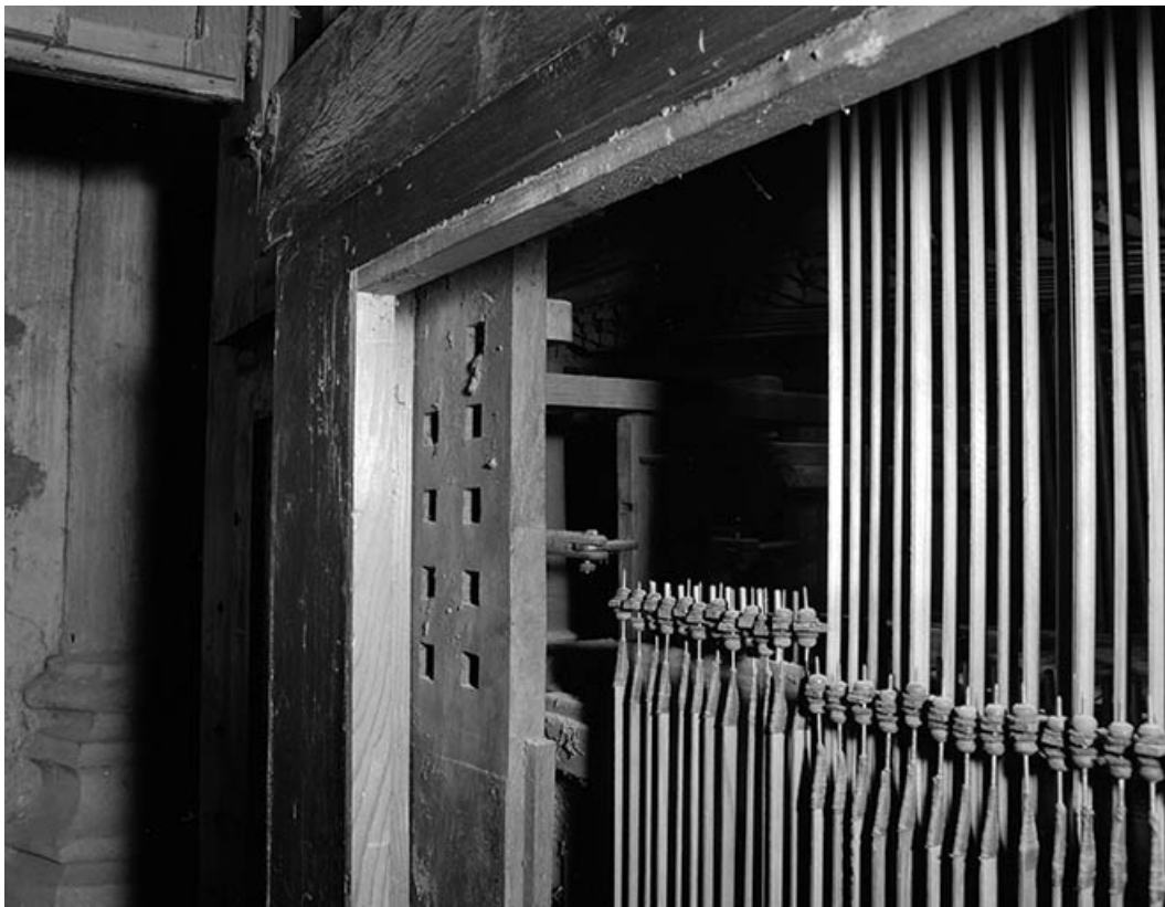
Ancienne console en fenêtre, MECANIQUE, vues de trois quarts droit. 39, Dole place Nationale