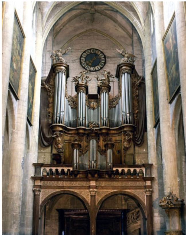
Grand orgue vu de face.