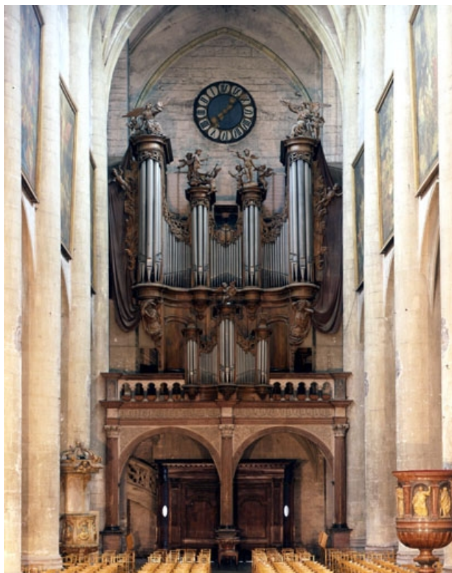
Grand orgue, vu de face.