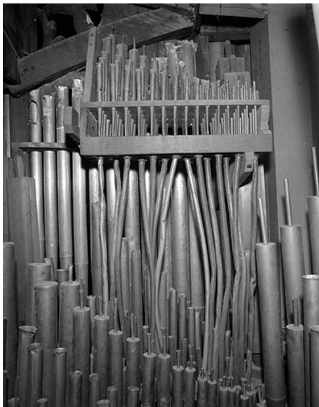
Jeux de cornet du positif, vu de face.