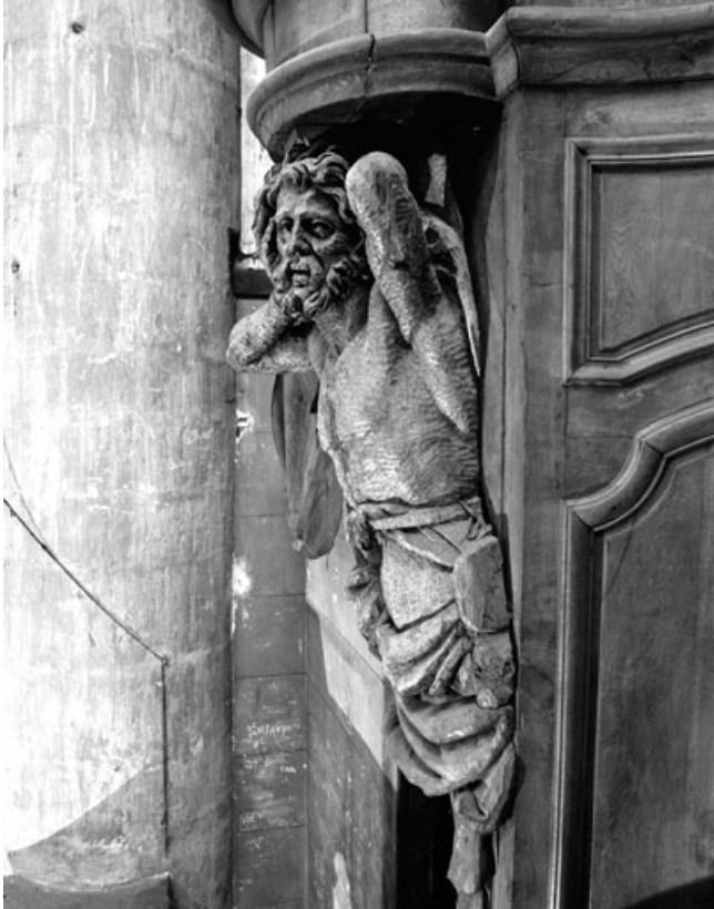
Détail de l'atlante gauche du buffet.