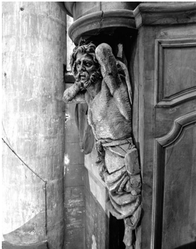
Détail de l'atlante gauche du buffet.