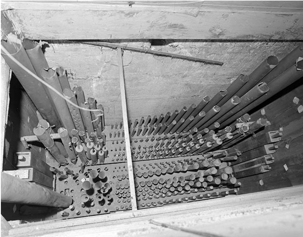
Tuyauterie de l'écho, vue en plongée. 39, Dole place Nationale