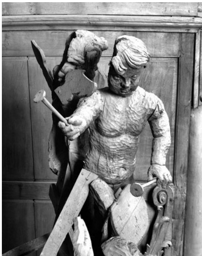
Détail des angelots de la petite tourelle de droite.