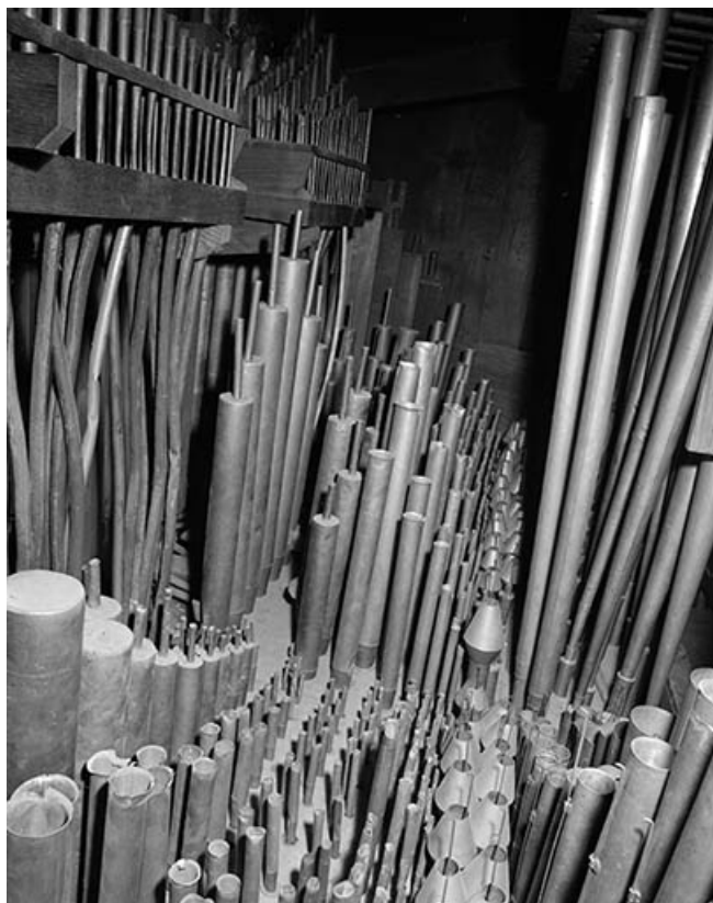
Tuyauterie du positif, vue en plongée de trois quarts droit. 39, Dole place Nationale