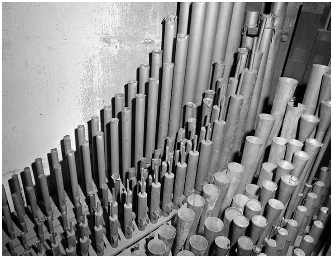
Tuyauterie de l'écho, vue de trois quarts gauche en plongée.