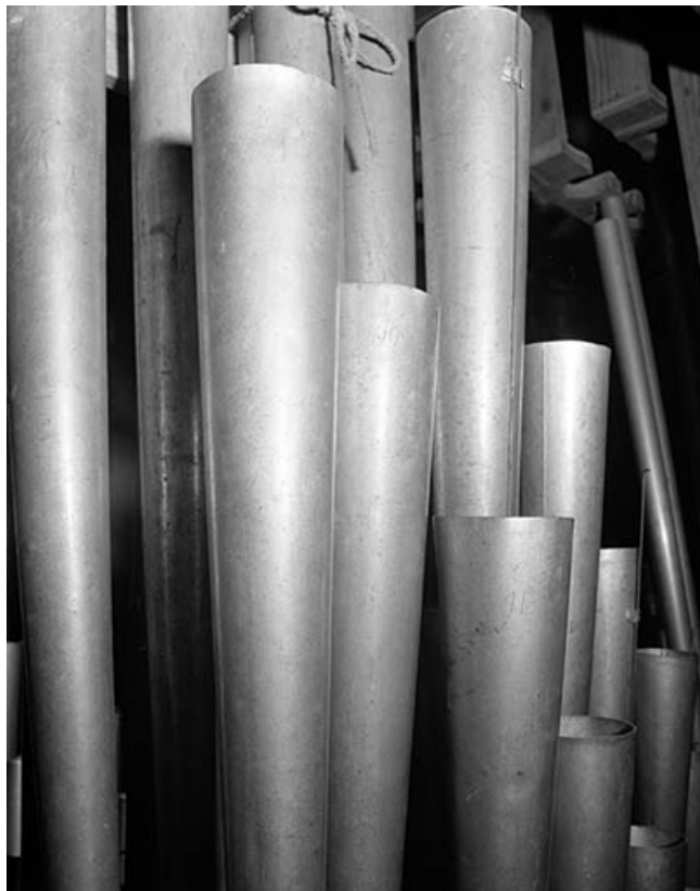
Tuyaux de trompette du positif, vus de face.