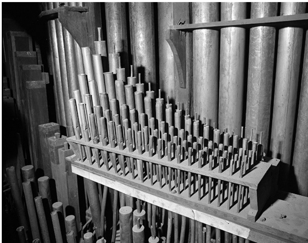
Tuyaux de cornet, vue de trois quarts droit.