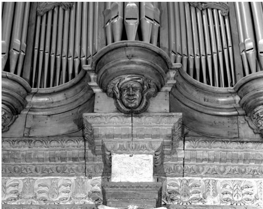
Culot central du positif, vue de face. 39, Dole place Nationale