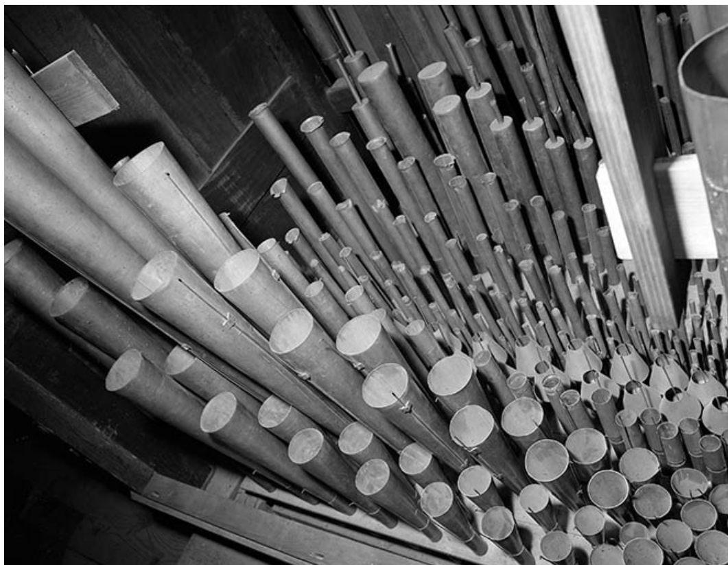
Tuyaux de jeux d'anches du positif, vus en plongée de trois quarts droit. 39, Dole place Nationale