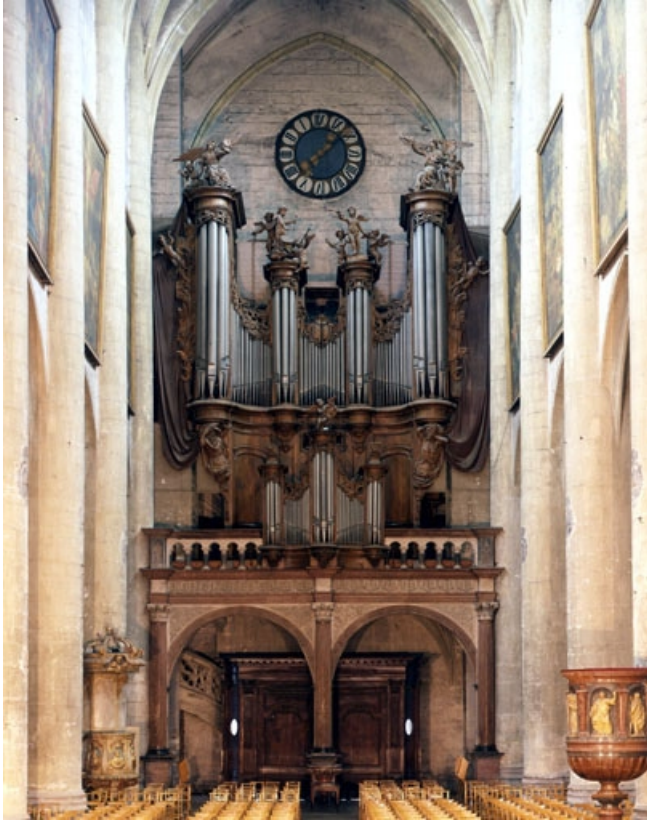
Grand orgue, vu de face.