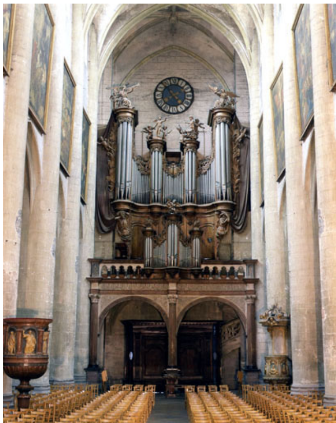
Grand orgue, vu de face en contre-plongée.