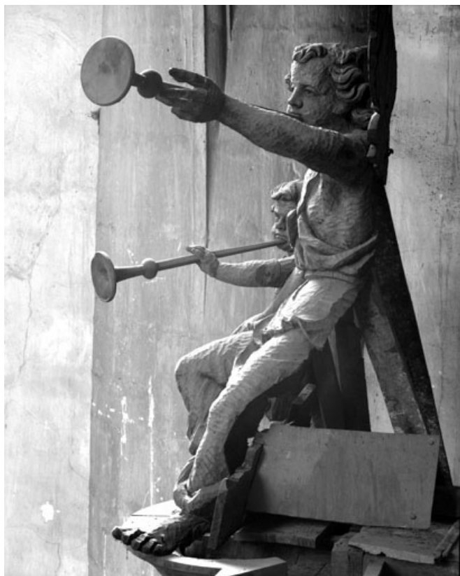
Détail des angelots de la grande tourelle de gauche. 39, Dole place Nationale