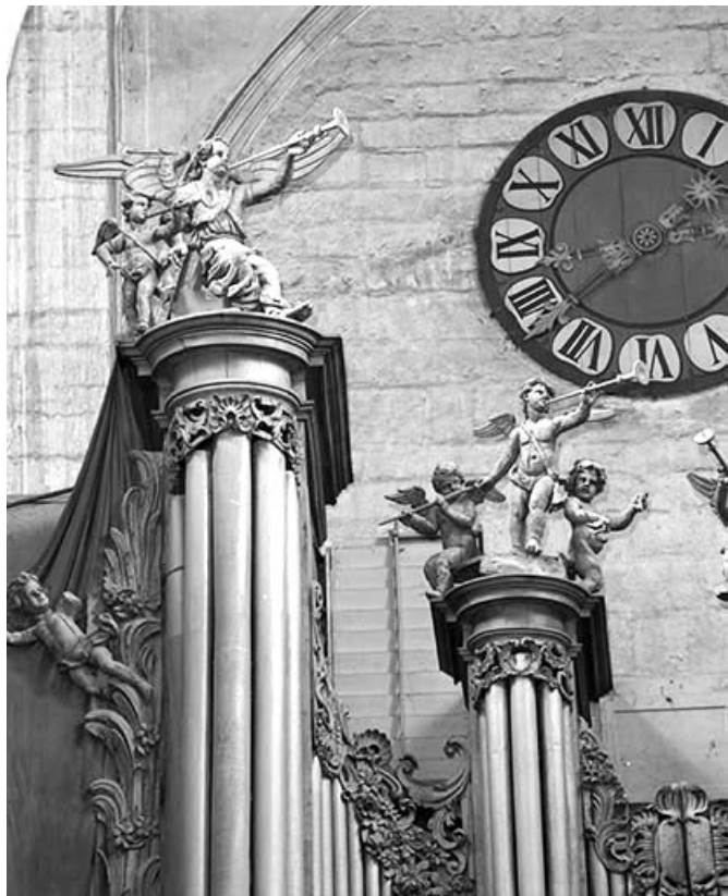
Partie supérieure de la tourelle gauche.