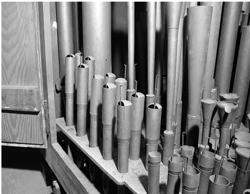
Tuyauterie de voix humaine de l'écho, vue de trois quarts droit.