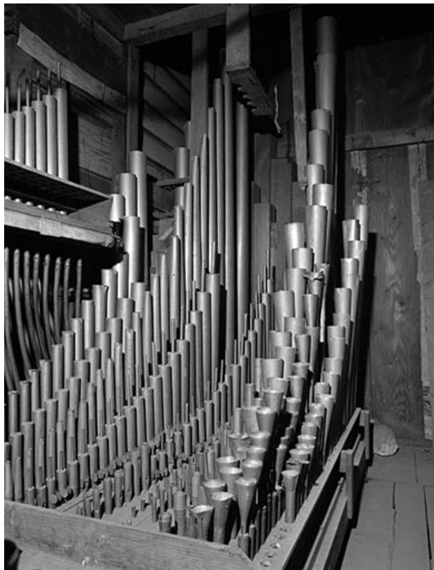
Tuyauterie du récit, vue de trois quarts droit.