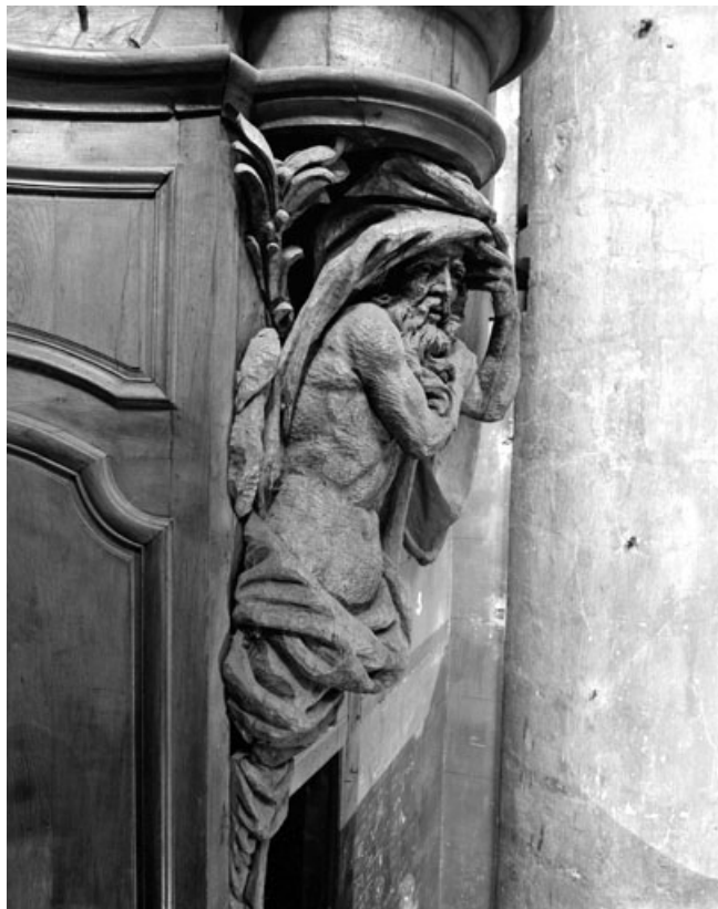
Détail de l'atlante droit du buffet.