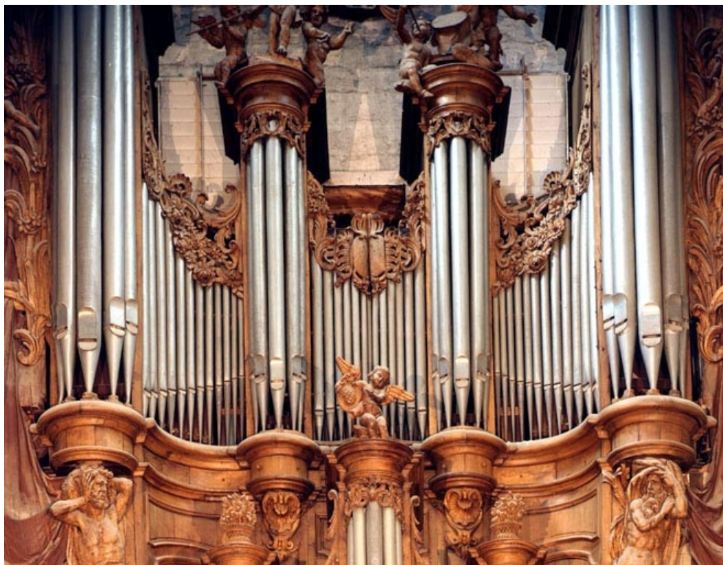
Etage de tuyauterie du grand orgue, vu de face.