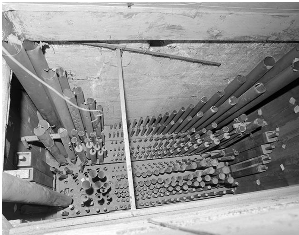
Tuyauterie de l'écho, vue en plongée. 39, Dole place Nationale