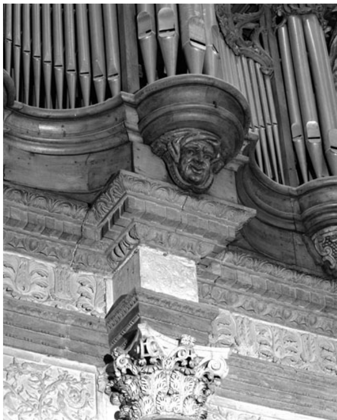
Culot central du positif, vue de trois quarts.