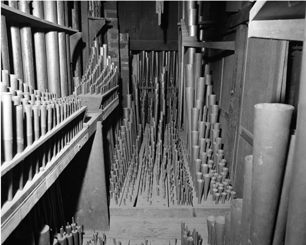
Tuyauterie du grand orgue, vue de face. 39, Dole place Nationale