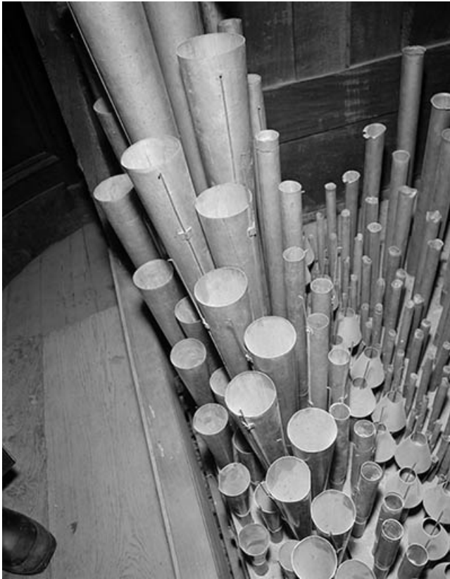
Jeux d'anches du positif, vu de face en plongée.