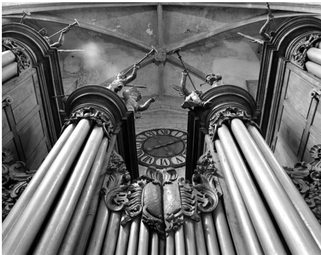
Détail de la partie haute.