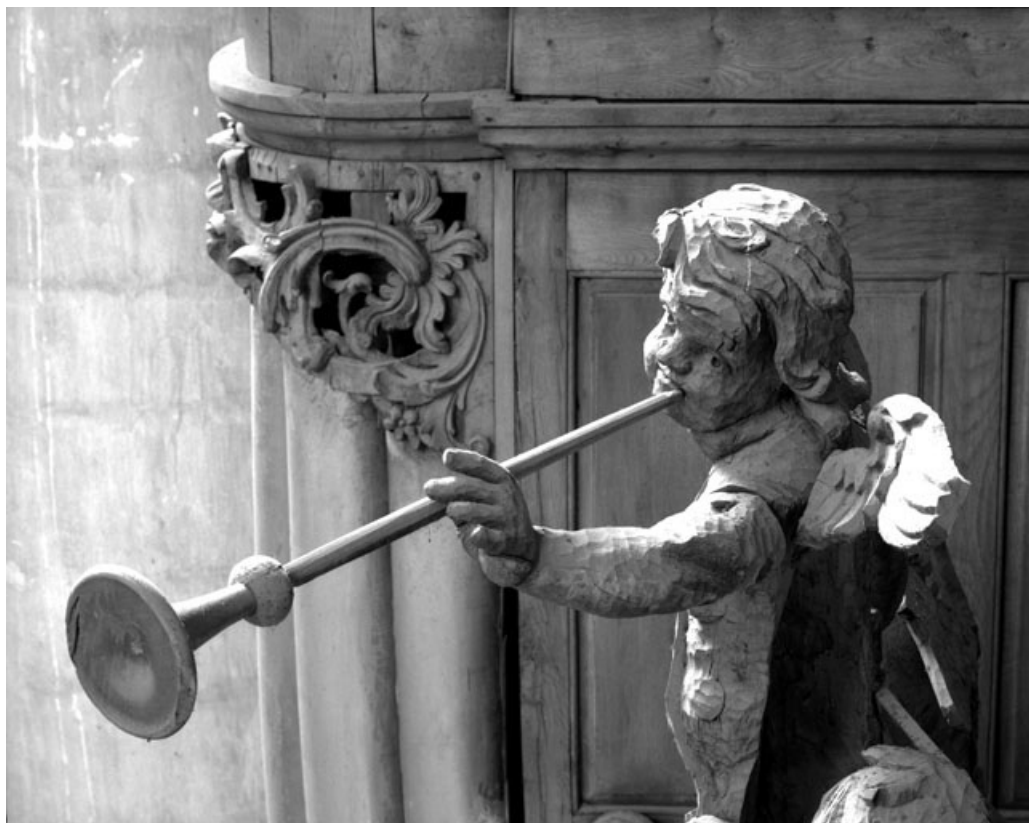
Détail des angelots de la petite tourelle de gauche. 39, Dole place Nationale