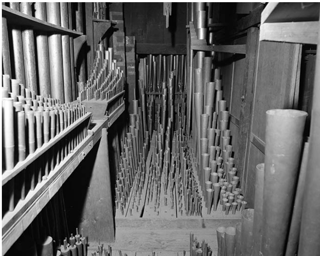
Tuyauterie du grand orgue, vue de face. 39, Dole place Nationale