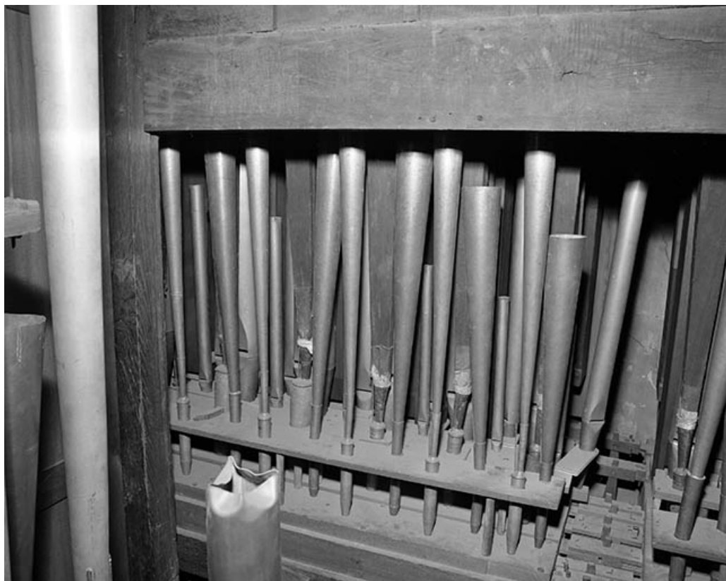
Pieds de tuyaux de pédale, vus de trois quarts droit.