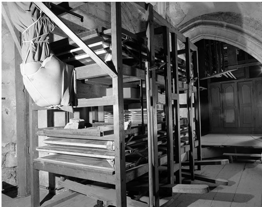
Soufflerie, vue de trois quarts gauche. 39, Dole place Nationale