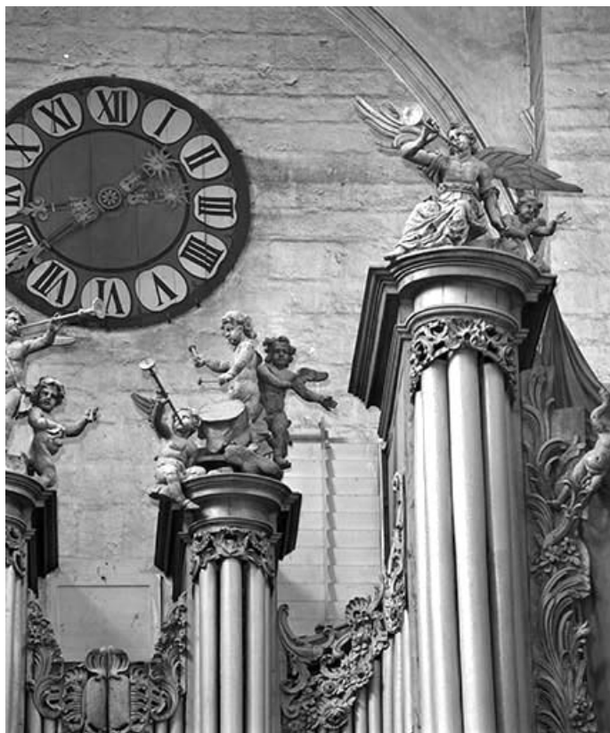
Partie supérieure de la tourelle droite.