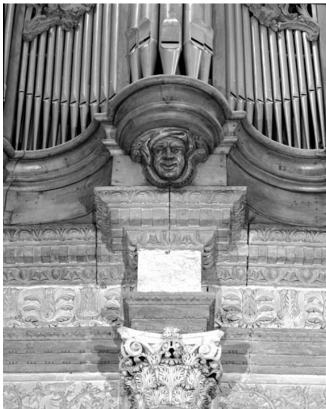
Culot central du positif, vue de face.