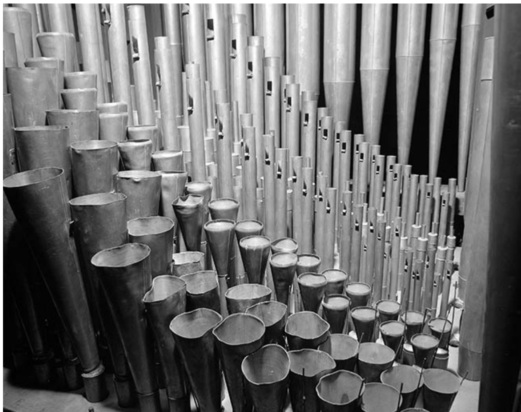
Tuyauterie, vue de trois quarts droit. 39, Chaussin