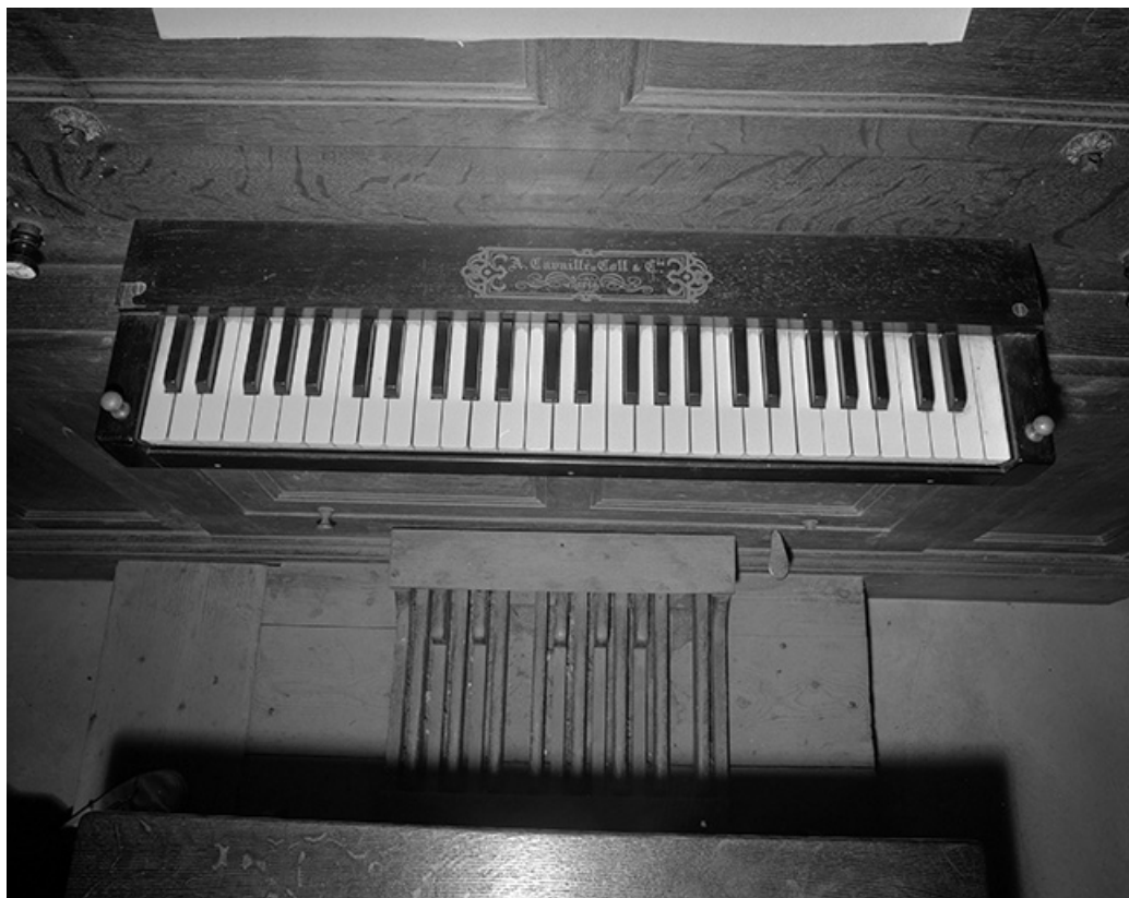
Console, vue en plongée.