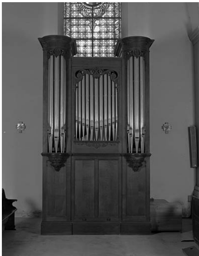
Orgue de chœur, vu de face.