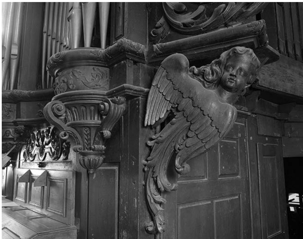
Détail du buffet, culots et chérubin, aile, vus de trois quarts droit.