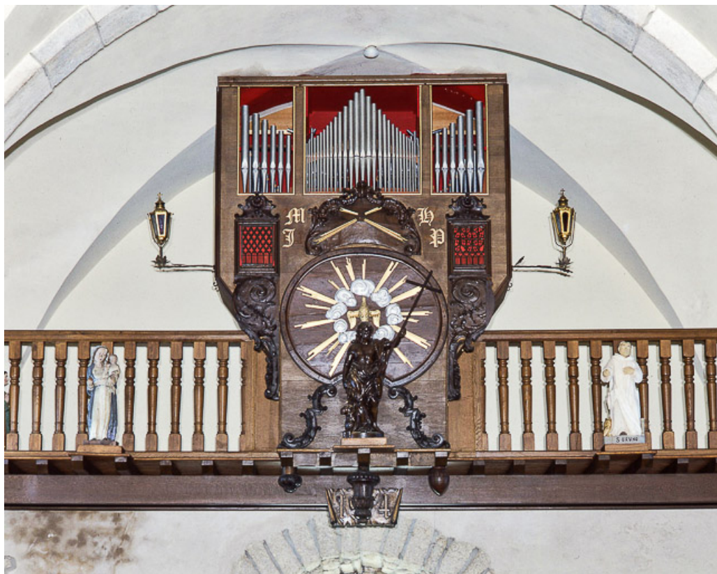
Détail du buffet.