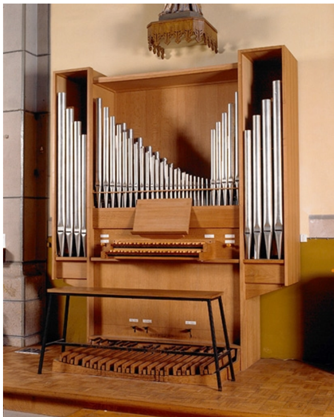
Vue d'ensemble, de trois quarts droite.