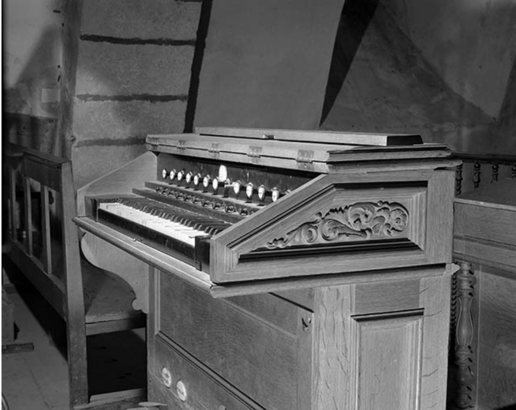
Console retournée, vue de trois quarts droit. 39, Arinthod