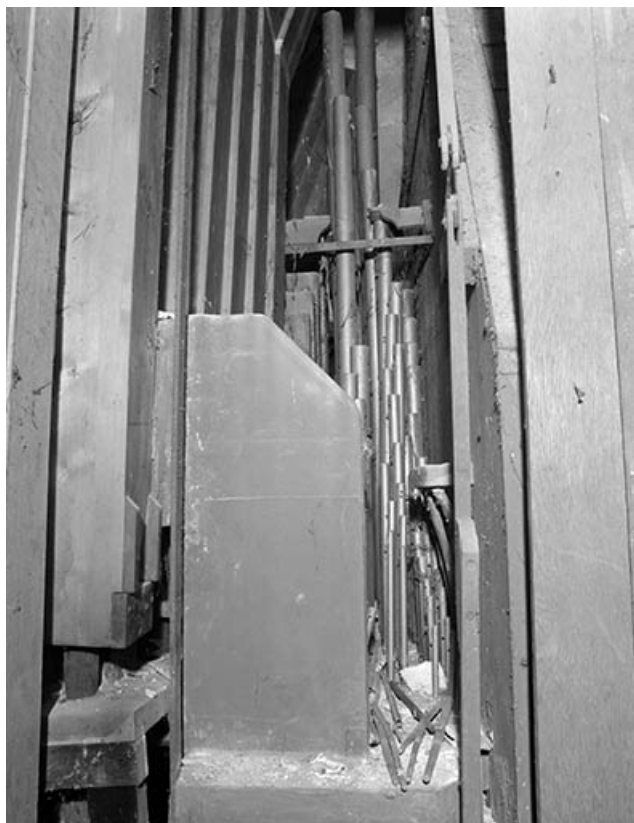
Tuyauterie, vue de face.