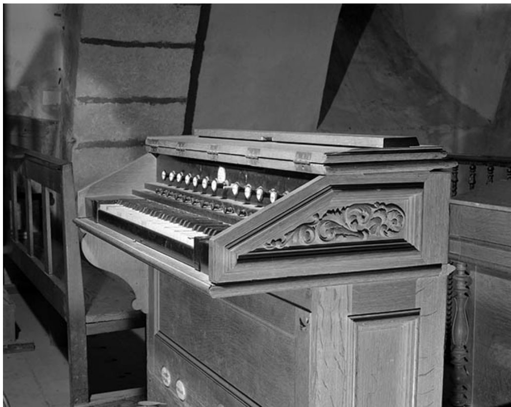
Console retournée, vue de trois quarts droit. 39, Arinthod