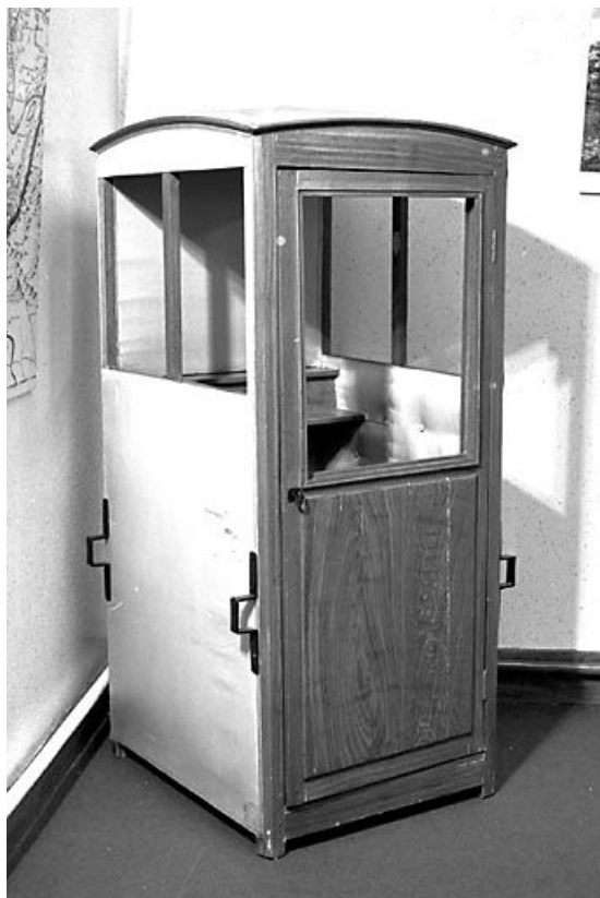
Vue de trois quarts.

39, Saint-Claude, 2 rue de la Sous-préfecture