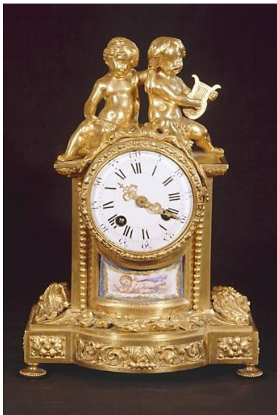
Vue de face.

39, Saint-Claude, 2 rue de la Sous-préfecture