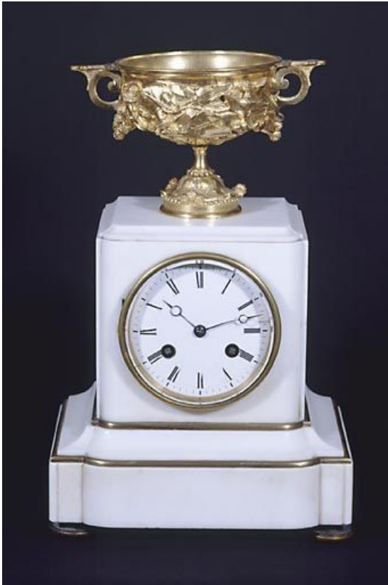
Vue de face.

39, Saint-Claude, 2 rue de la Sous-préfecture