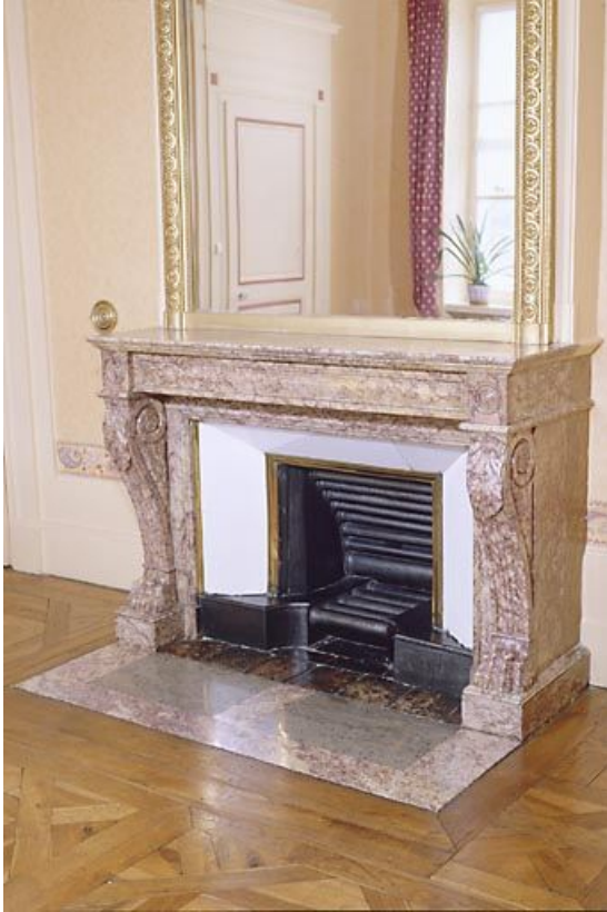
Vue de trois quarts.

39, Saint-Claude, 2 rue de la Sous-préfecture