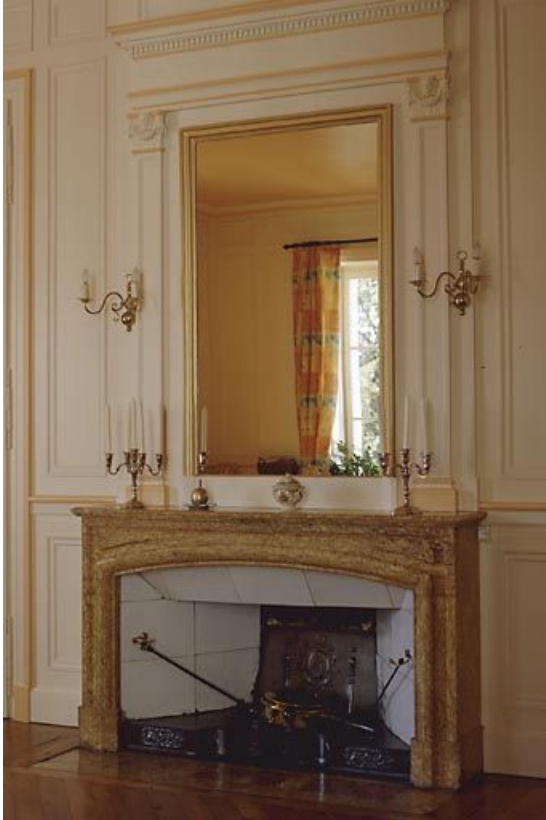
Vue générale de trois quarts.

39, Saint-Claude, 2 rue de la Sous-préfecture