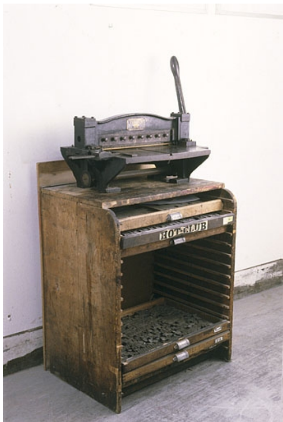
Vue d'ensemble de la machine, posée sur un rang.