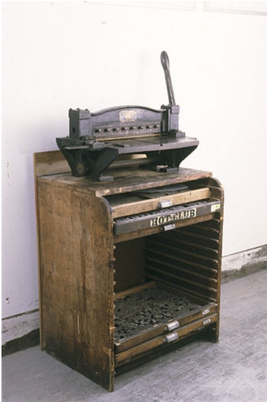
Vue d'ensemble de la machine, posée sur un rang.