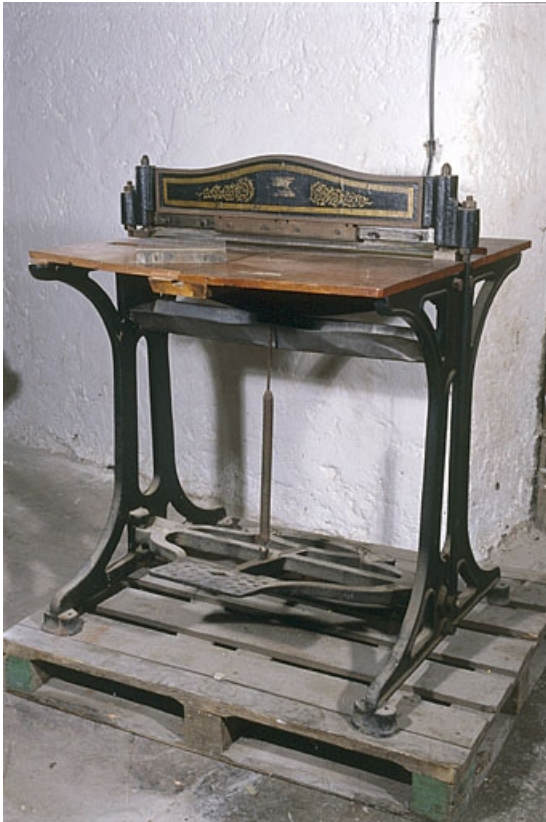
Vue d'ensemble. L'un des quatre éléments garnis d'aiguilles en acier est posé sur le plateau.