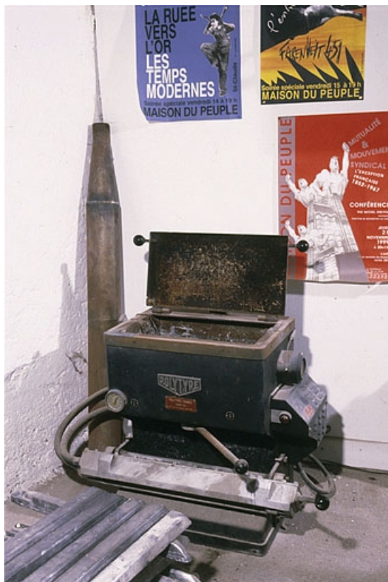
Vue d'ensemble, couvercle ouvert. La cheminée démontée est appuyée à l'angle des murs. 39, Saint-Claude, 12 rue de la Poyat