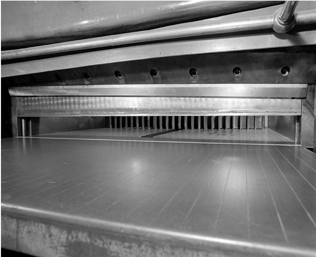
Table, lame et presse-papiers.