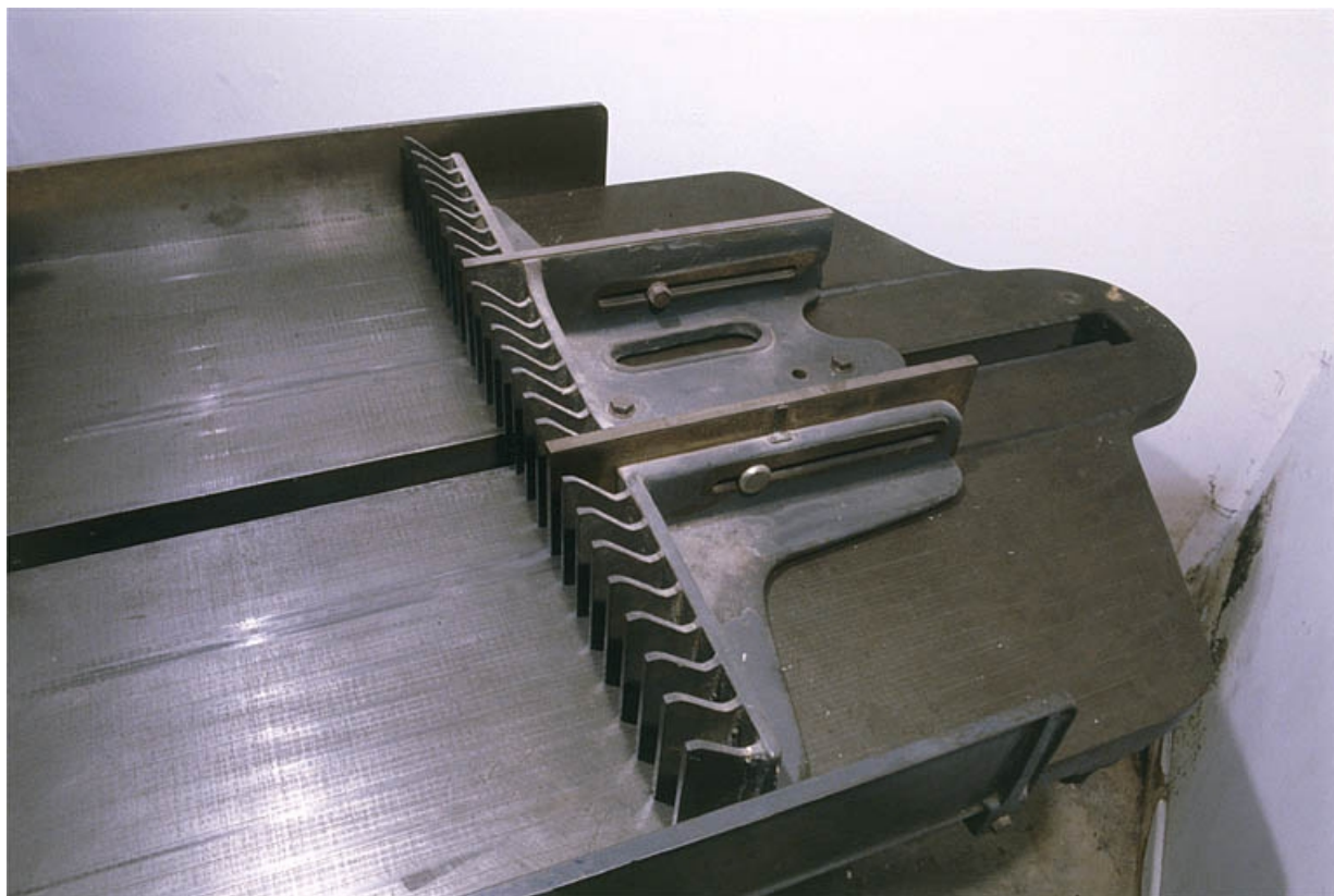
Table et équerre mobile.