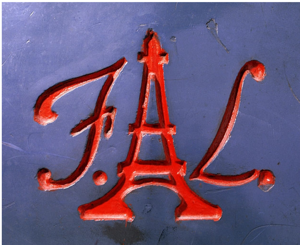
Logotype de la société FL.