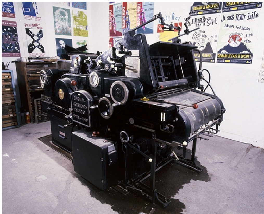
Vue d'ensemble de l'arrière de la machine.