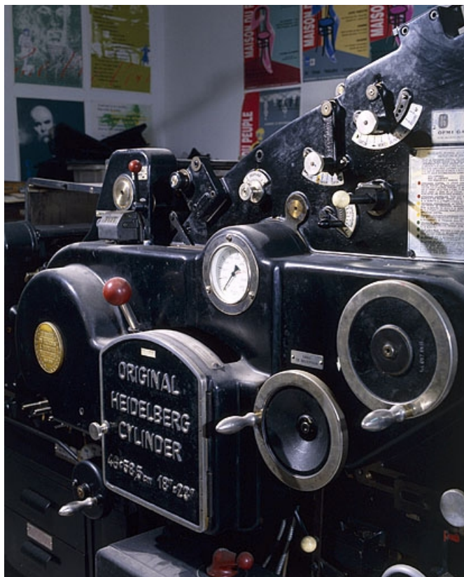
Détail de la partie centrale de la machine, du côté service.