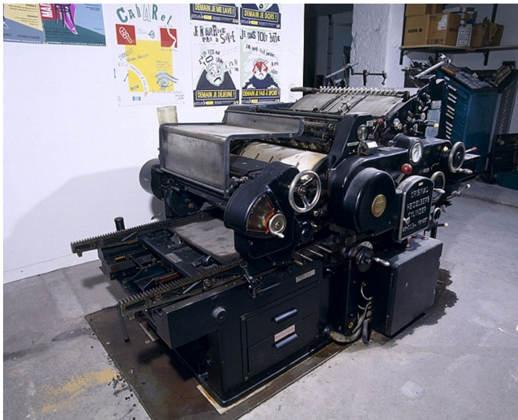
Vue d'ensemble, de trois quarts gauche.