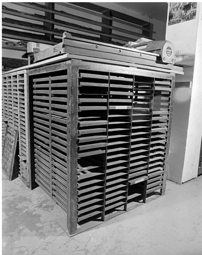
Premier meuble à galées, de trois quarts gauche. Une presse à épreuve Sofadi (non étudiée) est placée sur son plateau. 39, Saint-Claude, 12 rue de la Poyat