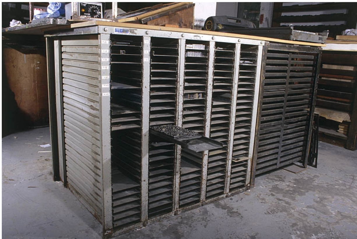
Deuxième meuble à galées, de trois quarts gauche. Une composition est placée sur la galée à demi tirée. 39, Saint-Claude, 12 rue de la Poyat