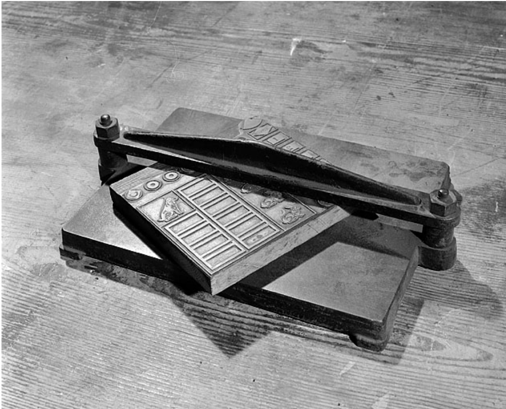
Vue d'ensemble : vérification de la hauteur typographique d'un cliché.