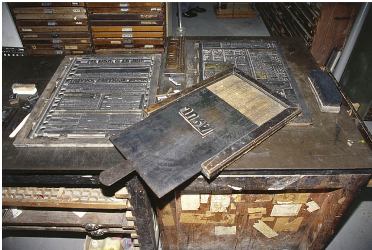
Galée en acier, posée sur un marbre.