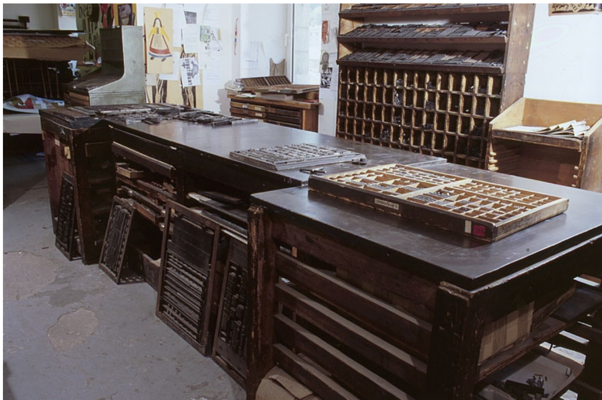
Vue d'ensemble. Casse parisienne au premier plan sur le marbre, forme d'imprimeur avec sa clé de serrage au second plan.