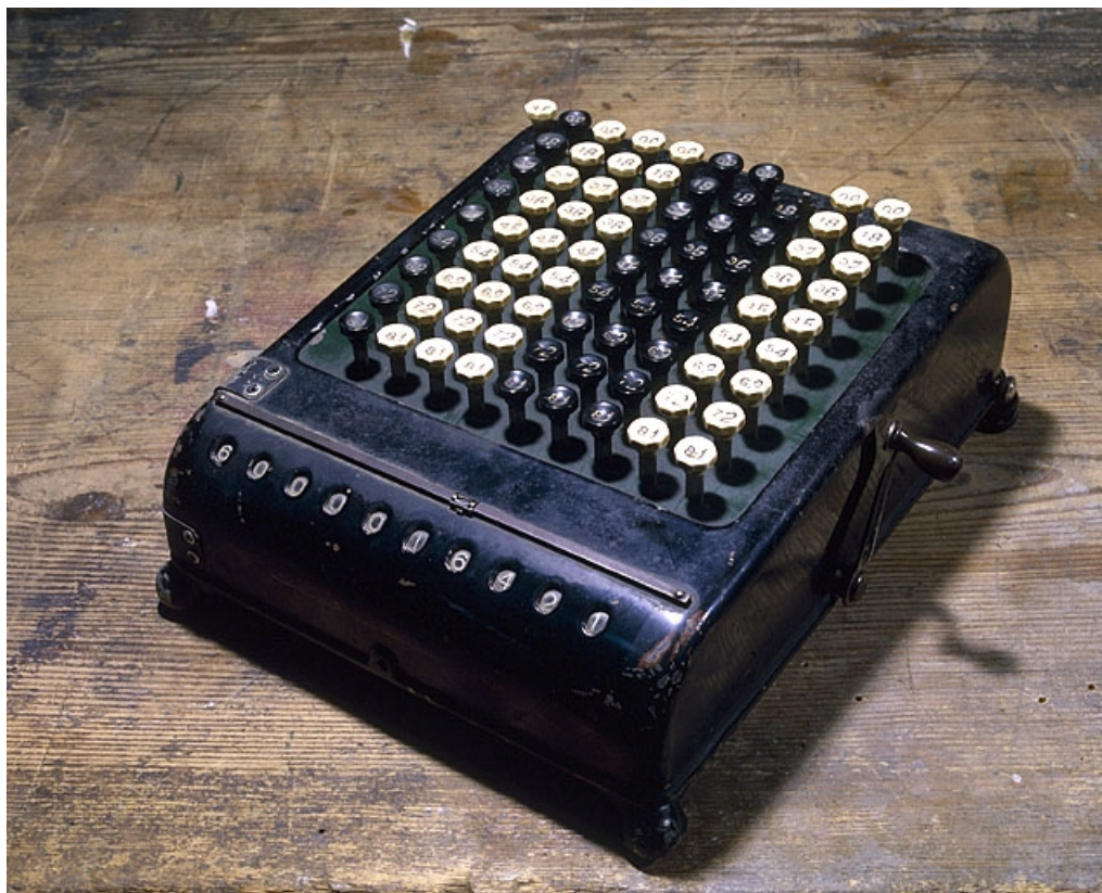
Vue d'ensemble, capot enlevé.