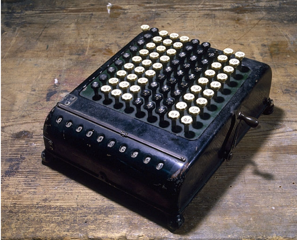
Vue d'ensemble, capot enlevé.