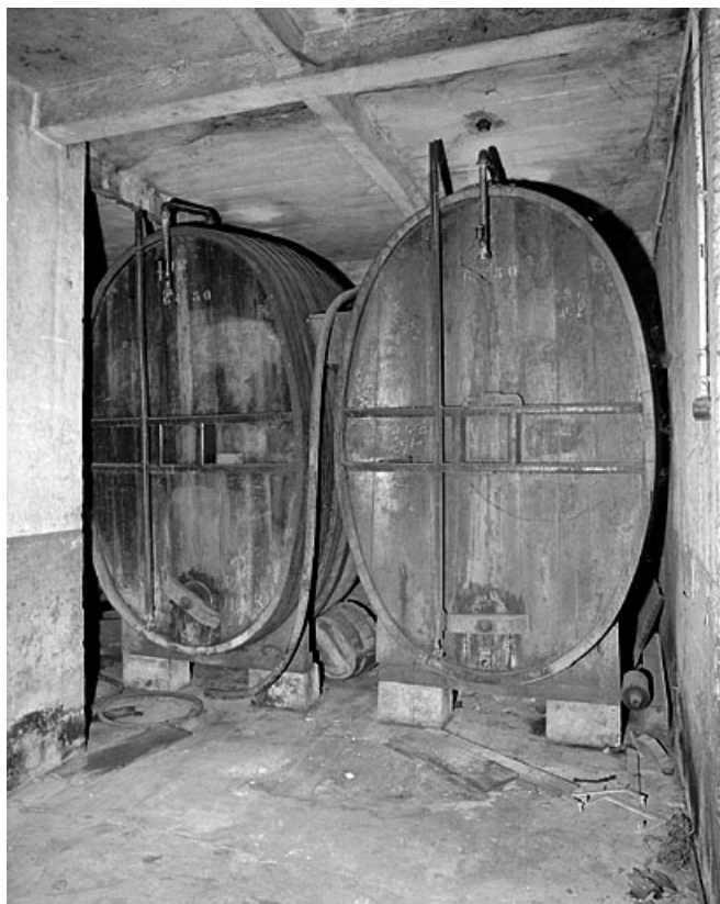
Foudres de section ovale.