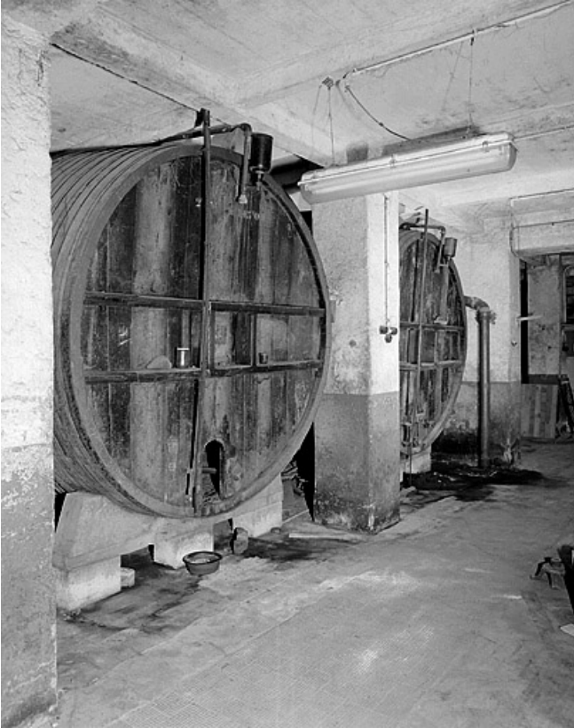
Foudres de section cylindrique.