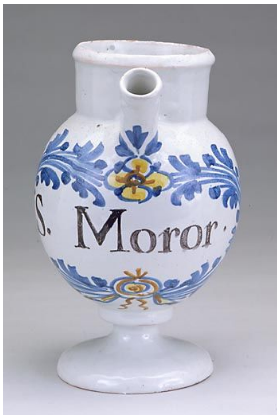
Une chevrette vue de face.

39, Saint-Claude, 2 montée de l' Hôpital