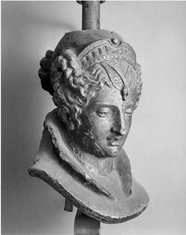
Figure de femme (reine de la Renaissance ?), vue de trois quarts. 39, Saint-Claude, 19 rue Carnot