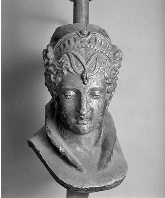
Figure de femme (reine de la Renaissance ?).