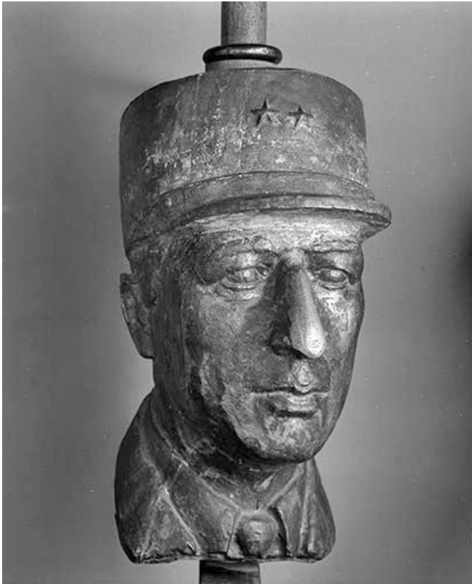
Charles de Gaulle.