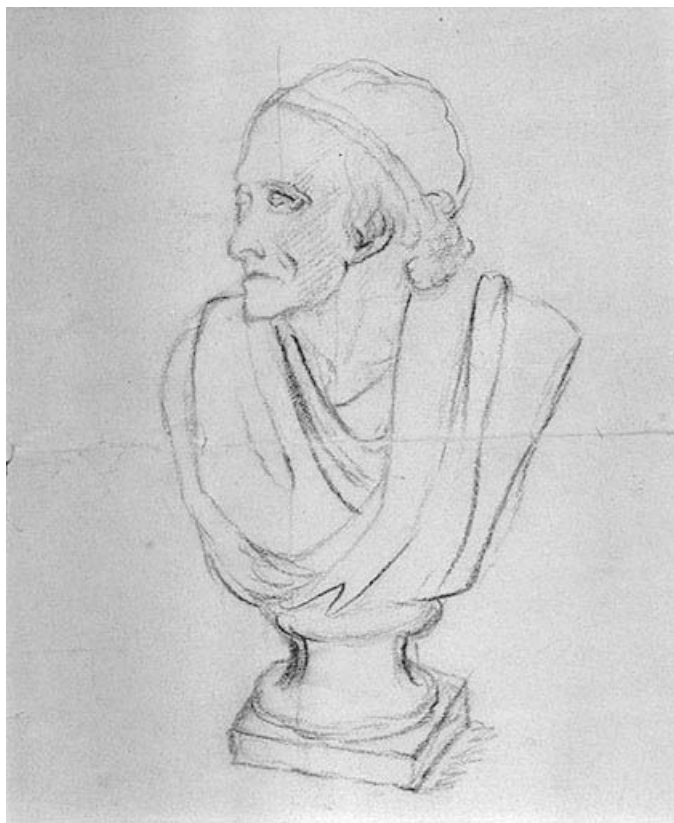
Buste de Voltaire, d'après une sculpture de Jean-Antoine Houdon.