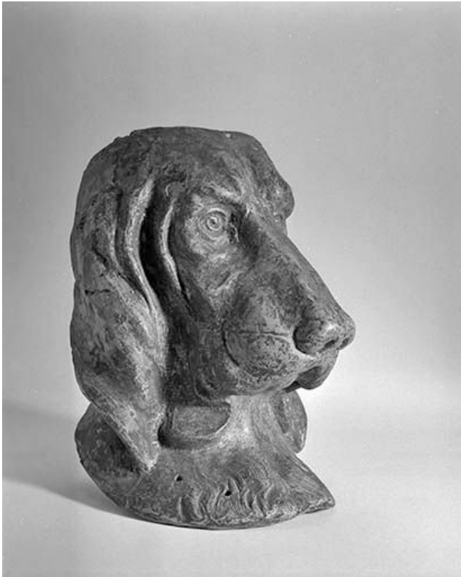
Tête de chien, vue de trois quarts.