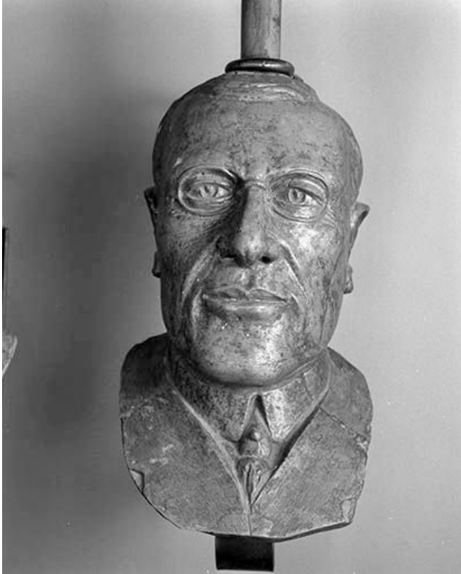
Thomas Woodrow Wilson.