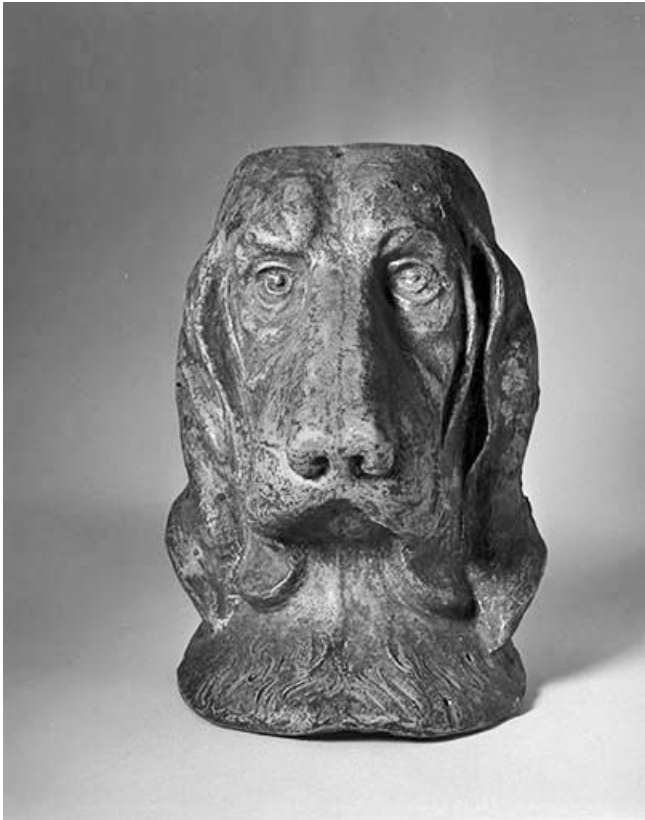
Tête de chien.