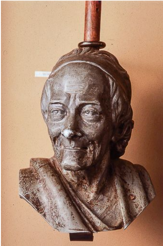
Voltaire, d'après une sculpture de Jean-Antoine Houdon. 39, Saint-Claude, 19 rue Carnot