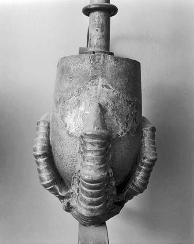
Patte d'aigle tenant le fourneau d'une pipe.