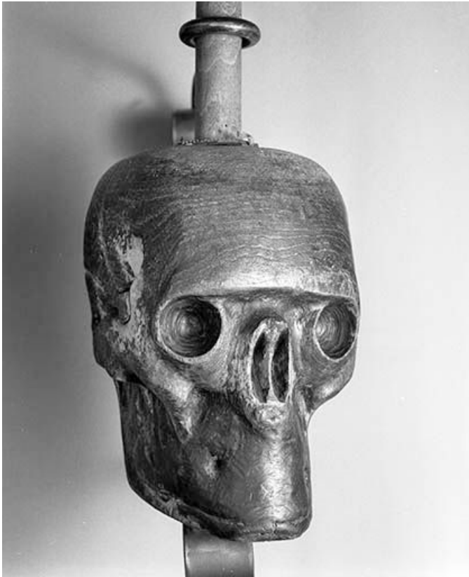
Crâne (tête de mort).