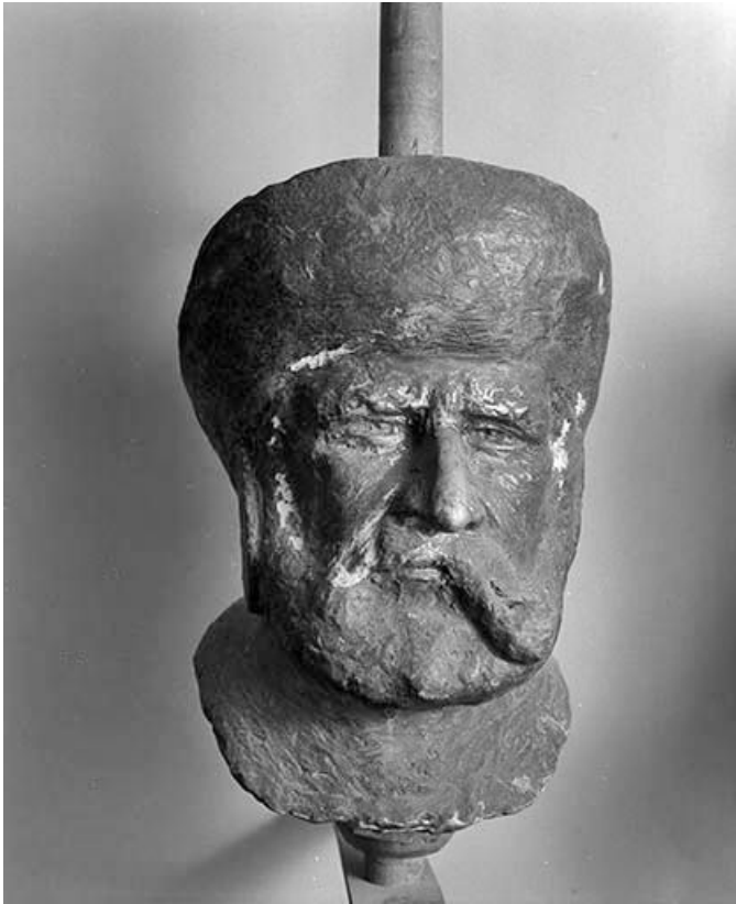
Marin pêcheur (auparavant Victor Hugo ?).