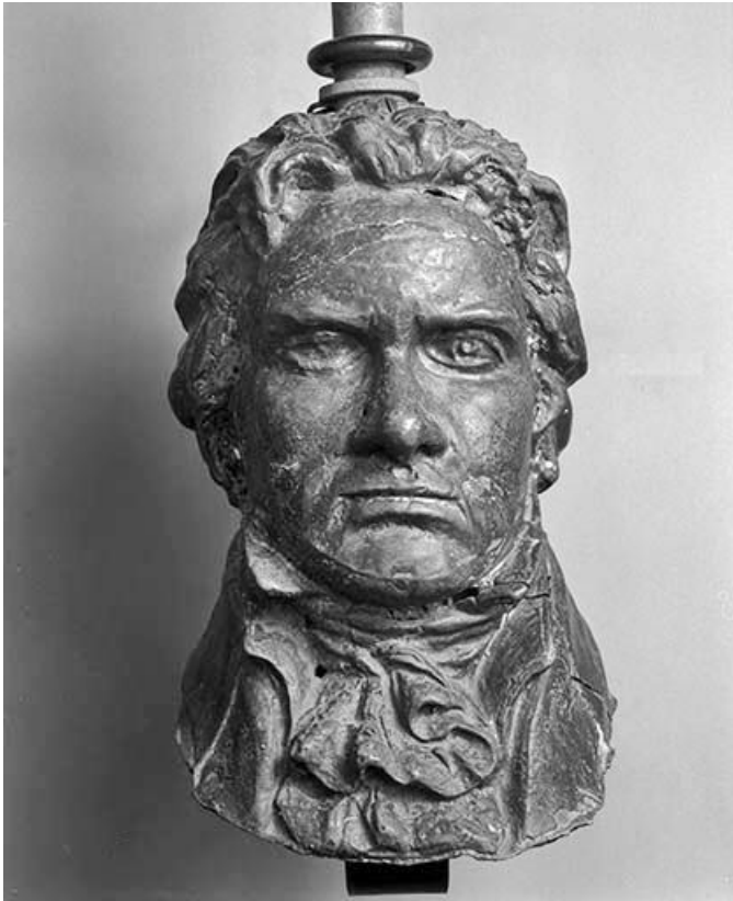
Ludwig Van Beethoven jeune.