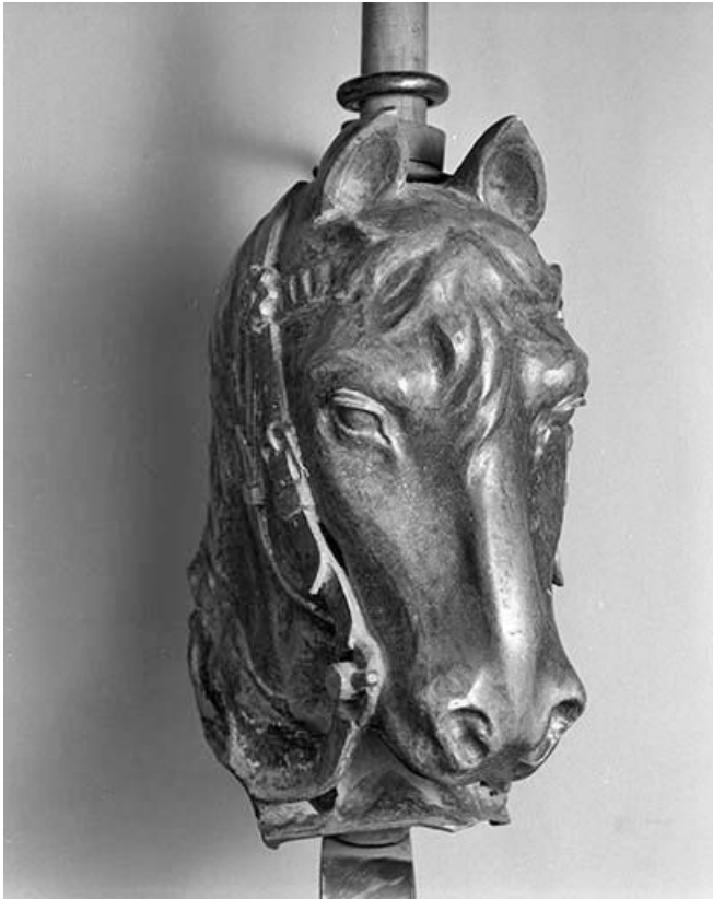
Tête de cheval.