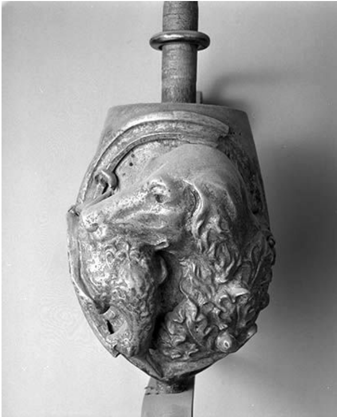
Chien de chasse tenant un oiseau dans la gueule.