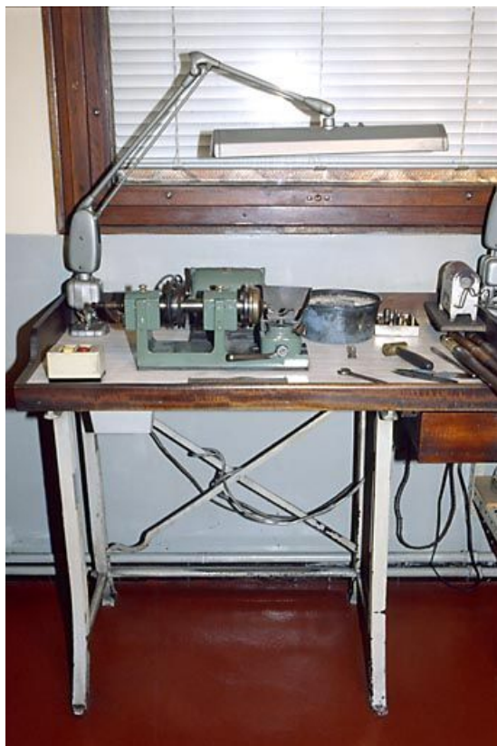
Vue d'ensemble d'une machine à débruter et de son four à résistance.