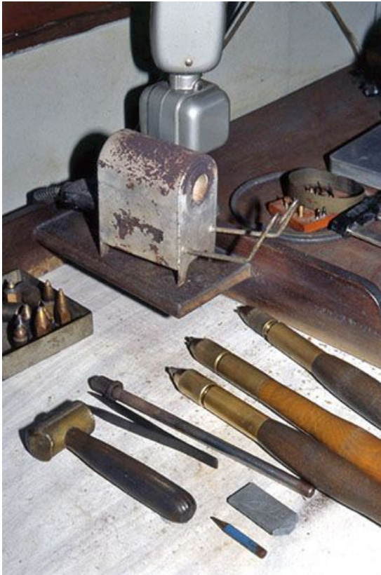
Four à résistance Portius. De gauche à droite, marteau pour désaxer la poupée fixe du tour, pince pour tenir le diamant, bâtons destinés à porter le second diamant. En haut à gauche, mandrins pour la fixation du diamant sur le tour.