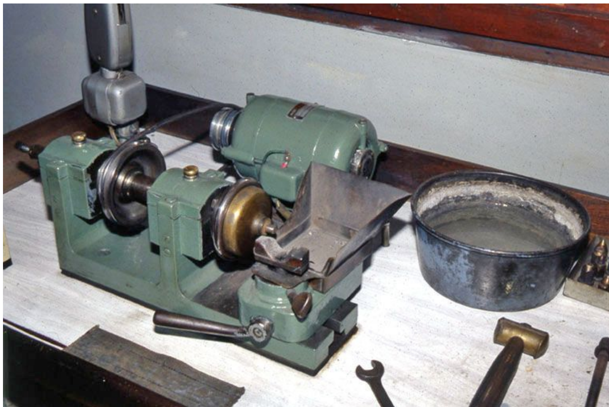
Machine à débruter.