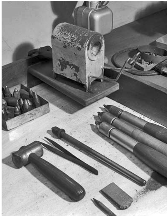
Four à résistance Portius. De gauche à droite, marteau pour désaxer la poupée fixe du tour, pince pour tenir le diamant, bâtons destinés à porter le second diamant. En haut à gauche, mandrins pour la fixation du diamant sur le tour.