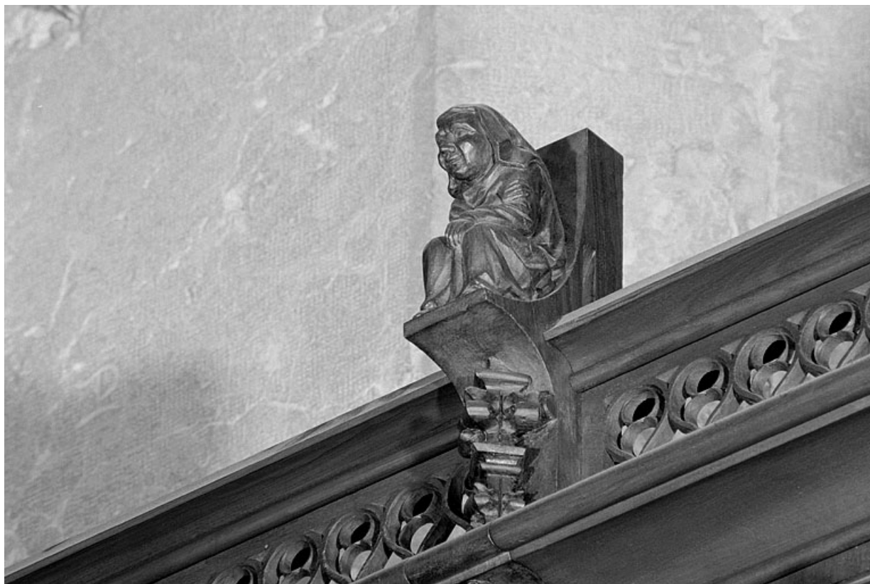
Vue de la onzième statuette : personnage assis.