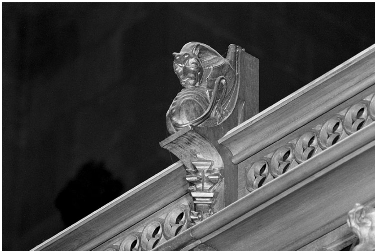
Vue de la sixième statuette : dragon.