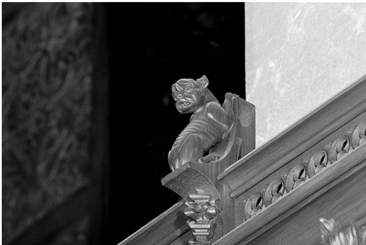
Vue de la douzième statuette.