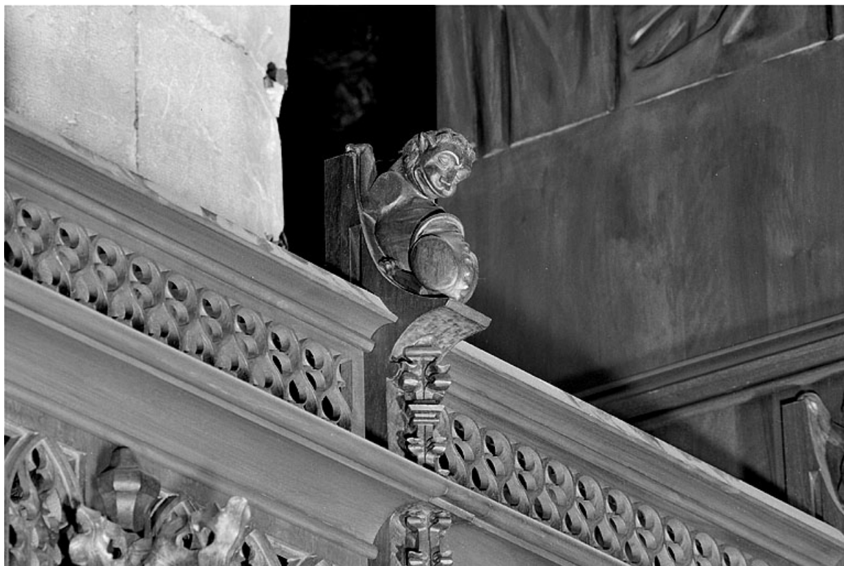
Vue de la deuxième statuette : lion.