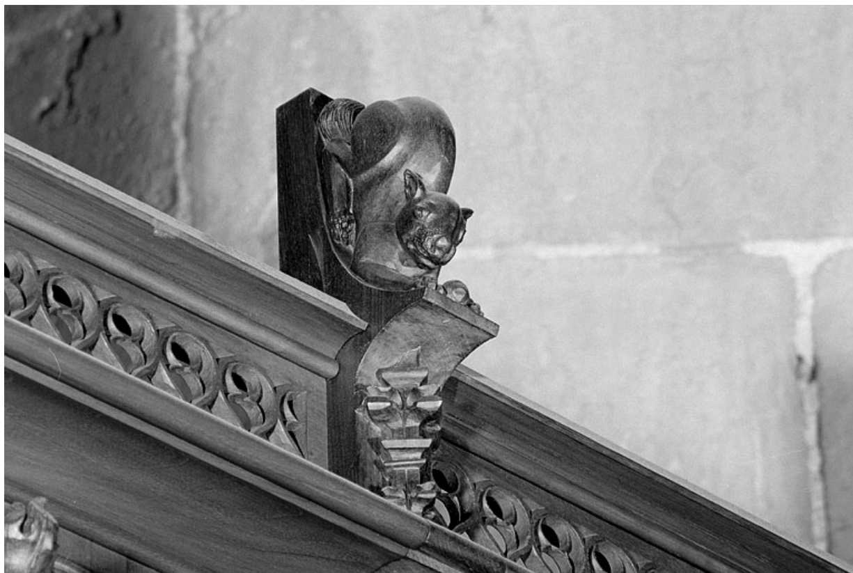
Vue de la cinquième statuette : animal.