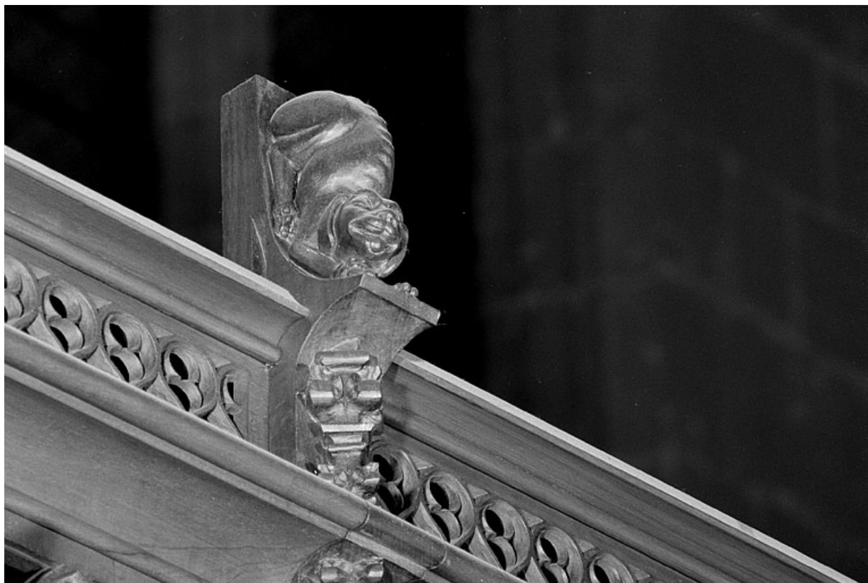
Vue de la dixième statuette : chien.