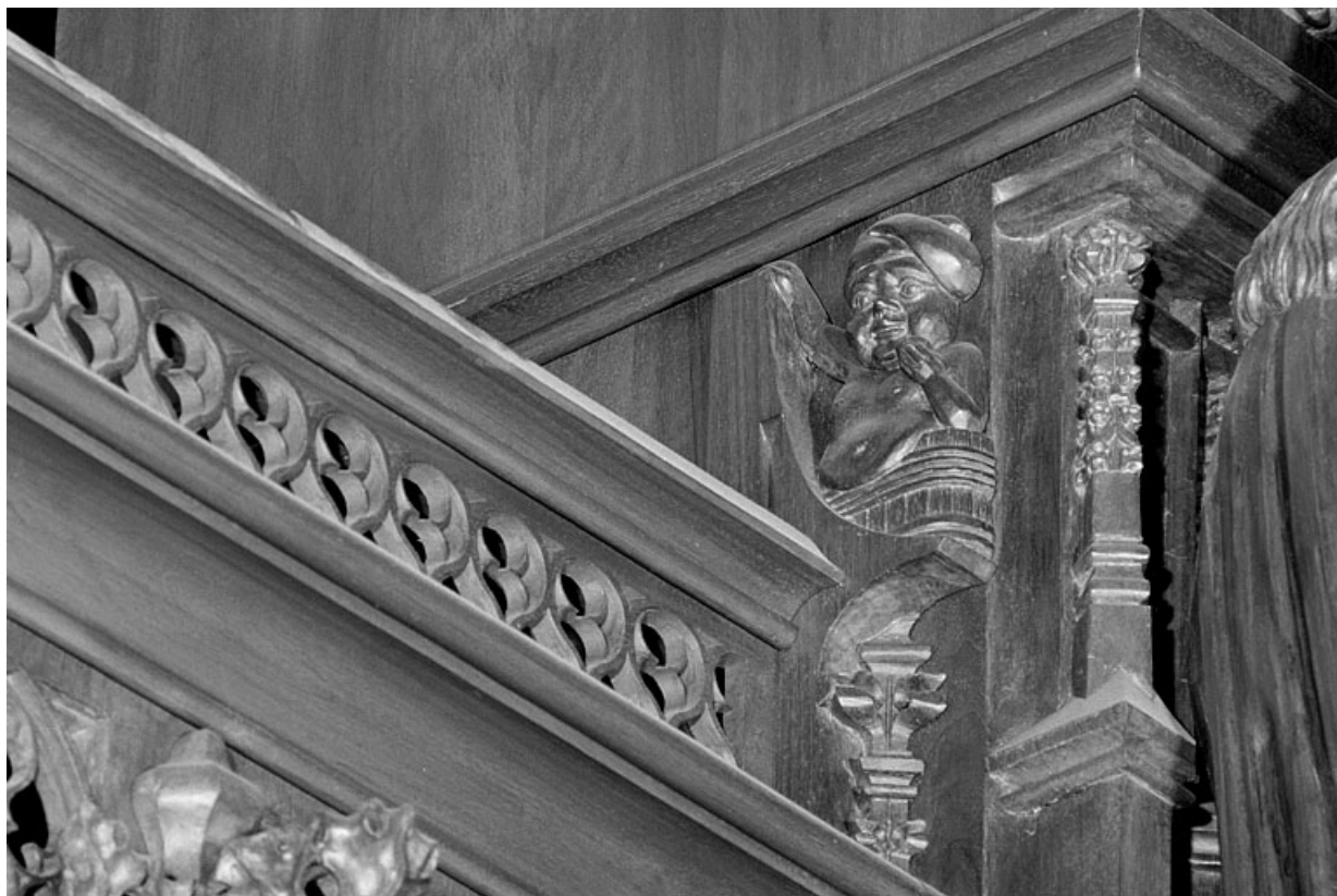
Vue de la première statuette : homme dans un baquet.