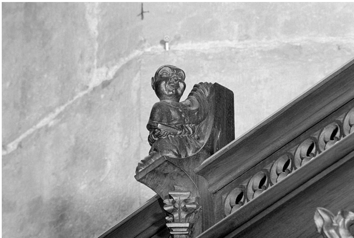
Vue de la vingt et unième statuette : personnage avec livre.