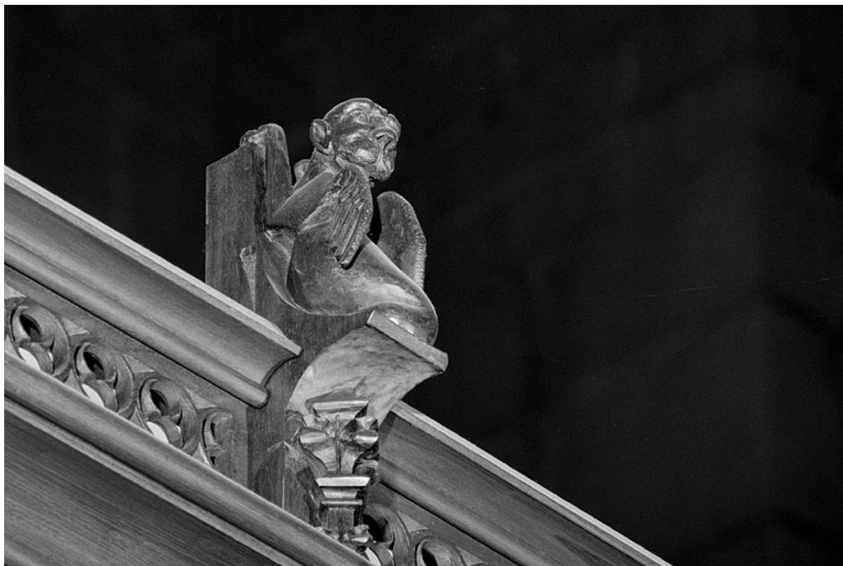
Vue de la dix-huitième statuette : quadrupède ailé.