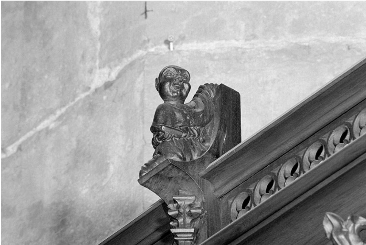
Vue de la vingt et unième statuette : personnage avec livre.