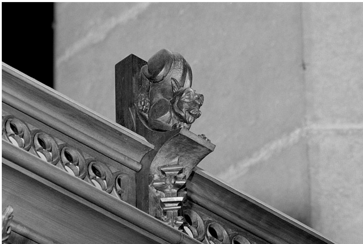
Vue de la seizième statuette : animal.