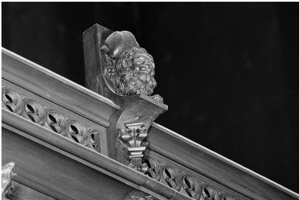
Vue de la huitième statuette : lion.