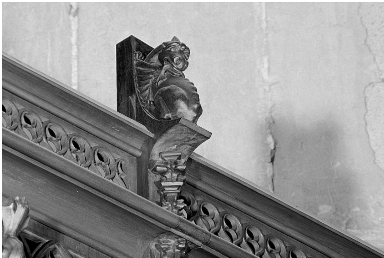
Vue de la quatrième statuette : dragon.