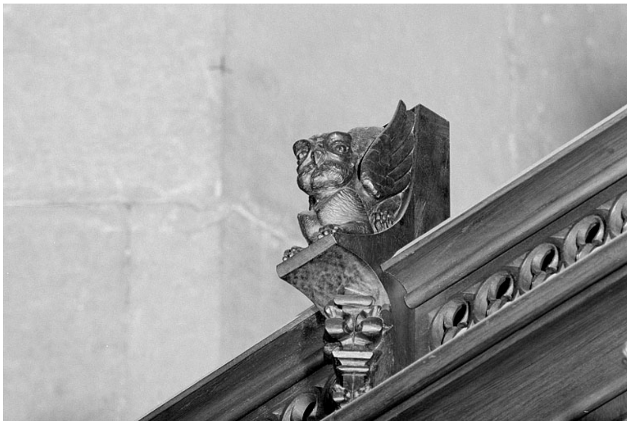
Vue de la dix-neuvième statuette : chouette.