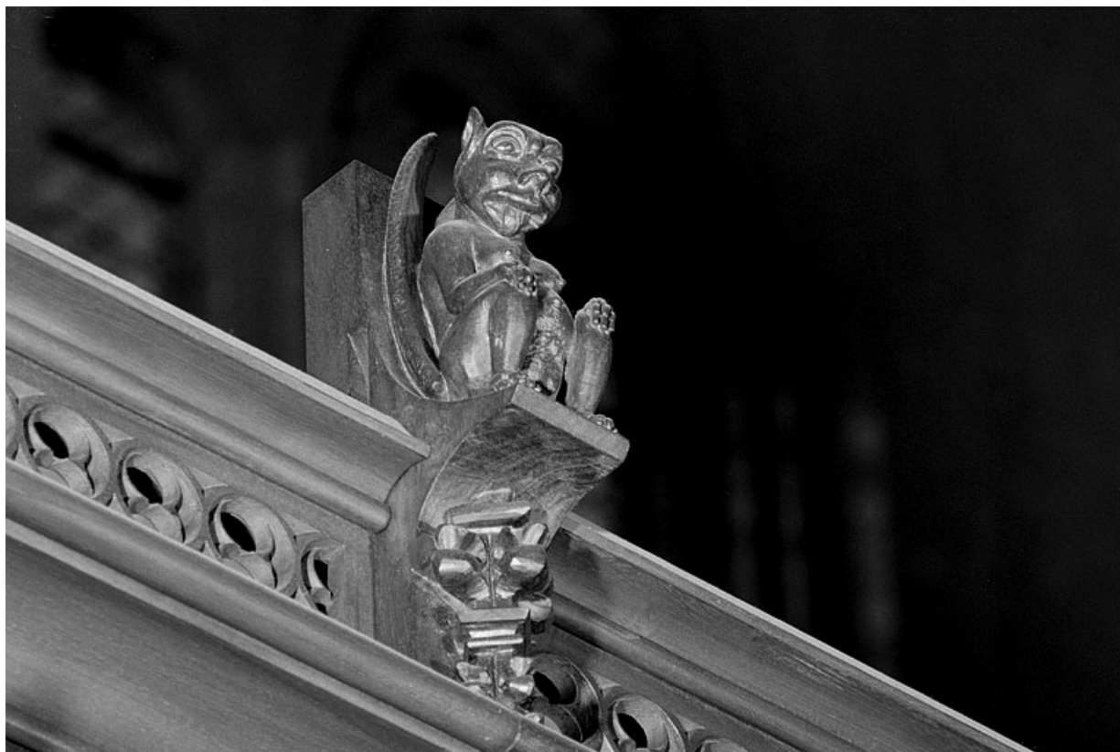
Vue de la vingtième statuette : animal ailé, assis.