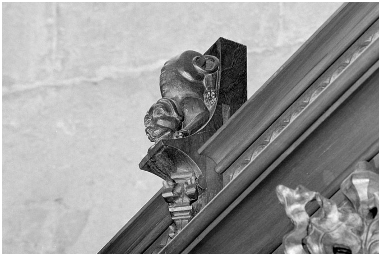
Vue de la neuvième statuette : chien, vu de trois quarts droit.