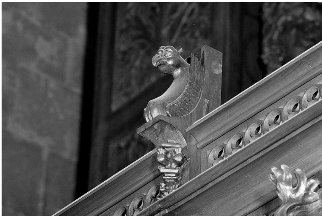
Vue de la treizième statuette : griffon ailé.