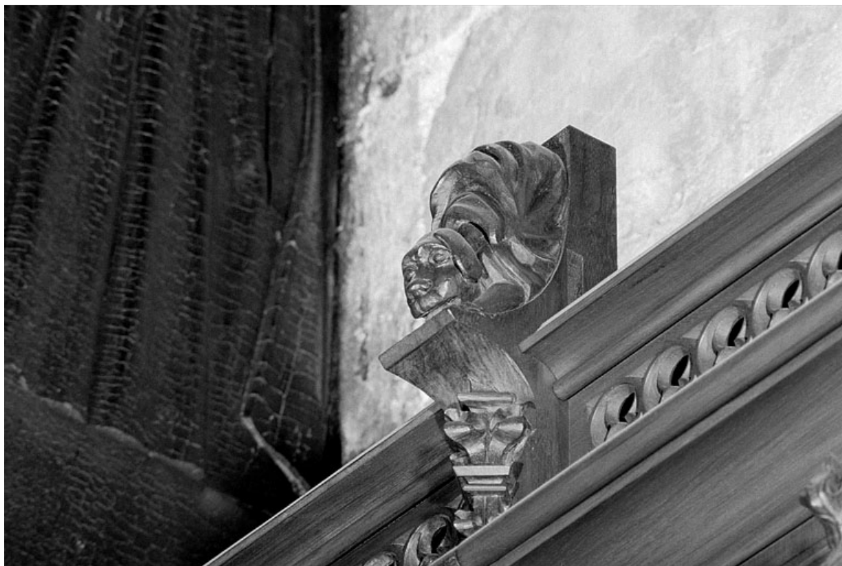
Vue de la vingt-deuxième statuette : chien vêtu d'une robe.