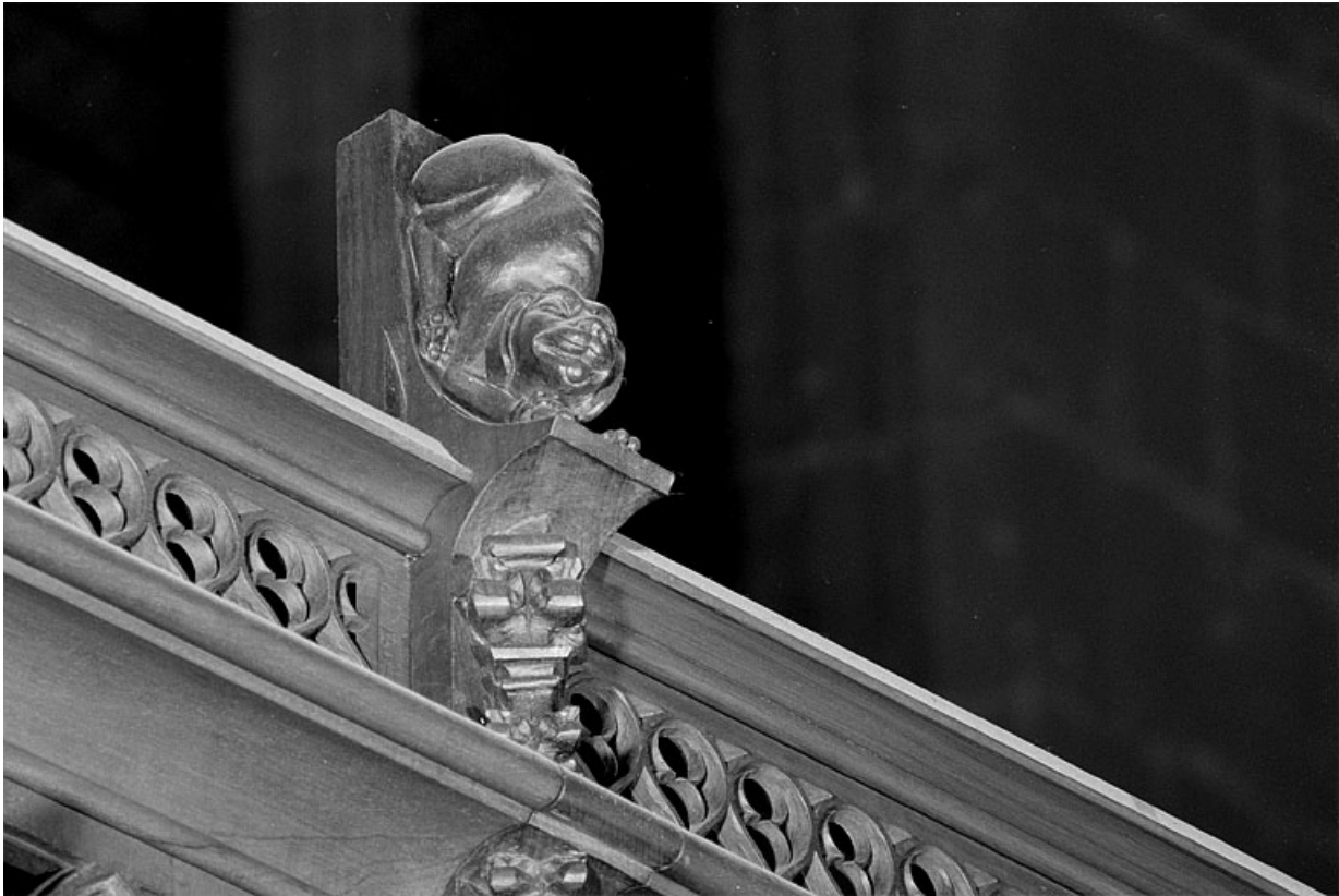
Vue de la dixième statuette : chien.