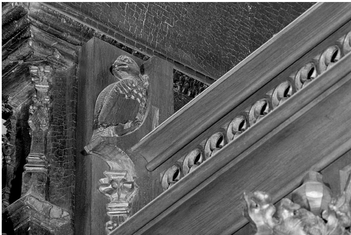
Vue de la vingt-troisième statuette : aigle.