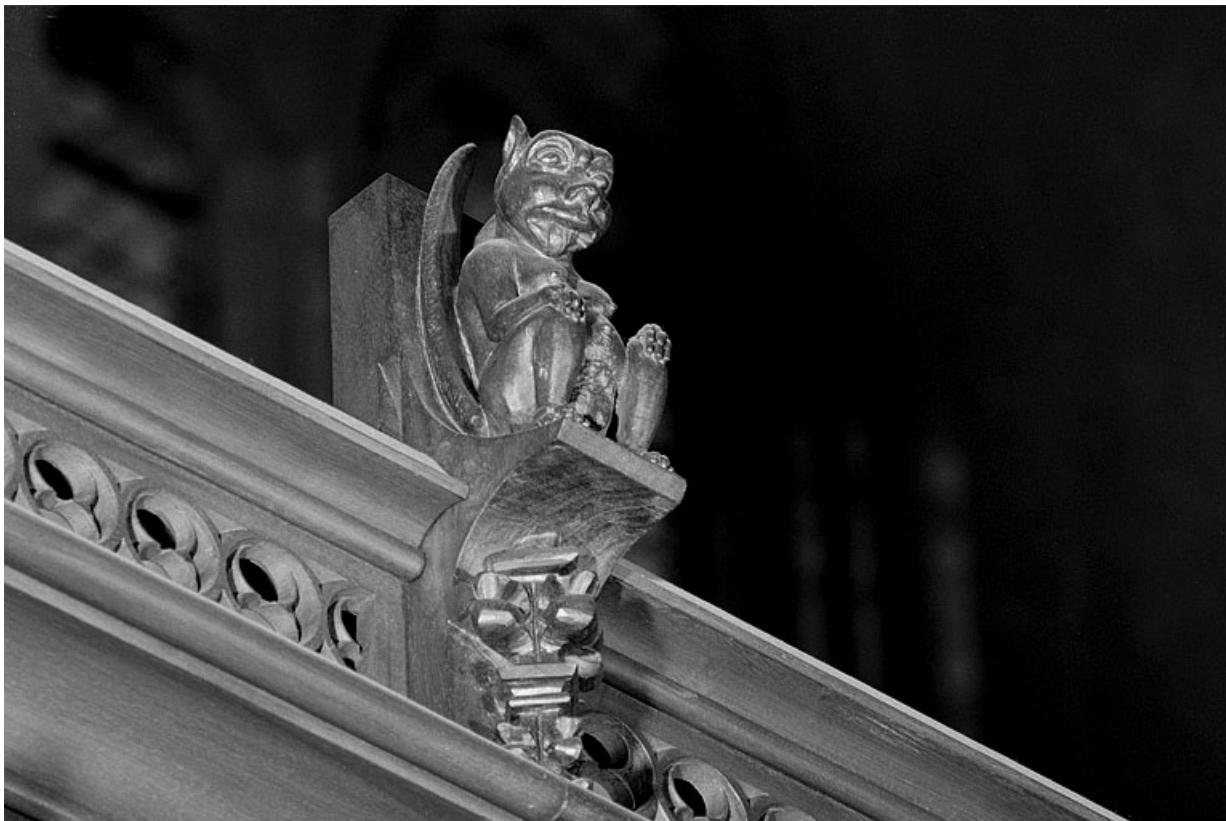
Vue de la vingtième statuette : animal ailé, assis.