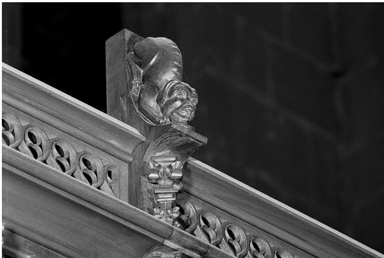
Vue de la neuvième statuette : chien, vu de trois quarts gauche.