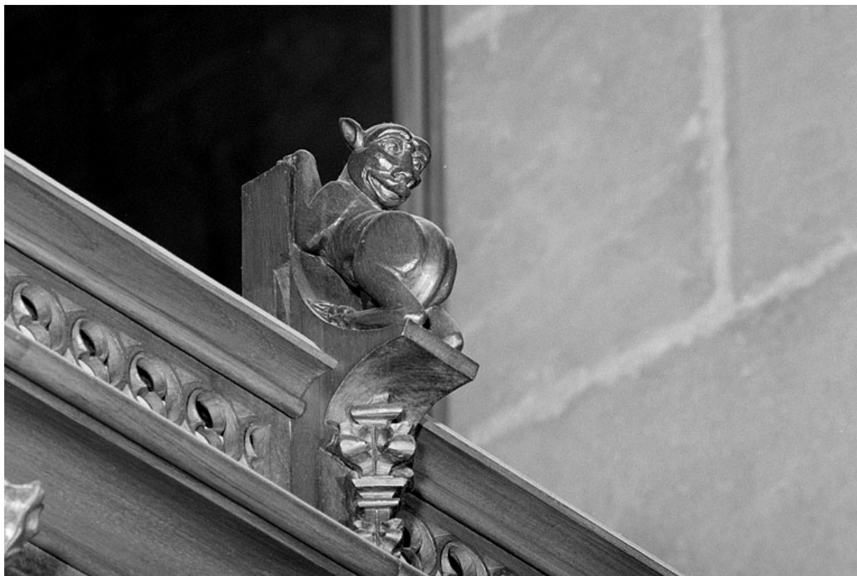
Vue de la dix-septième statuette : animal.