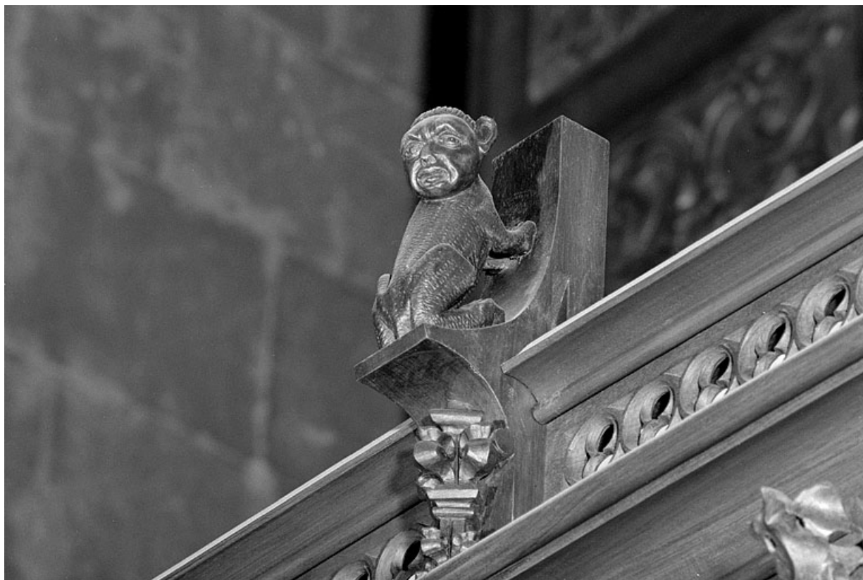
Vue de la quatorzième statuette : chien à tête humaine.