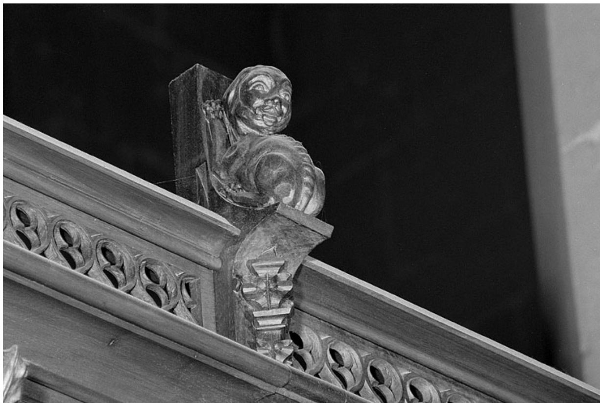
Vue de la septième statuette : chien.