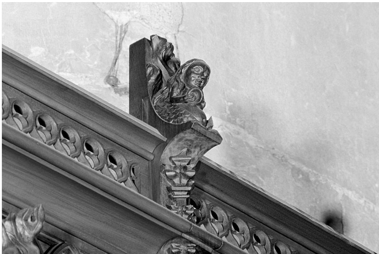
Vue de la troisième statuette : sirène.