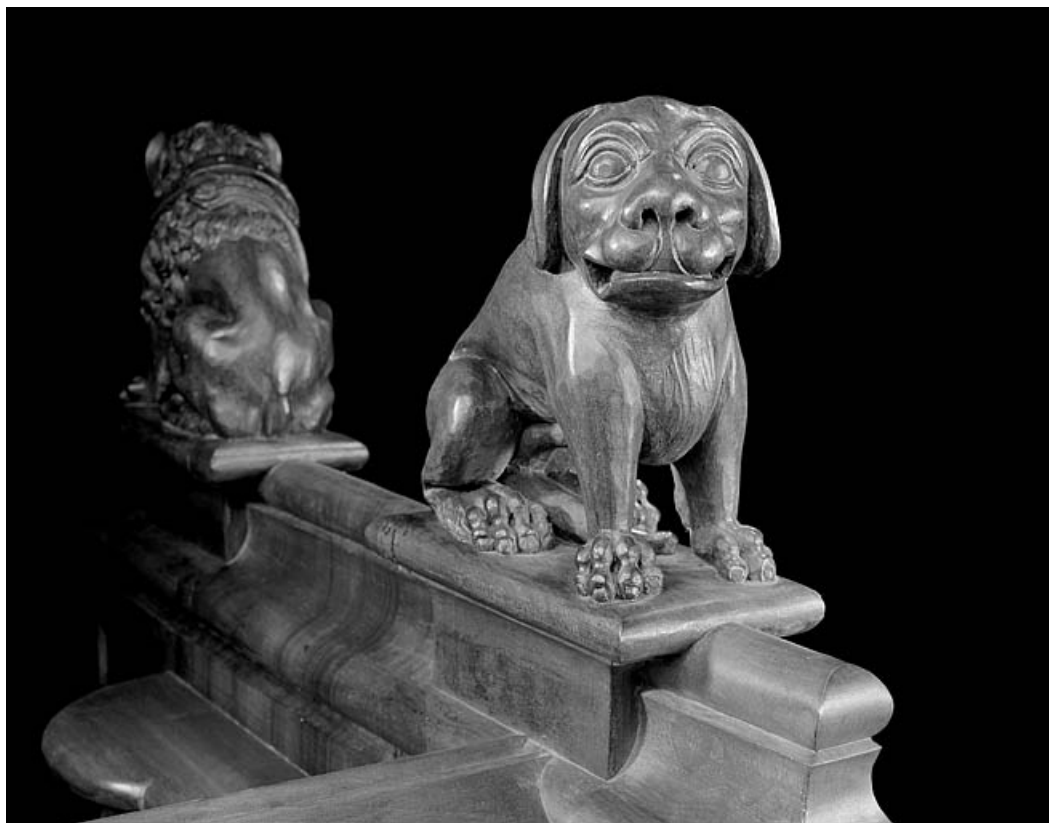
Statuette de la deuxième jouée basse : chien.