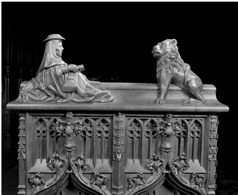
Statuettes de la première jouée basse : homme lisant et lion.