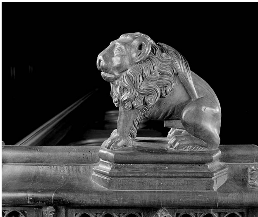
Statuette de la quatrième jouée basse : lion.