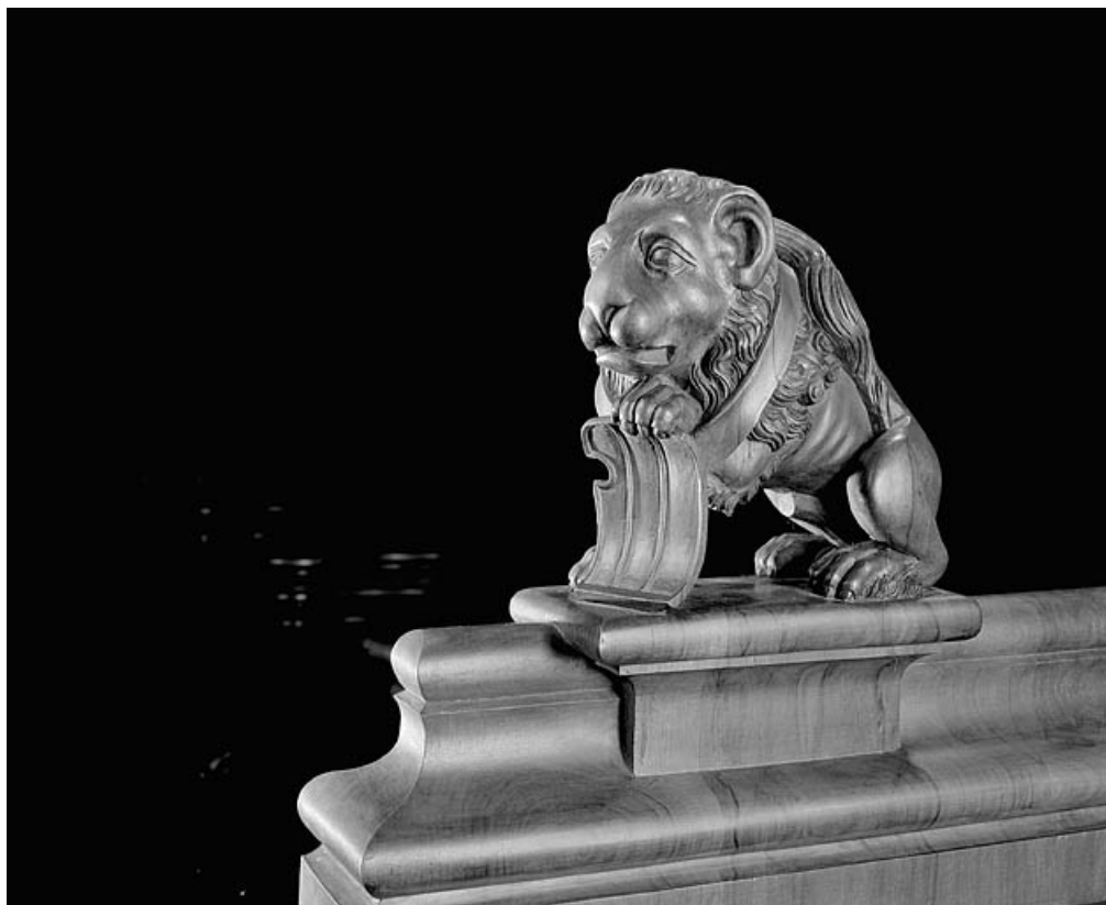
Statuette de la troisième jouée basse : lion.