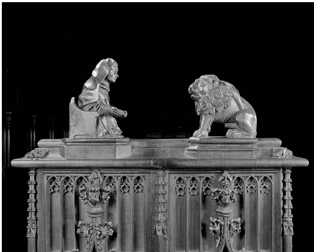
Statuettes de la quatrième jouée basse : moine lisant et lion.