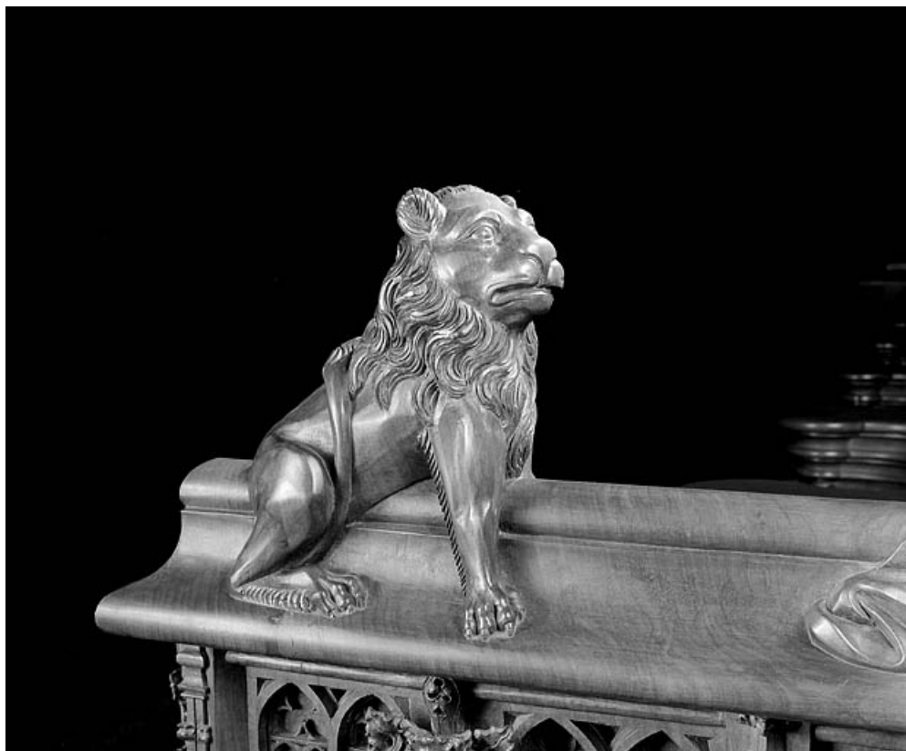
Statuette de la première jouée basse : lion.