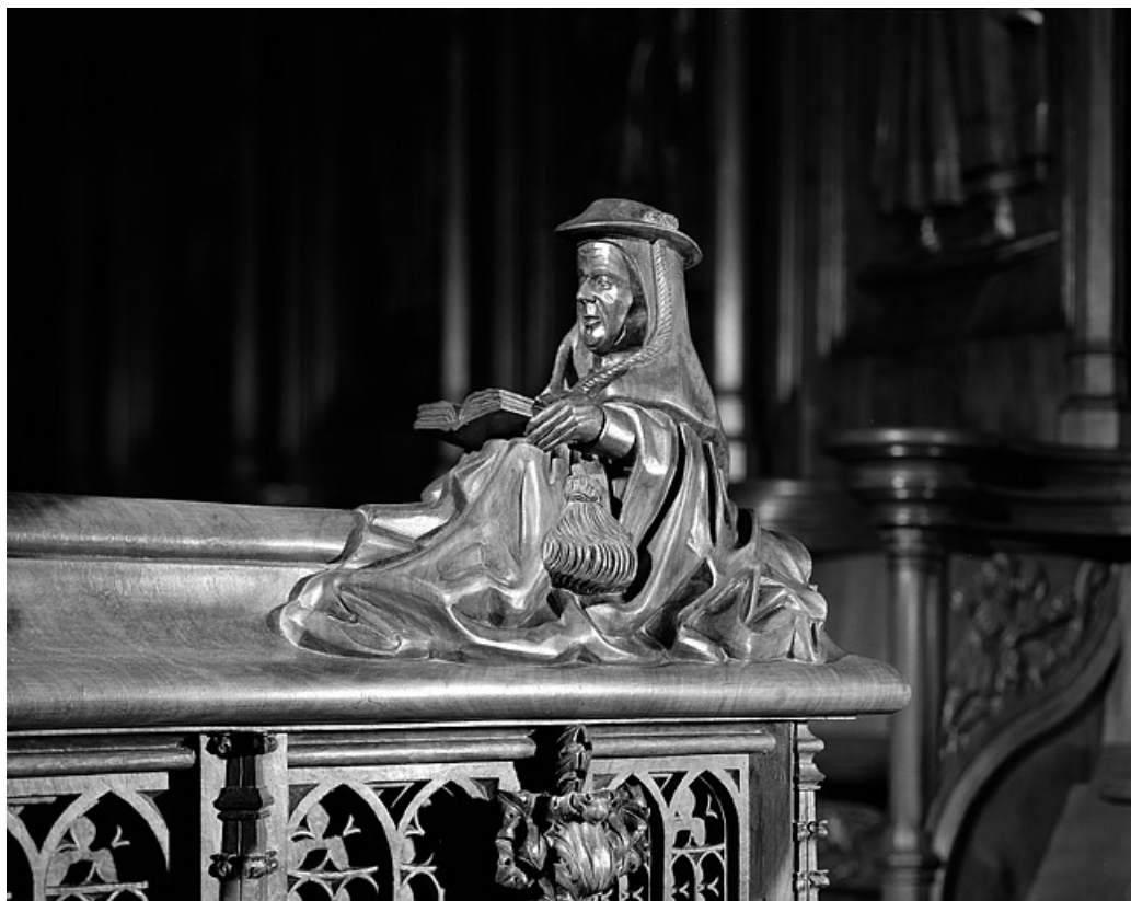
Statuette de la première jouée basse : homme lisant.