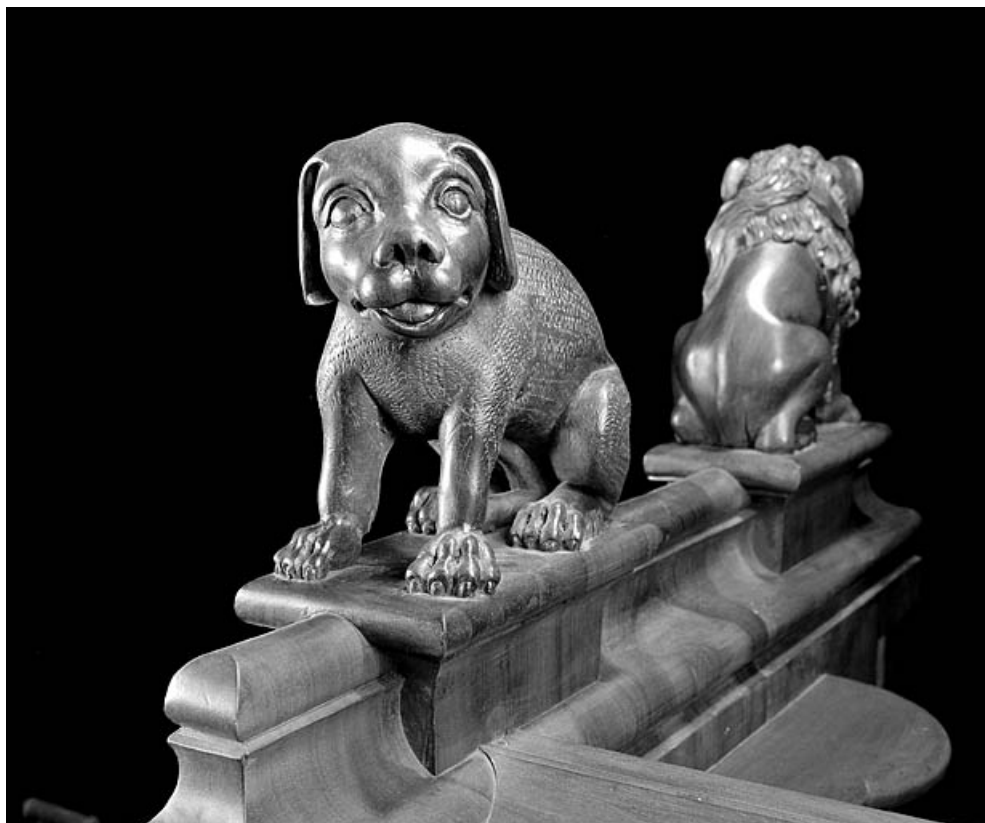
Statuette de la troisième jouée basse : chien.