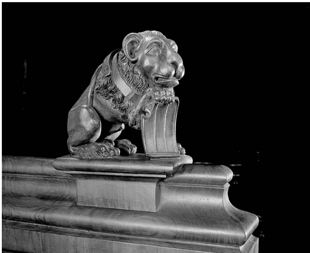
Statuette de la deuxième jouée basse : lion.