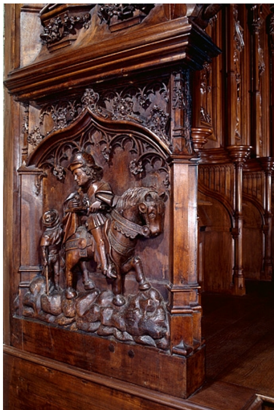
Deuxième jouée haute : La Charité de saint Martin.