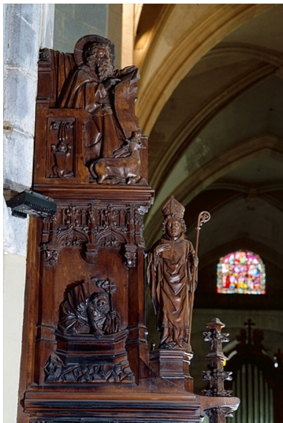
Deuxième jouée haute : saint Luc et Résurrection du Christ.