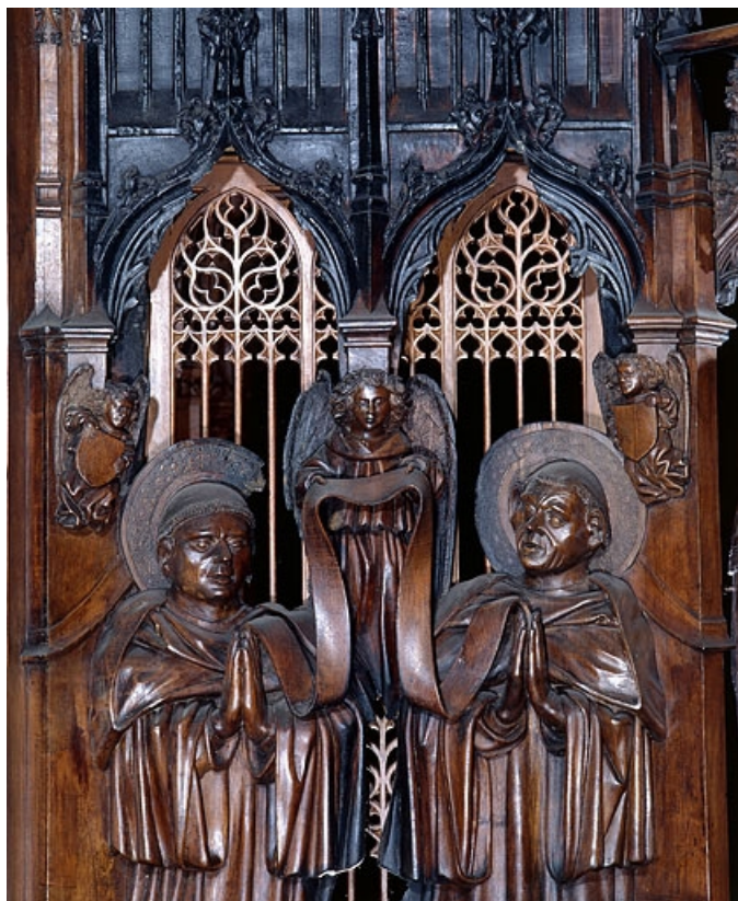
Deuxième jouée haute : saint Romain et saint Lupicin, détail.