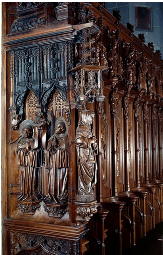
Deuxième jouée haute : saint Romain et saint Lupicin.