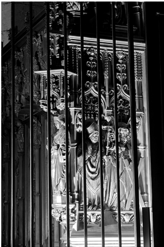
Première jouée haute : saint Claude et saint André. 39, Saint-Claude place de l' Abbaye