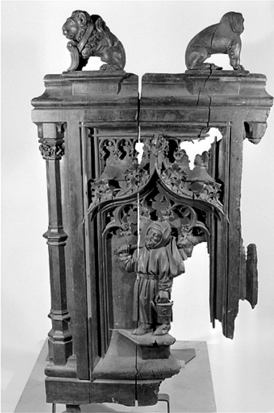
Troisième jouée basse : moine jardinier, brûlée. 39, Saint-Claude place de l' Abbaye