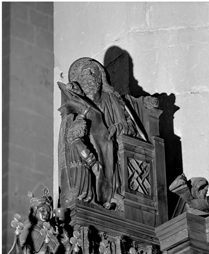
Première jouée haute : saint Matthieu.