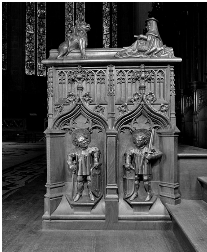
Première jouée basse : saint Maurice et saint Victor d'Agaune. 39, Saint-Claude place de l' Abbaye