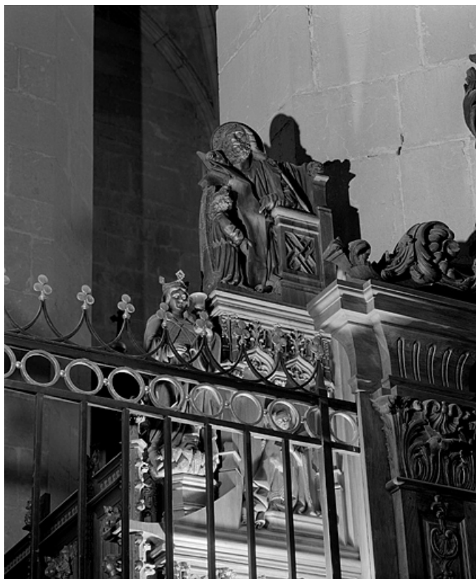
Première jouée haute : Vierge de l'Annonciation et saint Matthieu. 39, Saint-Claude place de l' Abbaye