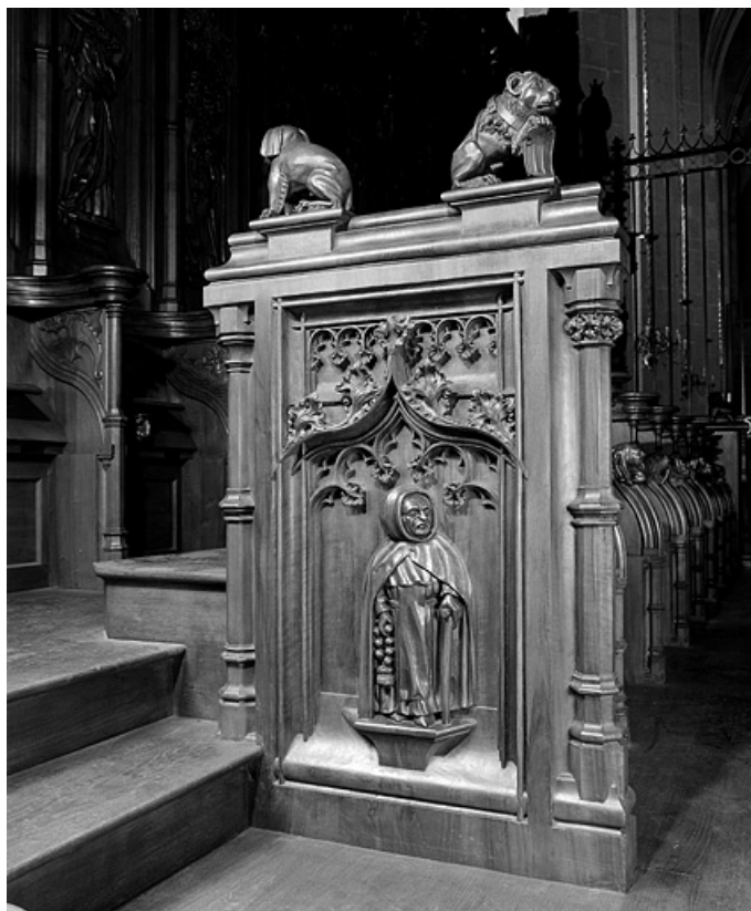
Deuxième jouée basse : moine disant son chapelet.