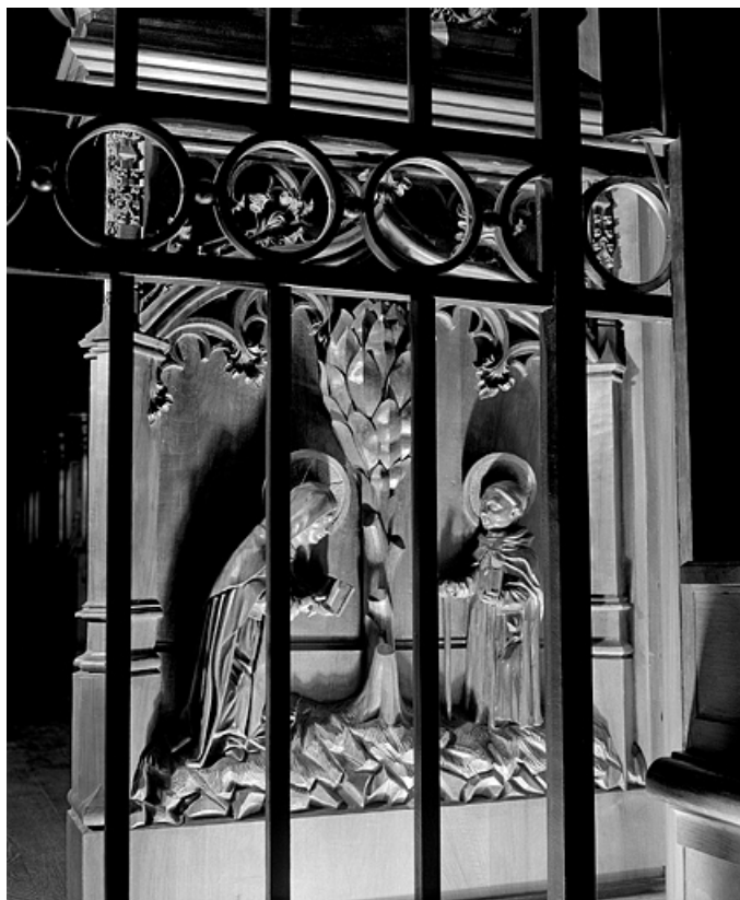
Première jouée haute : saint Romain et saint Lupicin au pied de leur sapin. 39, Saint-Claude place de l' Abbaye