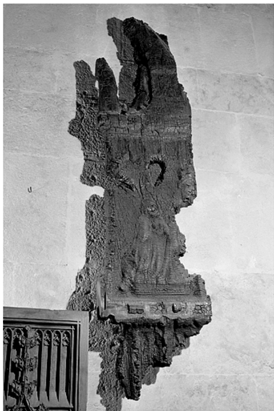
Première jouée haute : Vierge de l'Annonciation, brûlée. 39, Saint-Claude place de l' Abbaye