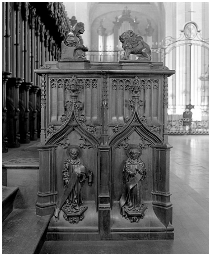
Quatrième jouée basse : saint Romain et saint Lupicin.