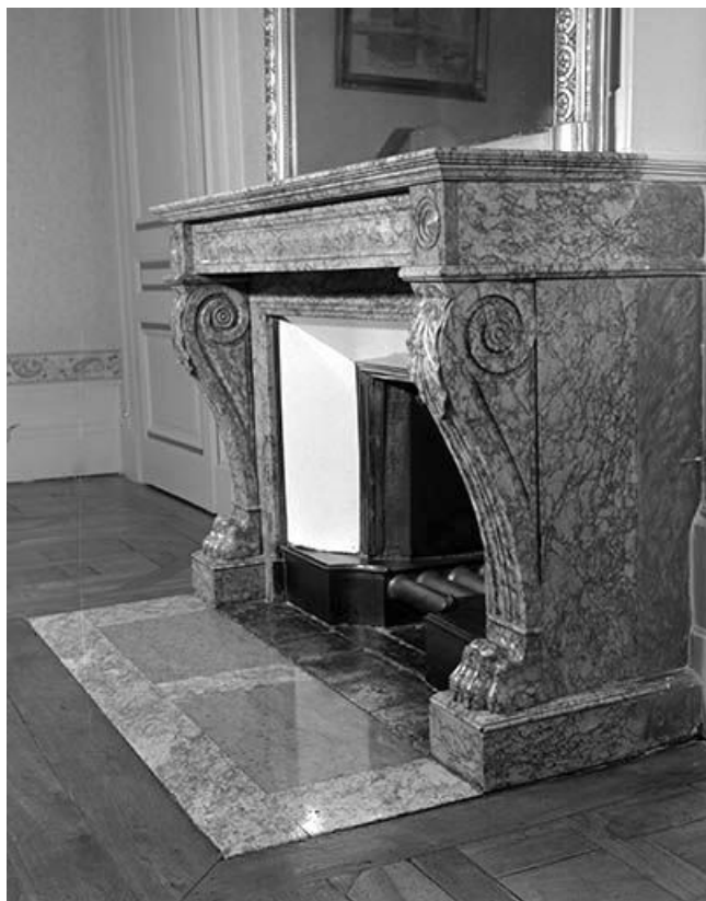
Le manteau vu de trois quarts.

39, Saint-Claude, 2 rue de la Sous-préfecture