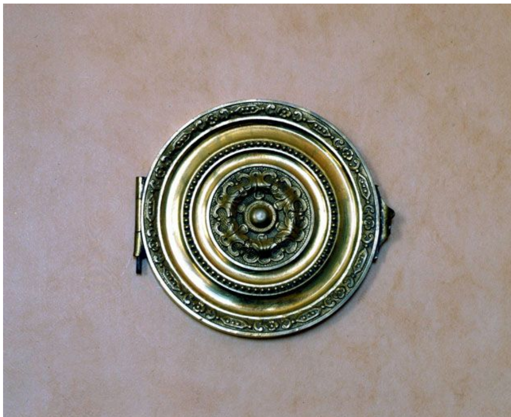
Bouche de chaleur de la cheminée, fermée.

39, Saint-Claude, 2 rue de la Sous-préfecture