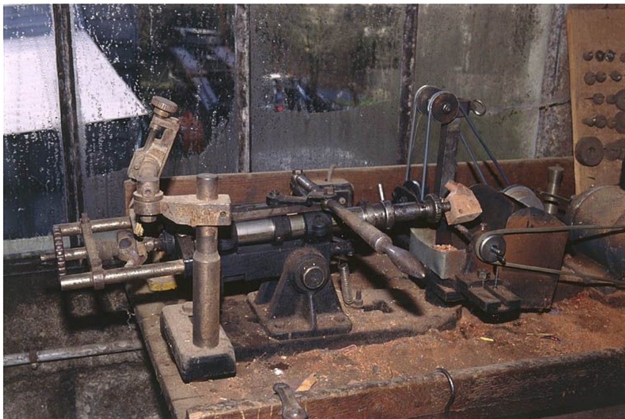
Vue d'ensemble de la partie gauche : guide et support de l'ébauchon.