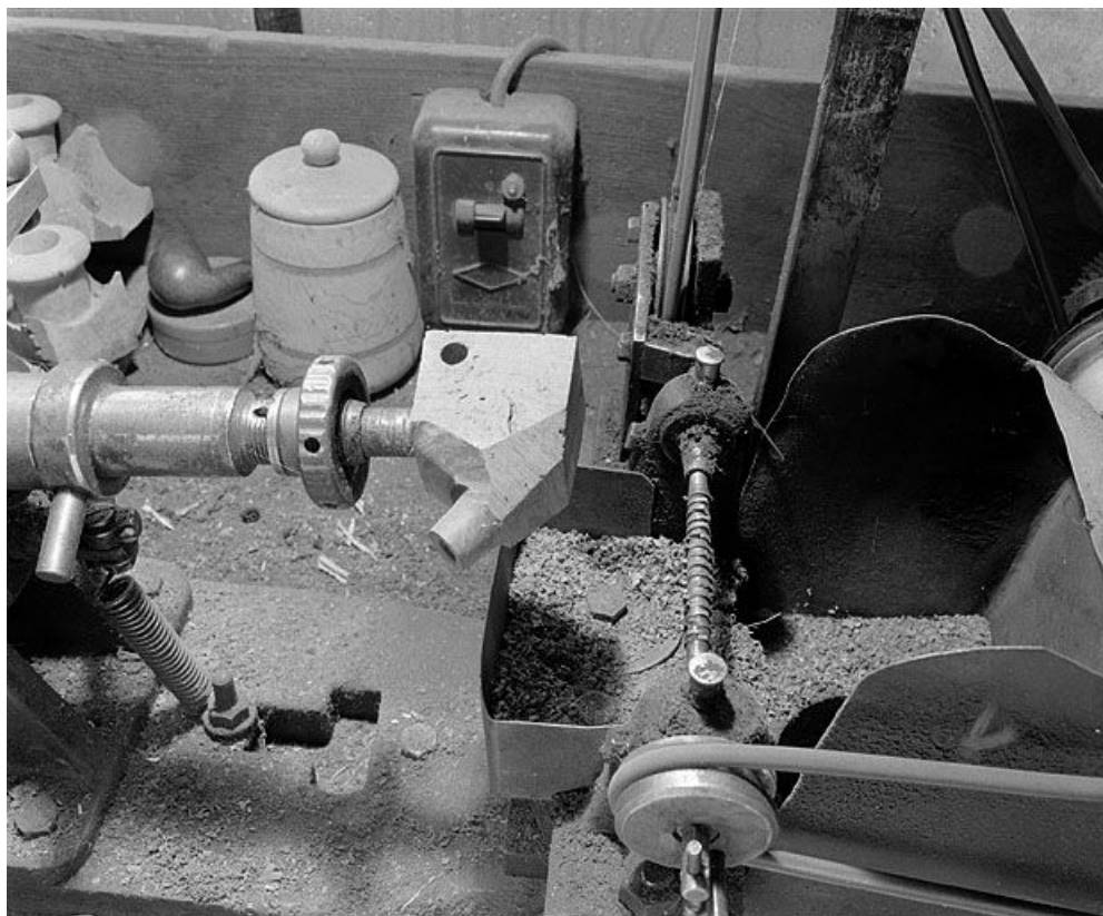
Partie gauche : détail du support de l'ébauchon. A droite, arbre cranté horizontal faisant office de fraise. 39, Saint-Claude, lieudit : Etables