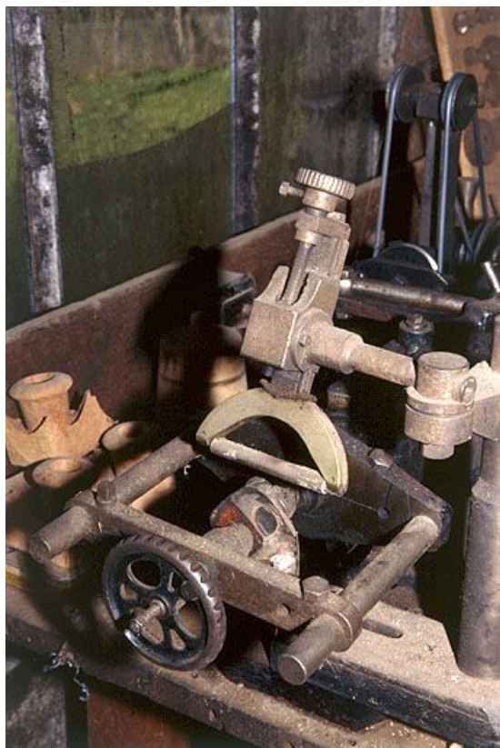
Partie gauche : détail du guide et du modèle.