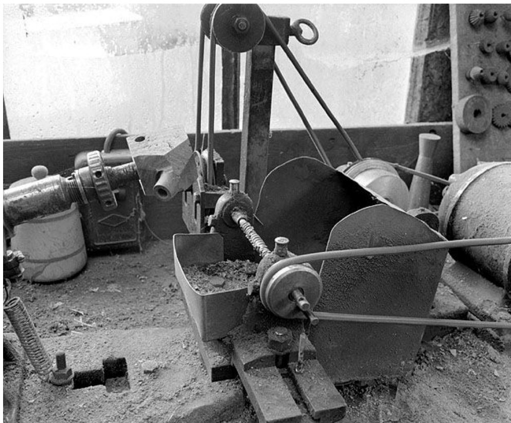
Vue d'ensemble de la partie droite : arbre cranté horizontal faisant office de fraise.