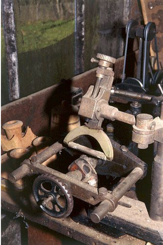
Partie gauche : détail du guide et du modèle.