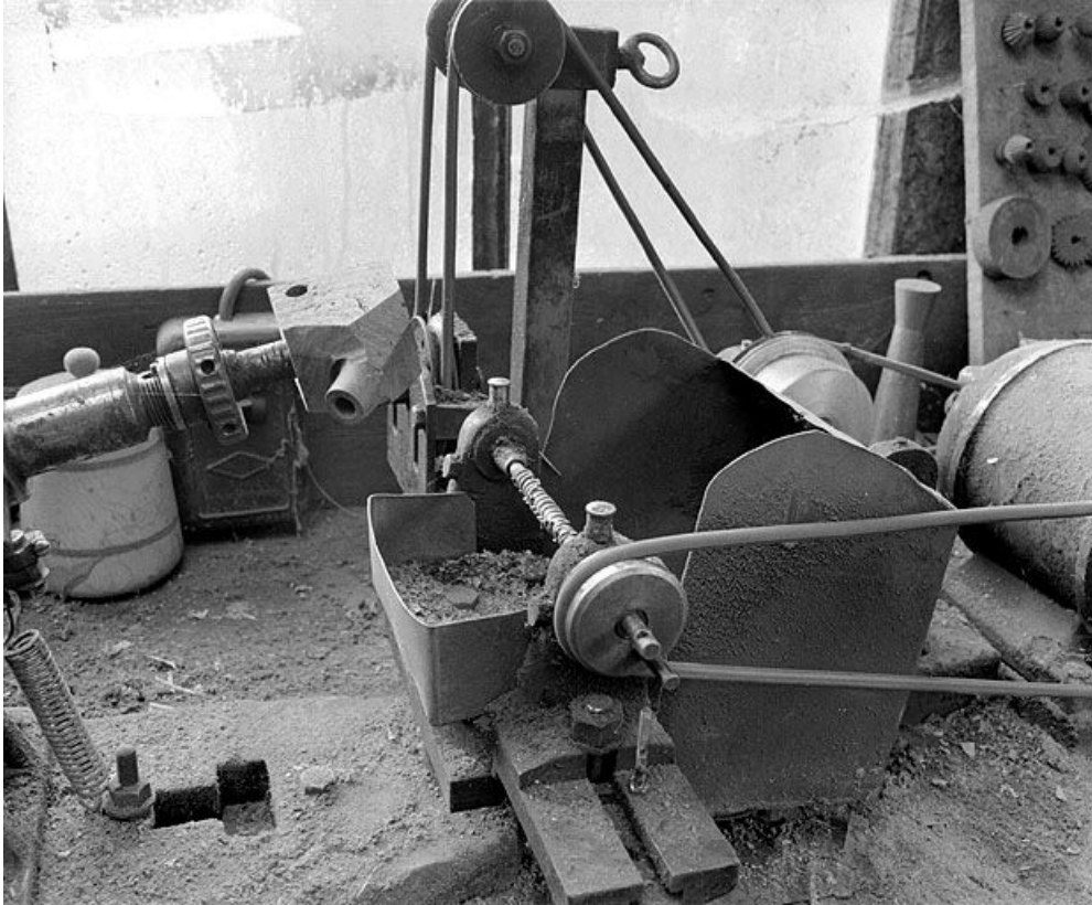
Vue d'ensemble de la partie droite : arbre cranté horizontal faisant office de fraise. 39, Saint-Claude, lieudit : Etables