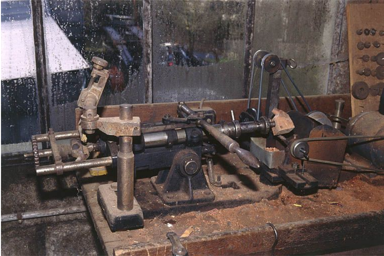
Vue d'ensemble de la partie gauche : guide et support de l'ébauchon.