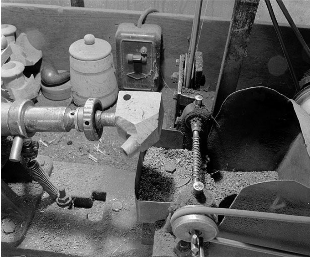
Partie gauche : détail du support de l'ébauchon. A droite, arbre cranté horizontal faisant office de fraise. 39, Saint-Claude, lieudit : Etables