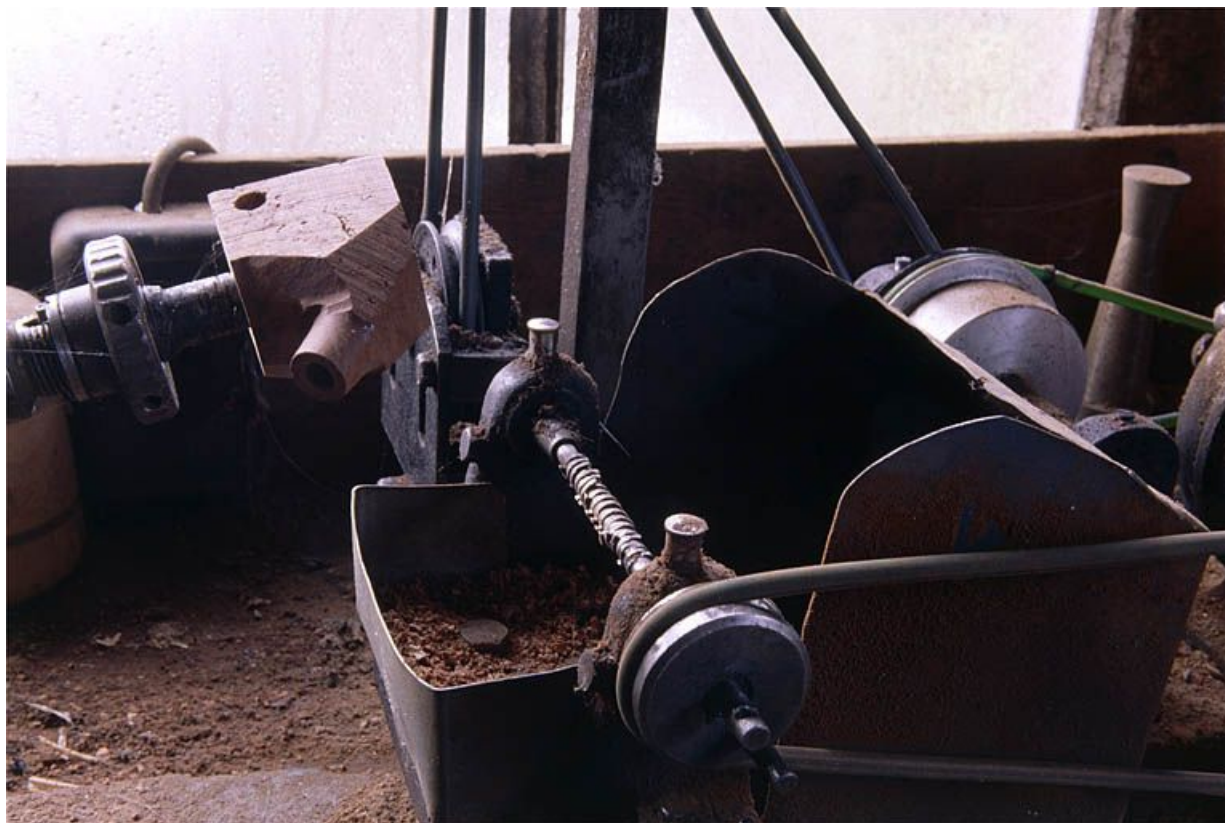
Vue d'ensemble de la partie droite : arbre cranté horizontal faisant office de fraise.