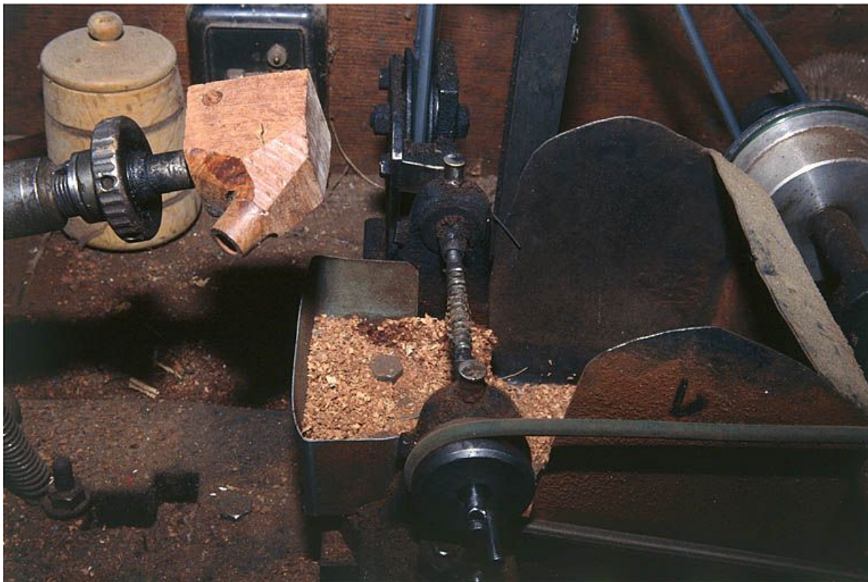
Partie gauche : détail du support de l'ébauchon. A droite, arbre cranté horizontal faisant office de fraise. 39, Saint-Claude, lieudit : Etables