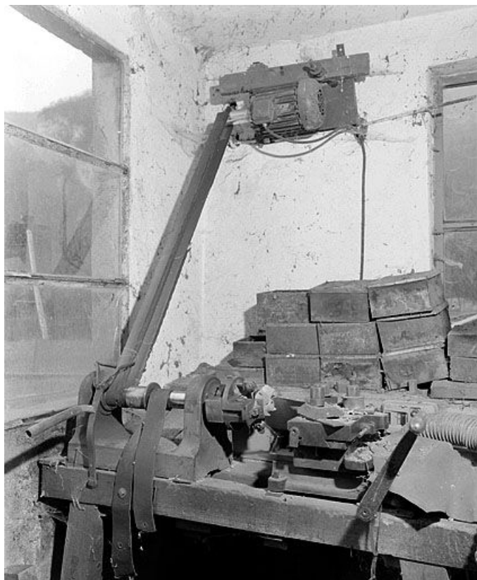
Vue d'ensemble avec son moteur.