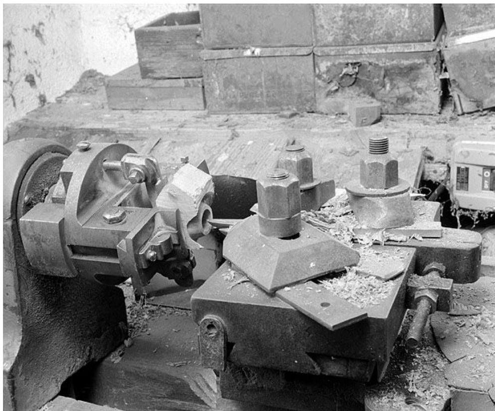
Mandrin gueule de loup et chariot porte-outils, vus de trois quarts.