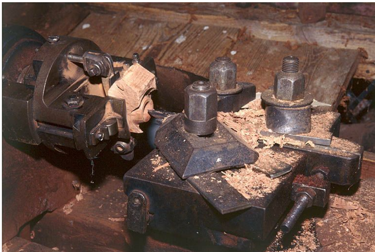
Mandrin gueule de loup et chariot porte-outils, vus de trois quarts.