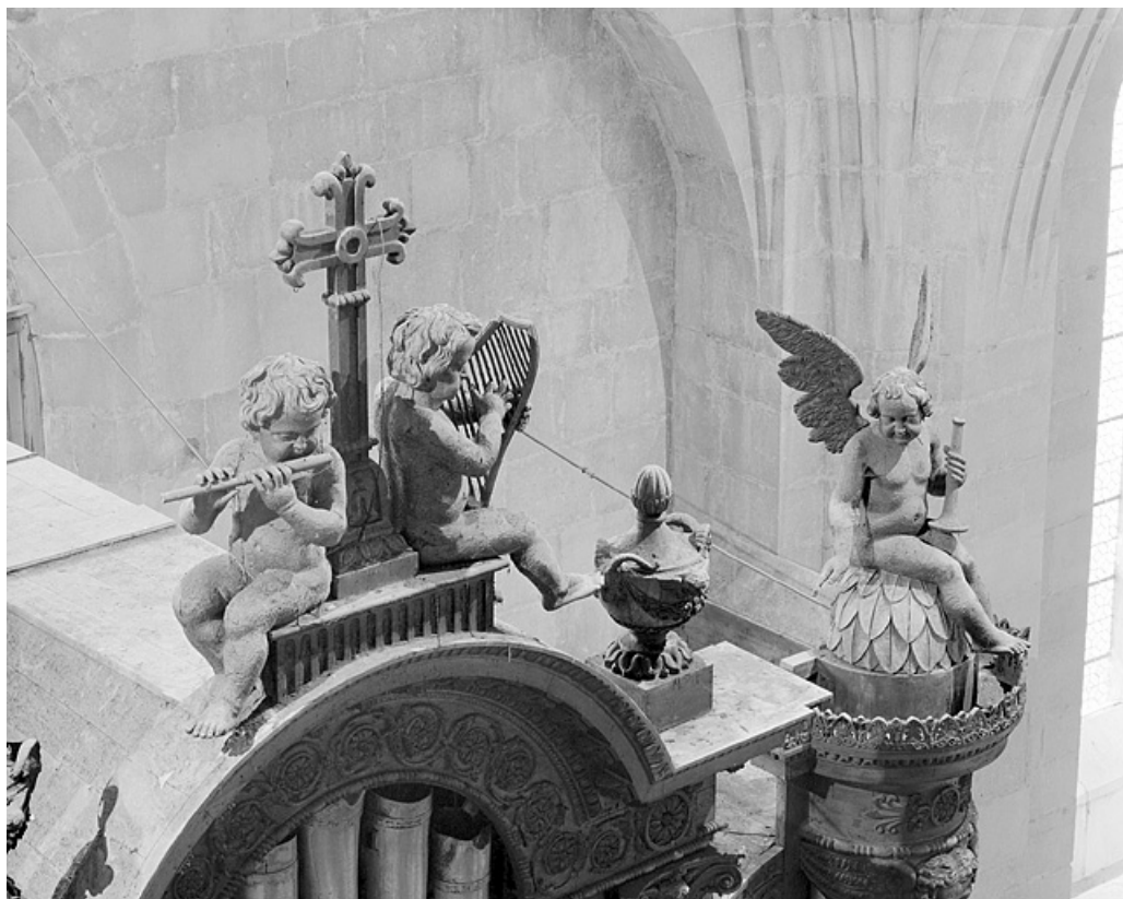
Détail buffet : anges musiciens et couronnements des tourelles, vu de trois quarts gauche.