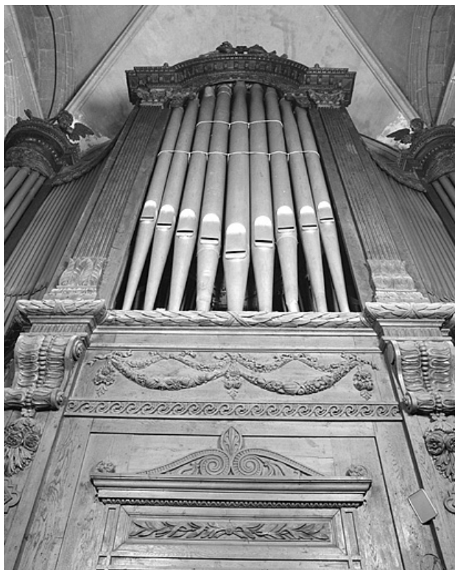
Détail buffet : tourelle centrale vue en contre-plongée.