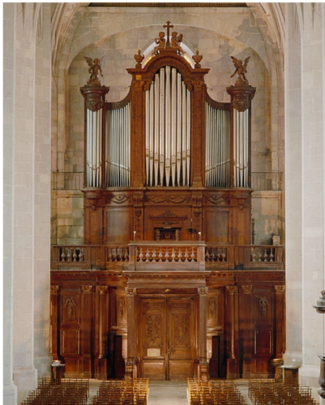
Grand orgue, vu de face.