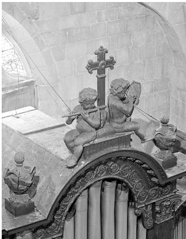
Détail buffet : anges musiciens et couronnement tourelle centrale, vus de trois quarts gauche.