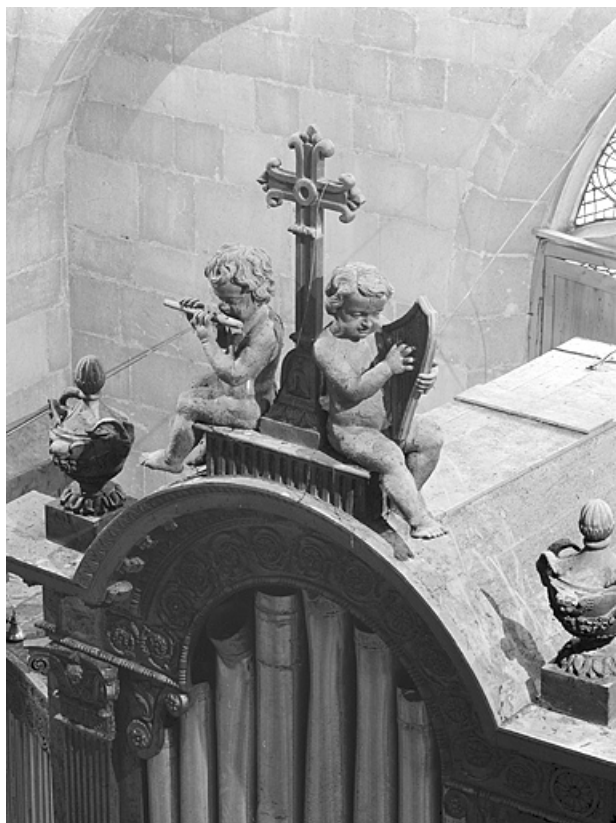
Détail buffet : anges musiciens et couronnement tourelle centrale, vus de trois quarts droit.