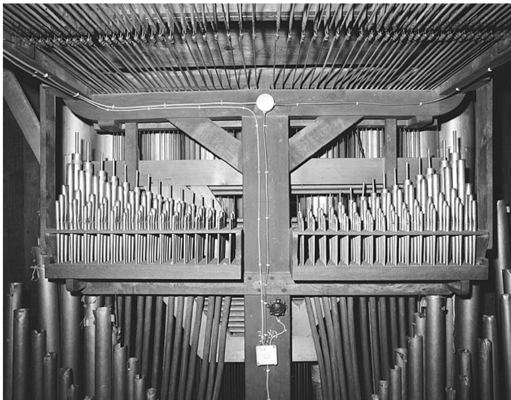
Jeux de cornet du grand orgue, vu de face.