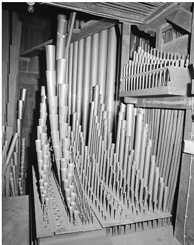
Tuyauterie du grand orgue, vu de trois quarts gauche.