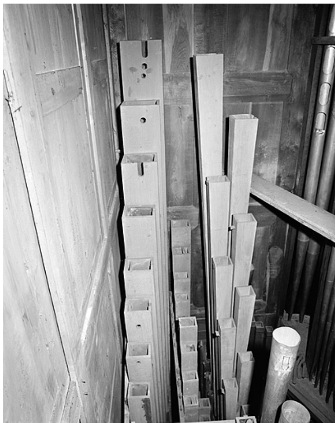
Tuyauterie de pédale, vue de face.