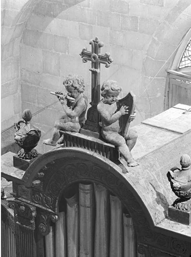
Détail buffet : anges musiciens et couronnement tourelle centrale, vus de trois quarts droit.