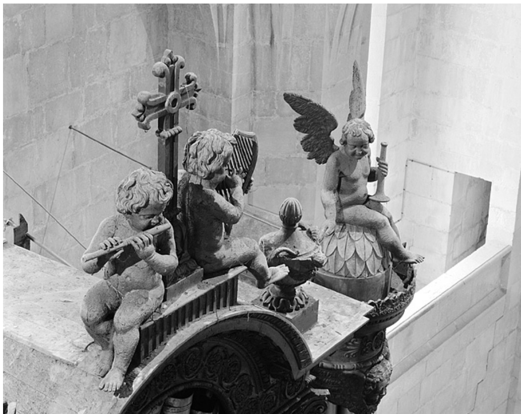
Détail buffet : anges musiciens et couronnements des tourelles, vu de trois quarts gauche.