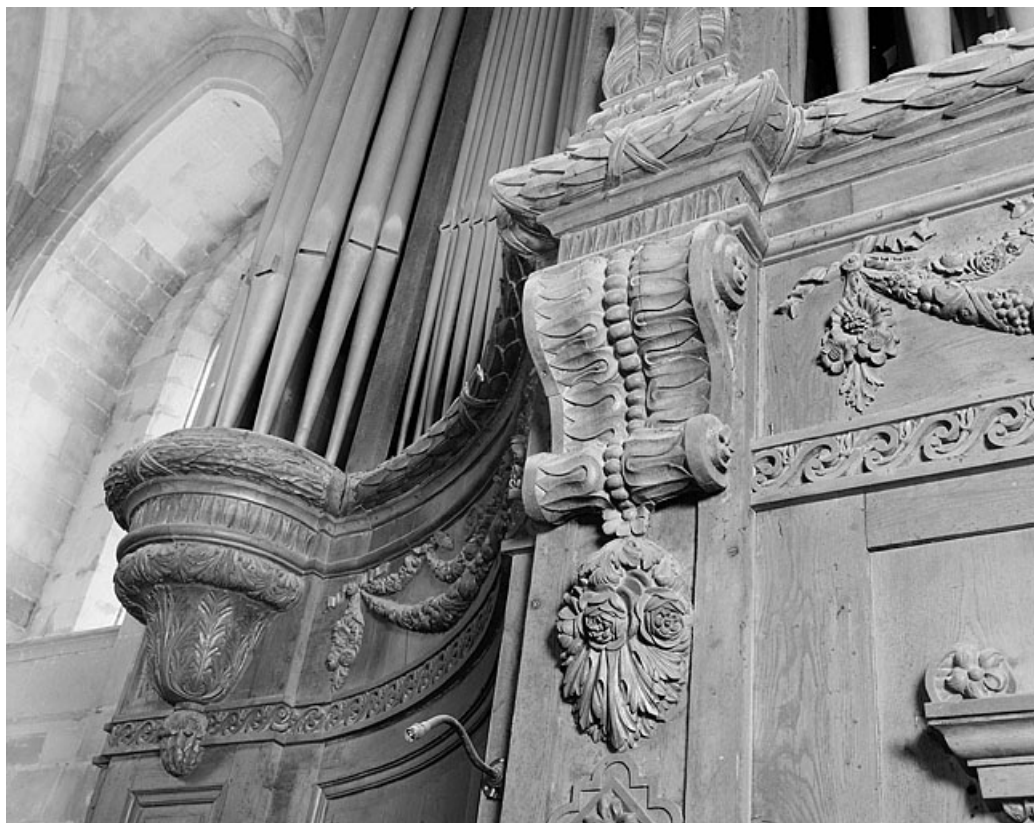
Détail buffet : sculptures 19e vues de trois quarts droit.