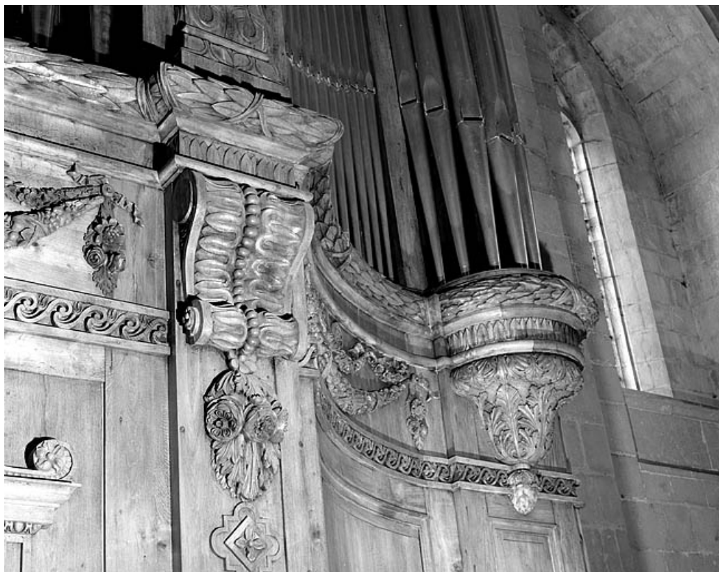
Détail de la frise sous les tuyaux.