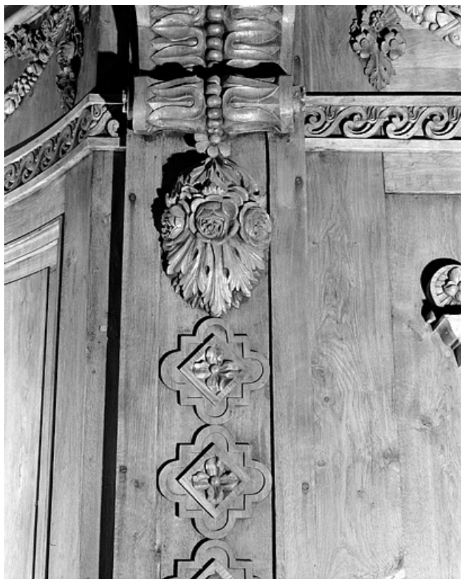
Détail du décor du buffet.