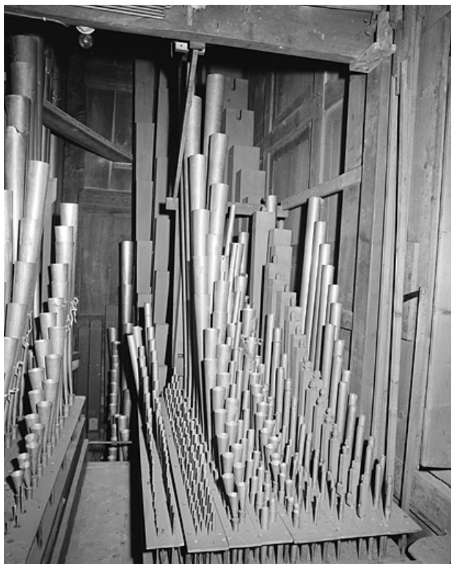
Tuyauterie du positif, vu générale de trois quarts gauche.