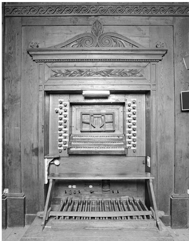
Console en fenêtre, vue de face.