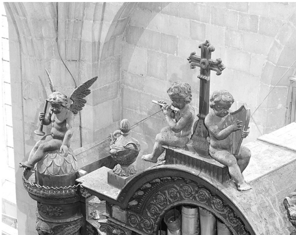
Détail buffet : anges musiciens et couronnements des tourelles, vu de trois quarts droit.