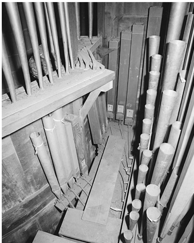
Tuyauterie de pédale, vue de face en plongée.