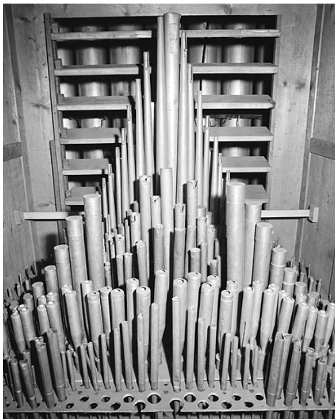
Tuyauterie du récit, vue de face.