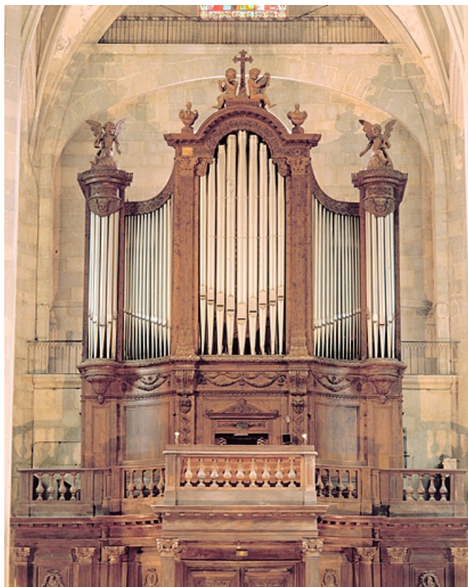
Grand orgue, vu de face en contre-plongée.