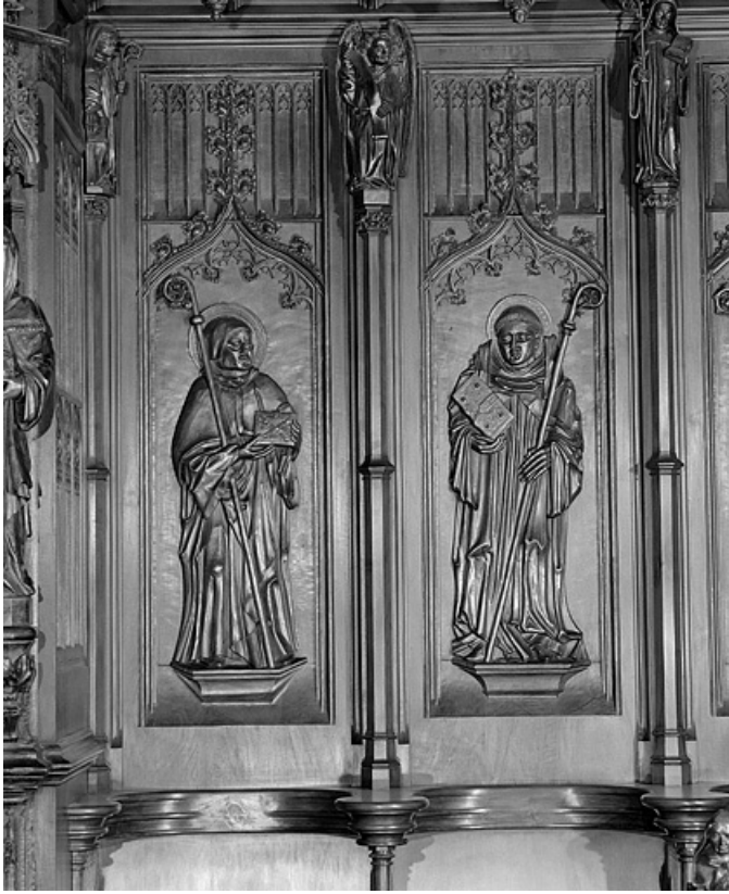
Les vingt et unième et vingt-deuxième panneaux.