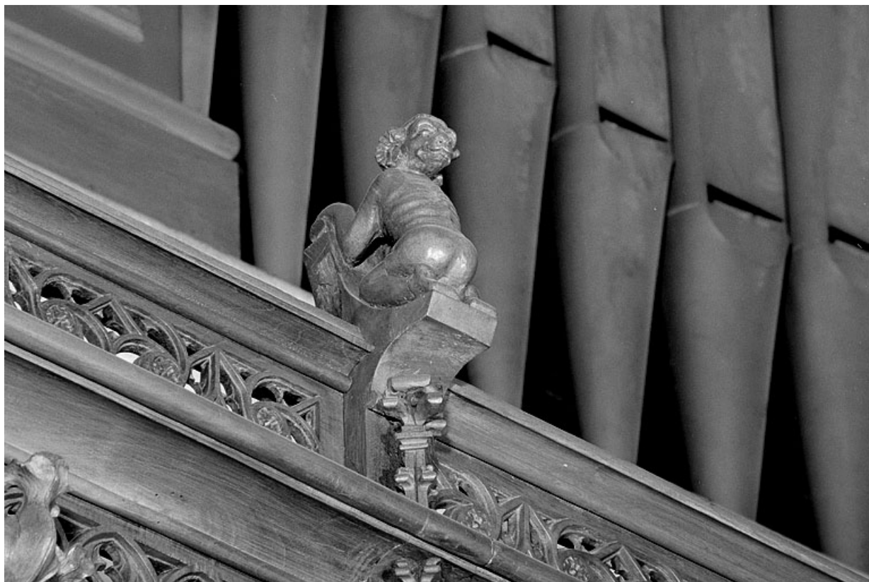
Vue de la quinzième statuette : personnage à tête de bélier.