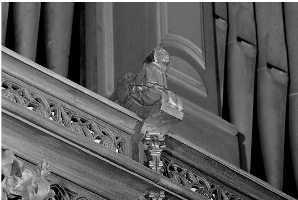
Vue de la quatorzième statuette : moine. 39, Saint-Claude place de l' Abbaye