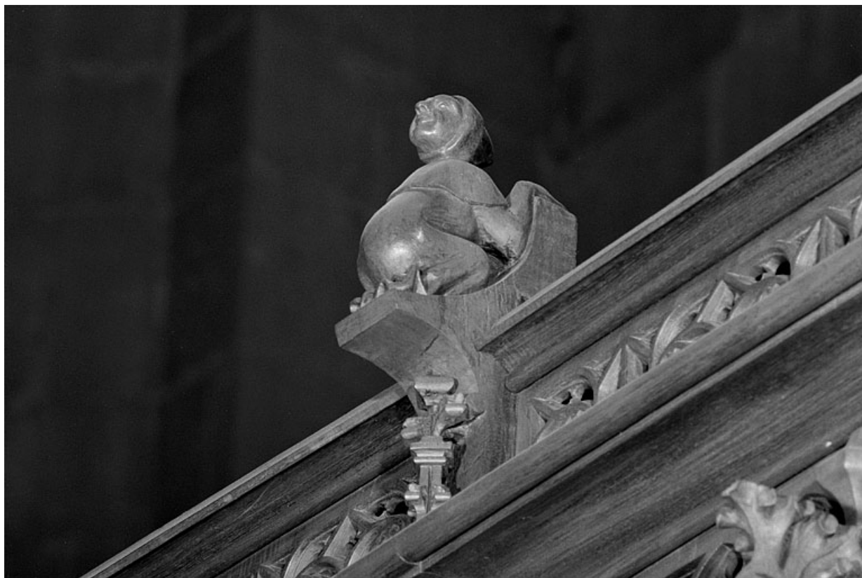
Vue de la dixième statuette : personnage avec visage au dos de la tête.