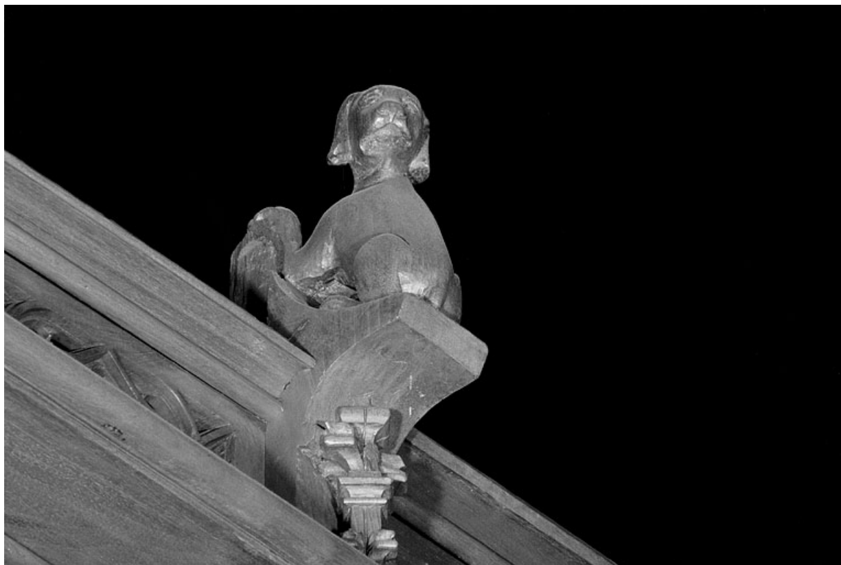
Vue de la troisième statuette : chien, vu de trois quarts gauche.