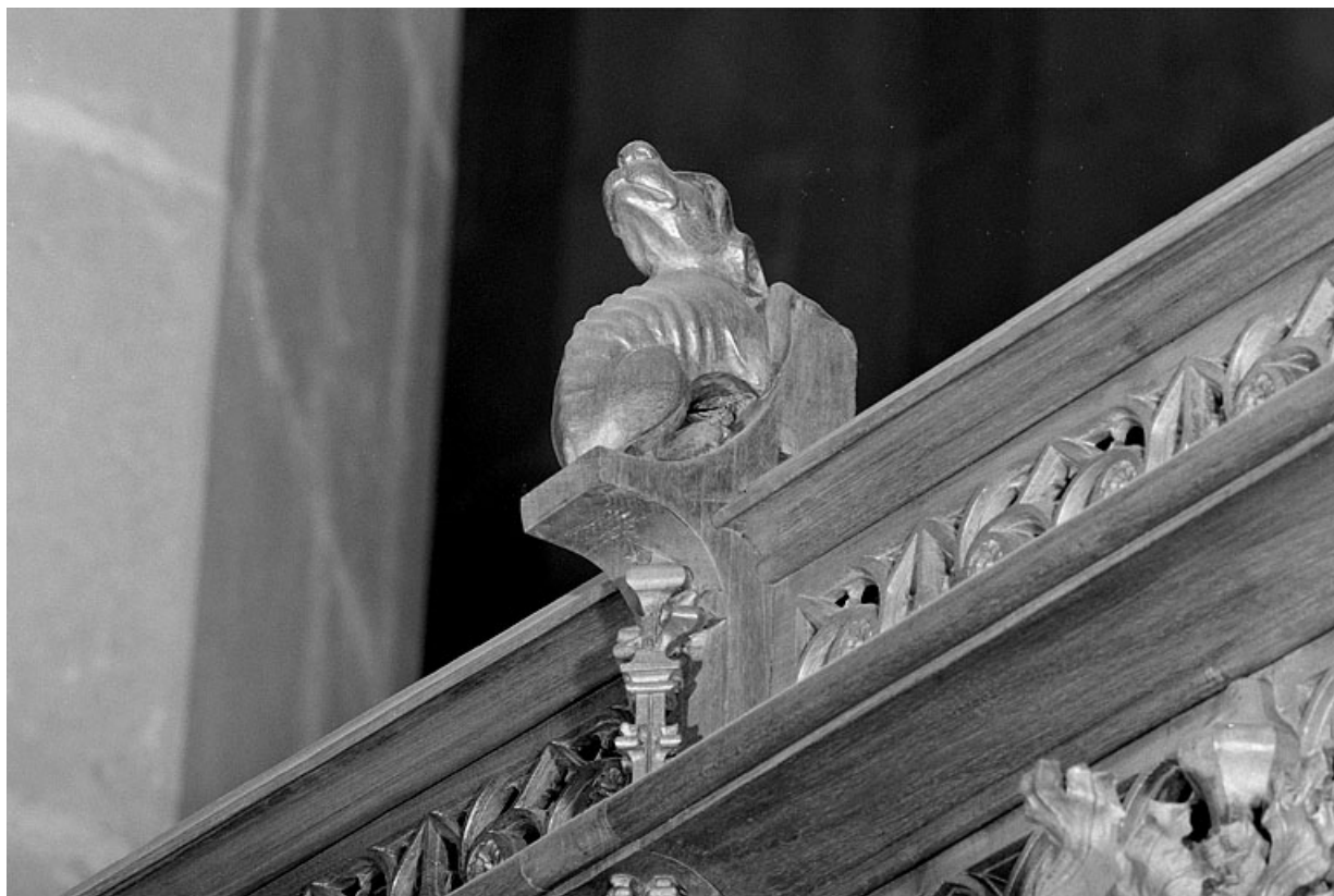
Vue de la huitième statuette : chien.