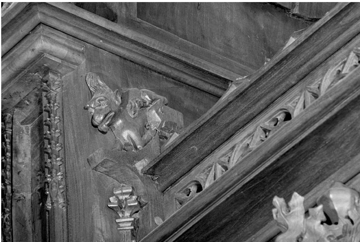
Vue de la première statuette : griffon.