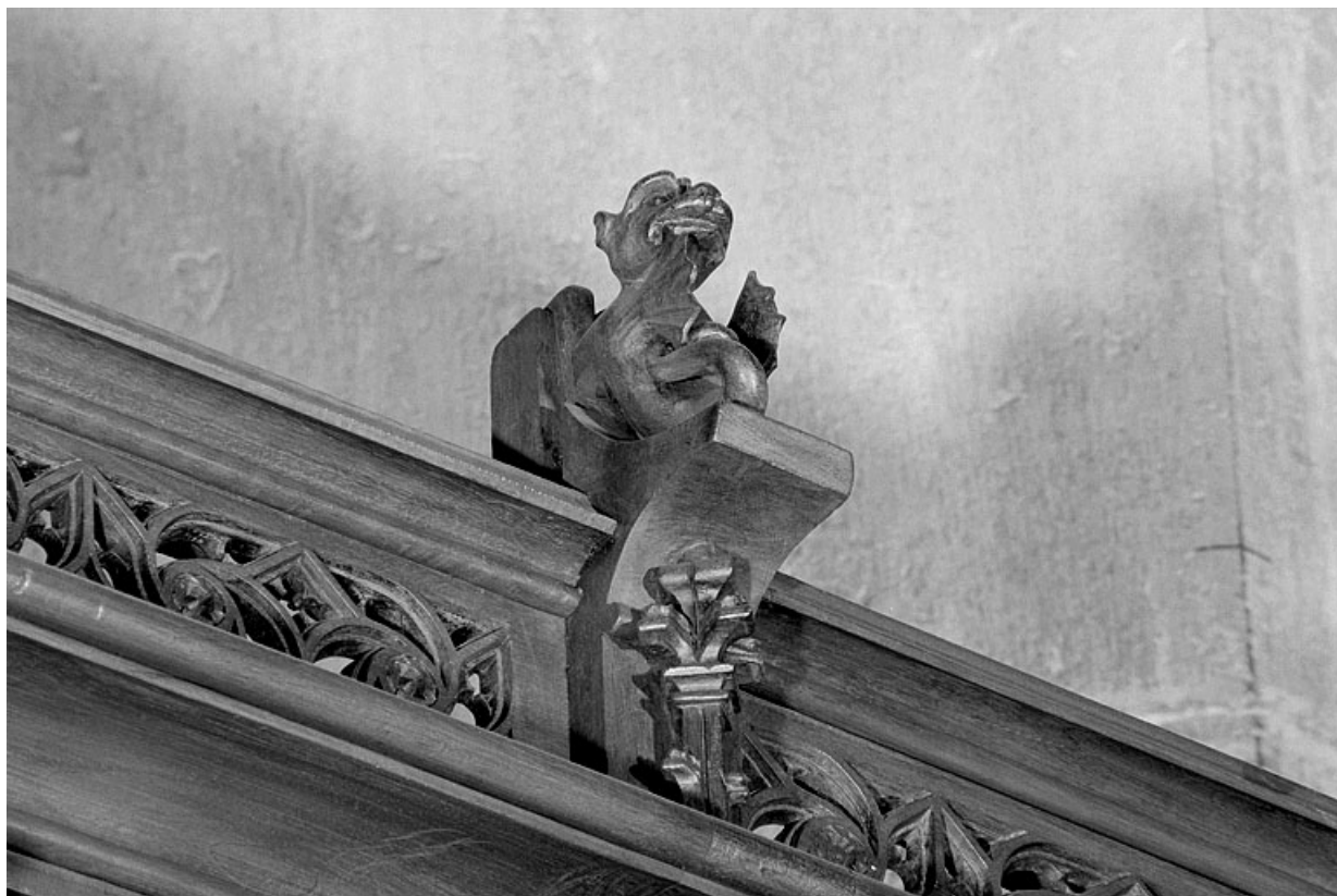
Vue de la vingt et unième statuette : dragon.