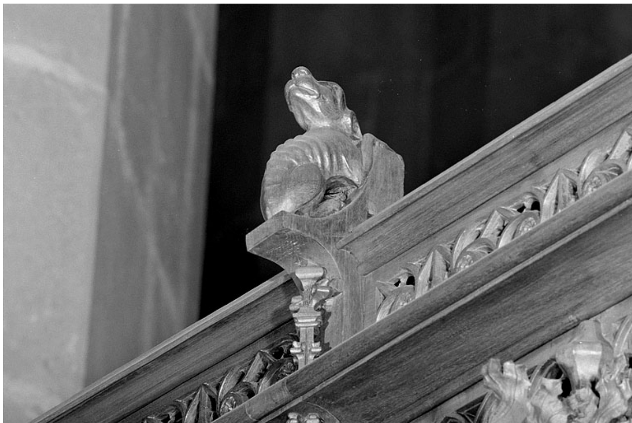
Vue de la huitième statuette : chien.