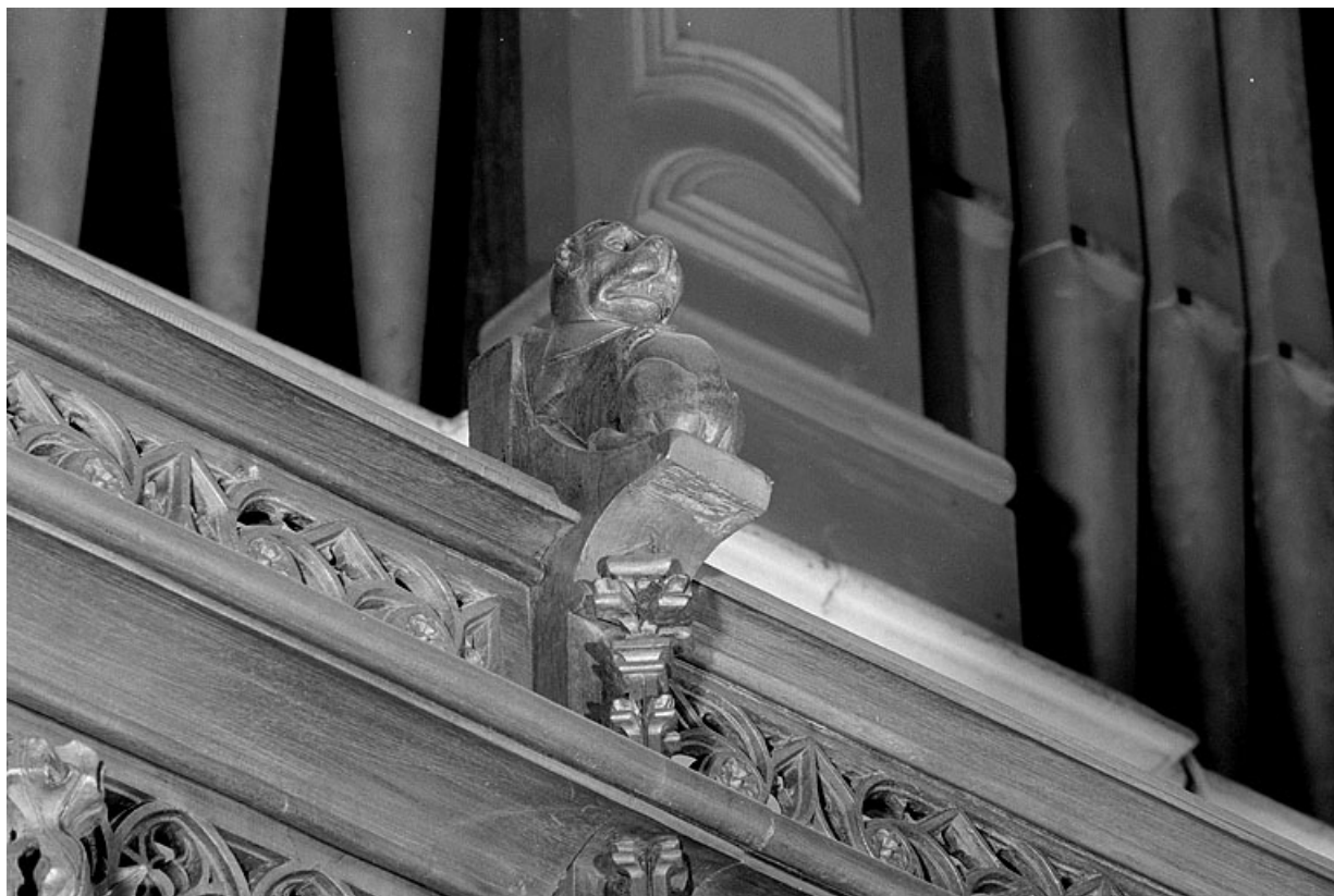
Vue de la dix-septième statuette : lion.