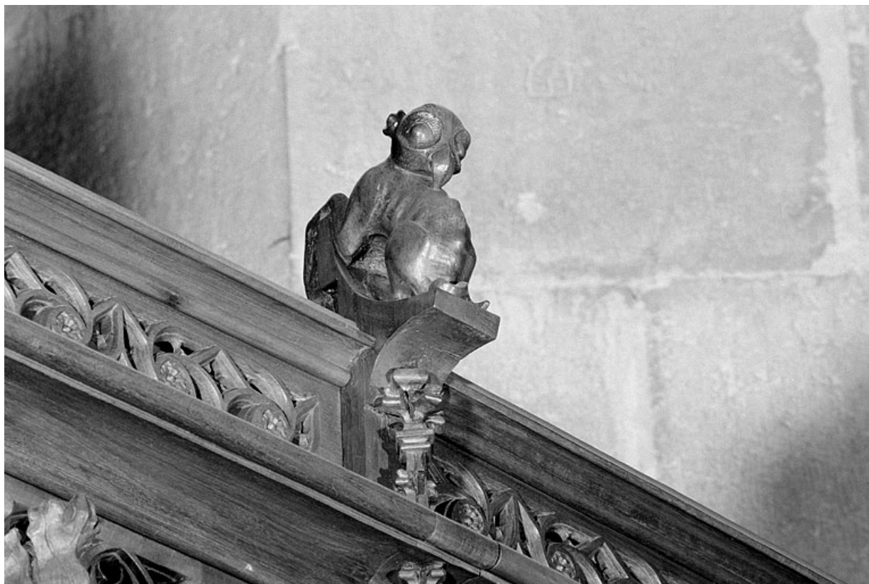
Vue de la neuvième statuette : quadrupède à tête de faucon.