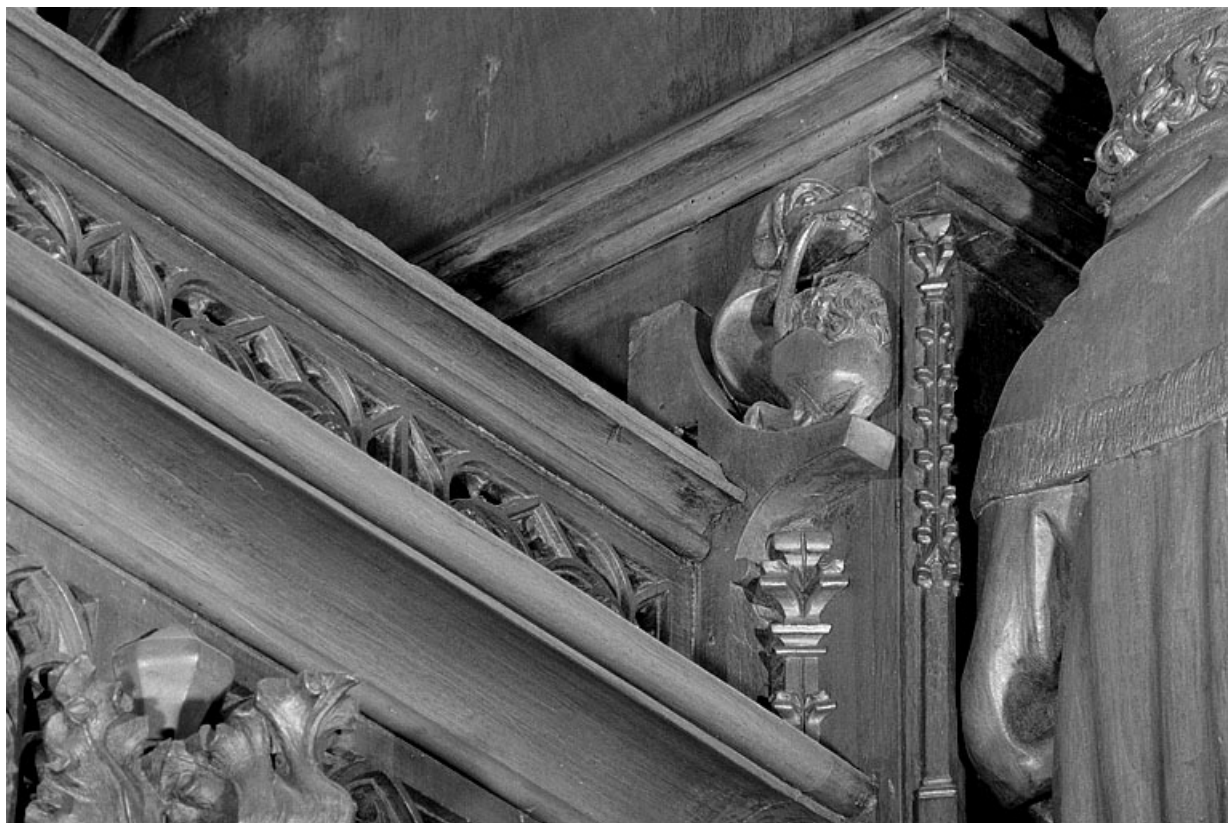
Vue de la vingt-troisième statuette : hybride.