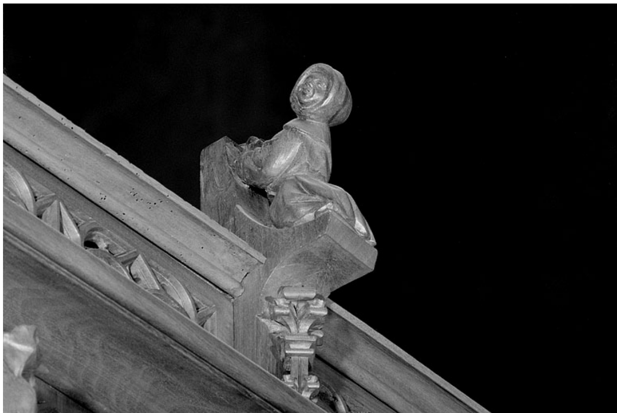
Vue de la cinquième statuette : personnage agenouillé.