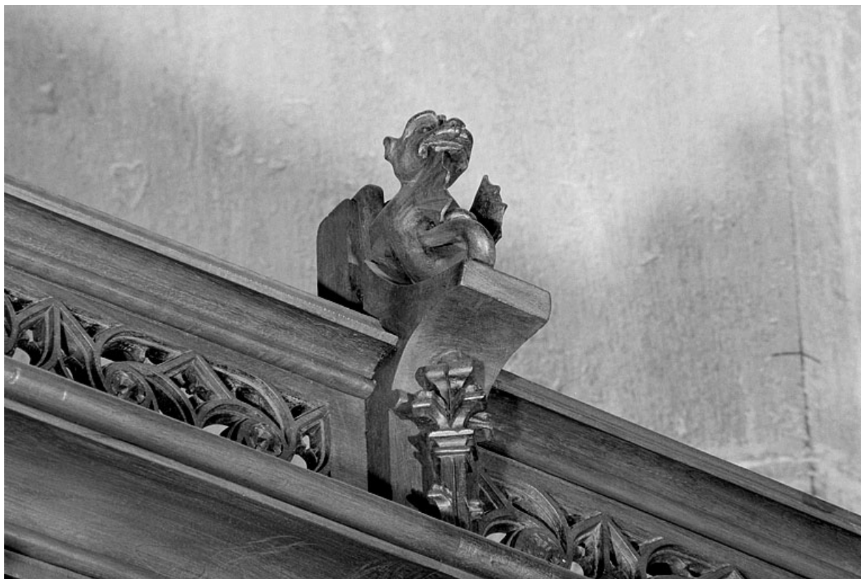
Vue de la vingt et unième statuette : dragon.