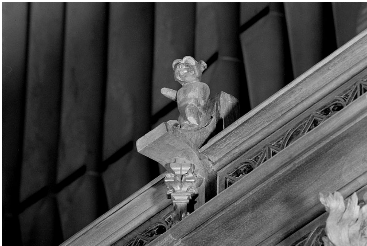
Vue de la vingtième statuette : animal.