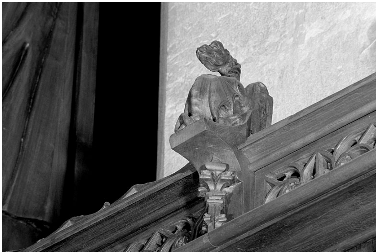
Vue de la deuxième statuette : dragon.