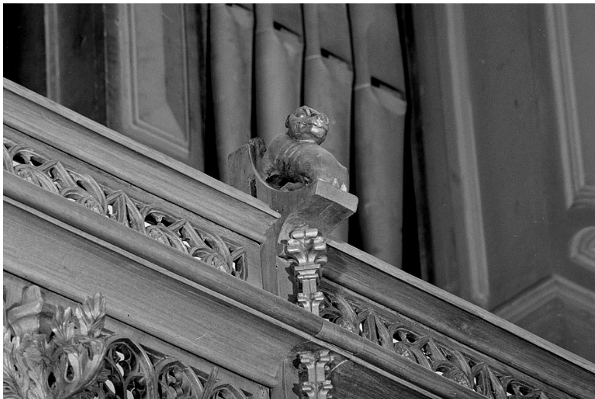
Vue de la treizième statuette : chien.