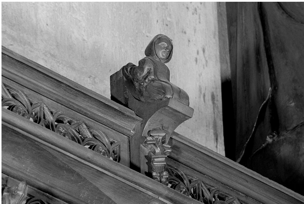
Vue de la vingt-deuxième statuette : moine.