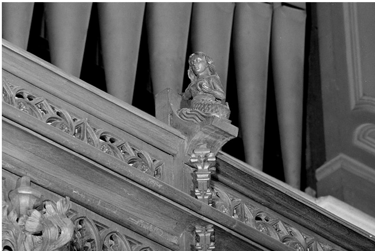
Vue de la seizième statuette : sirène. 39, Saint-Claude place de l' Abbaye