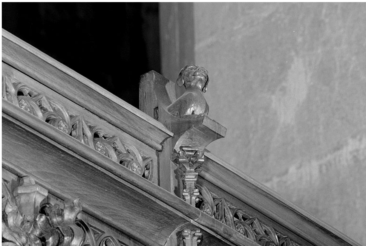
Vue de la septième statuette : avant-train de chien.