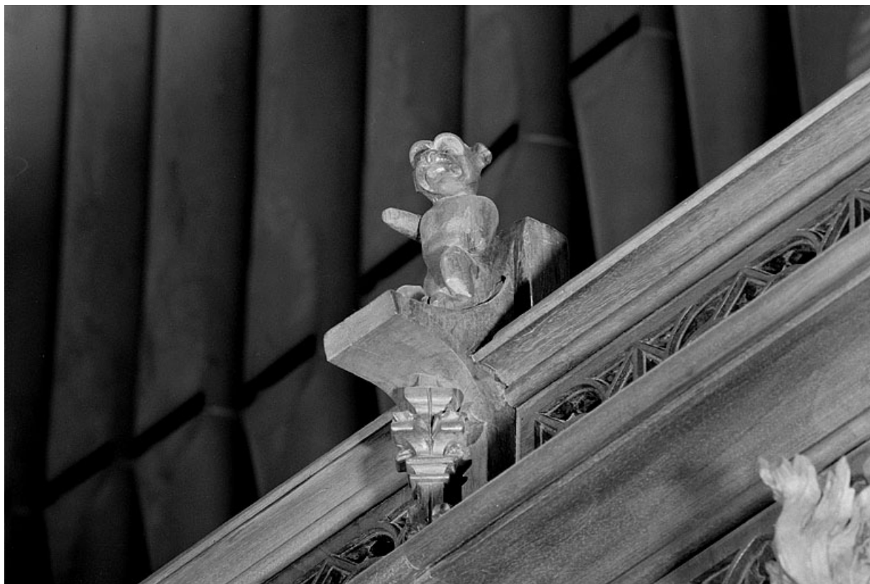
Vue de la vingtième statuette : animal.