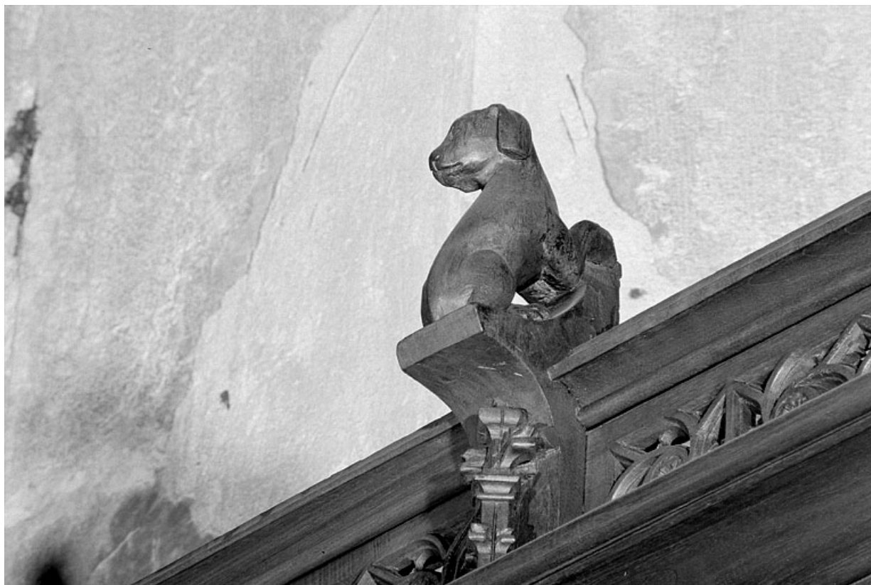
Vue de la troisième statuette : chien, vu de trois quarts droit.