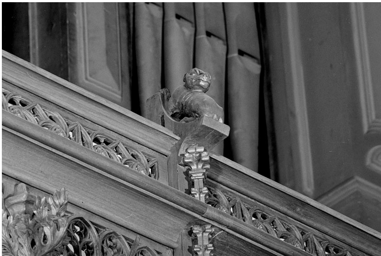
Vue de la treizième statuette : chien.