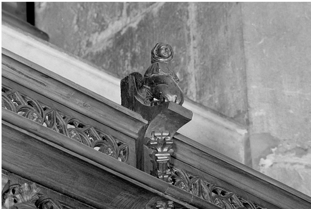
Vue de la dix-neuvième statuette : animal à tête humaine.