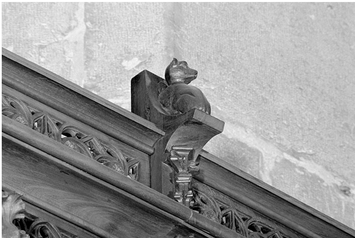
Vue de la onzième statuette : renard.