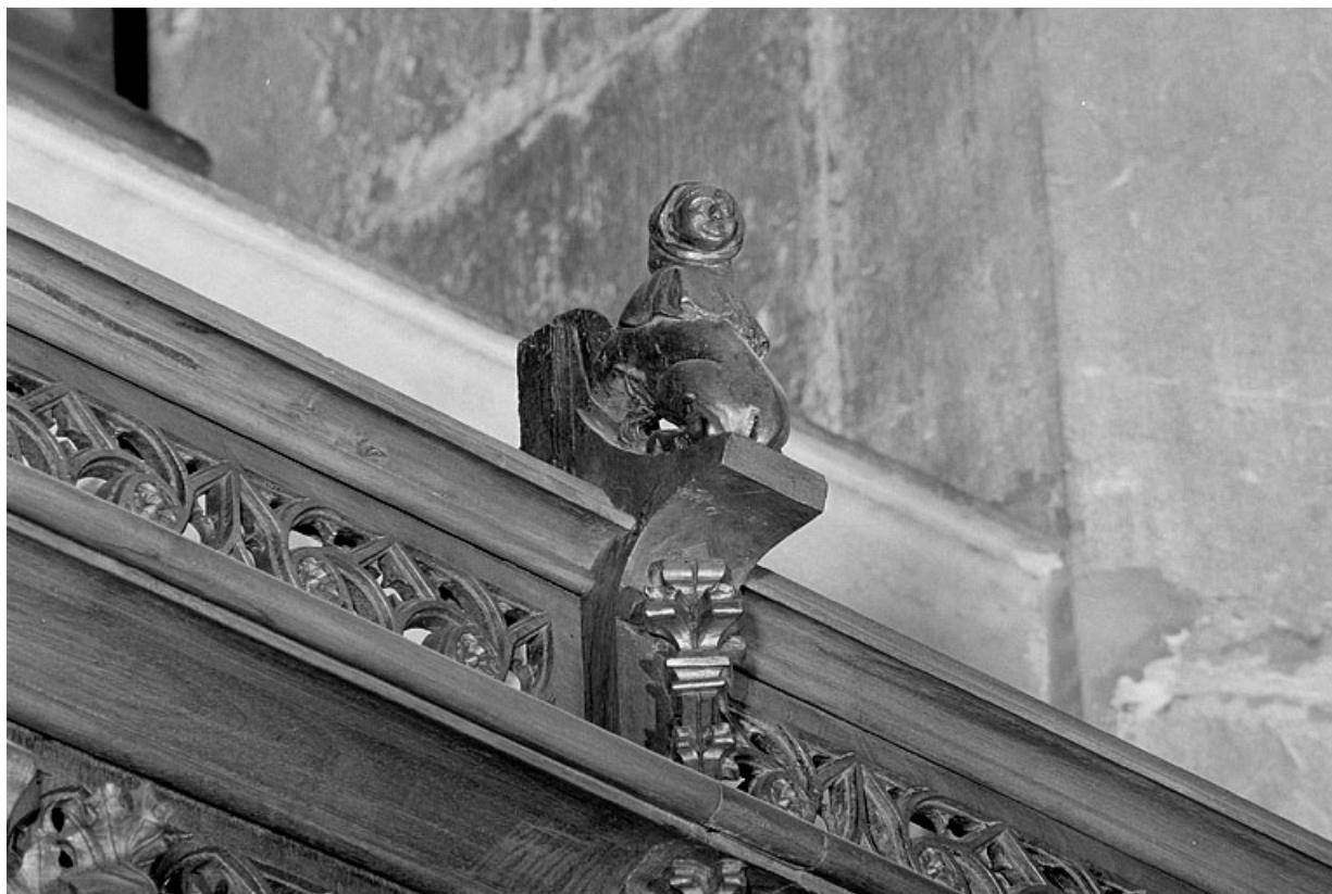
Vue de la dix-neuvième statuette : animal à tête humaine.