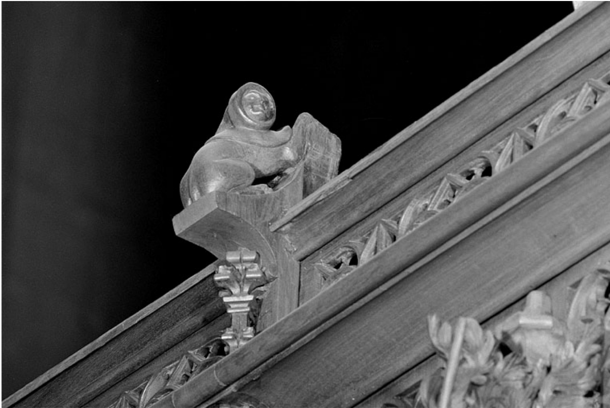
Vue de la douzième statuette : animal à visage humain.