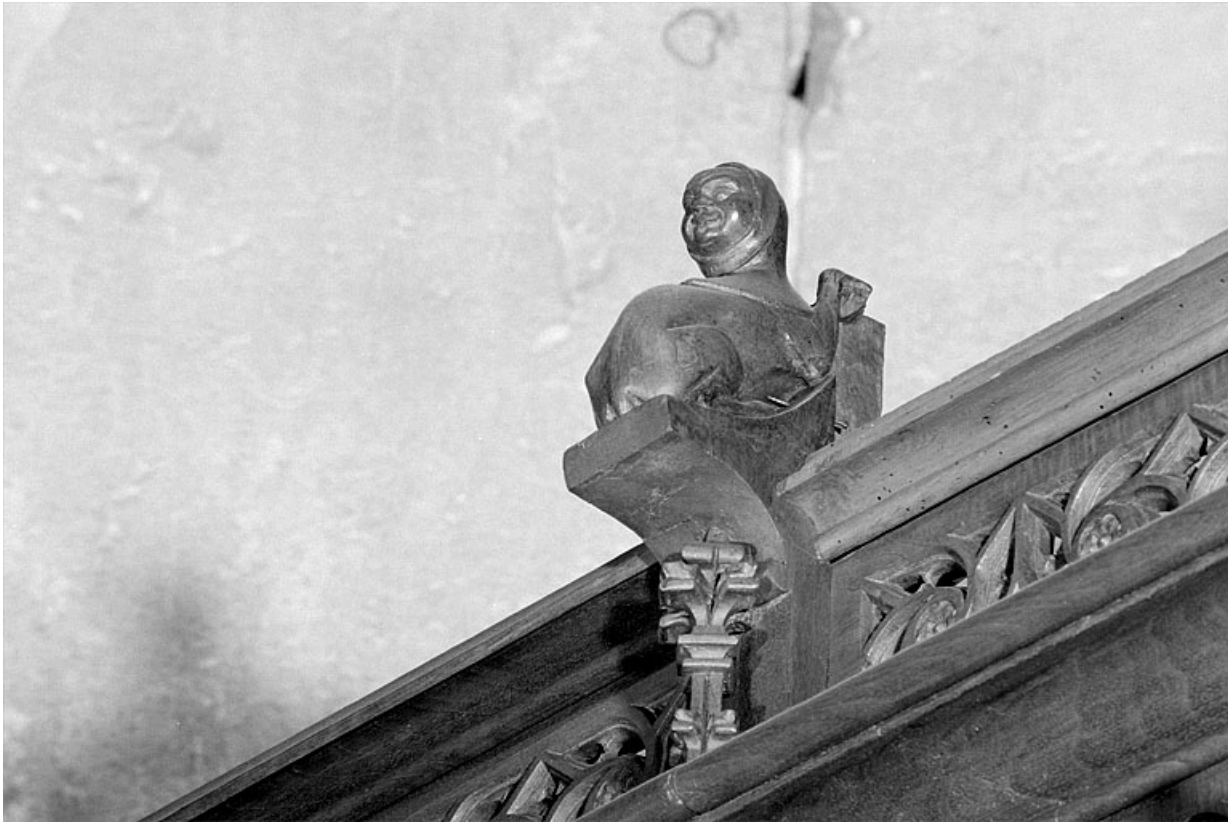
Vue de la quatrième statuette : animal à tête de femme.