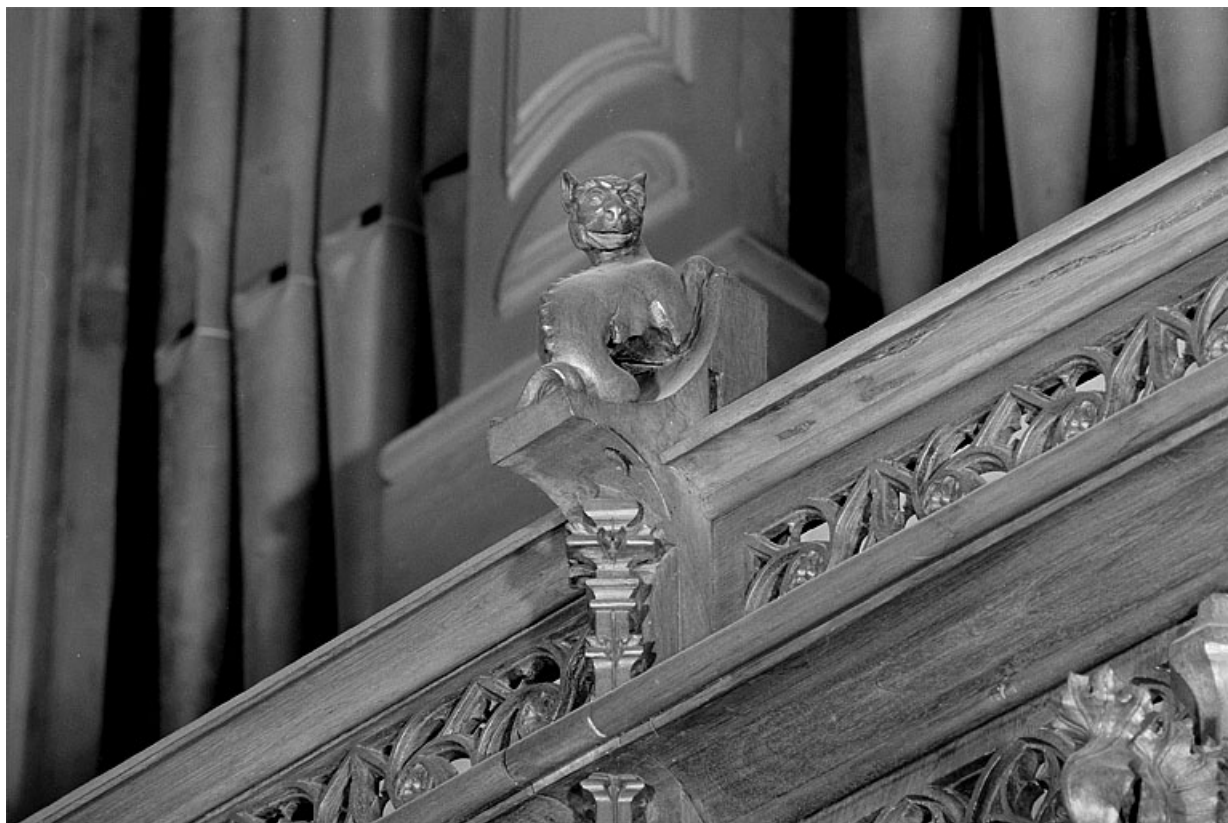
Vue de la dix-huitième statuette : animal.