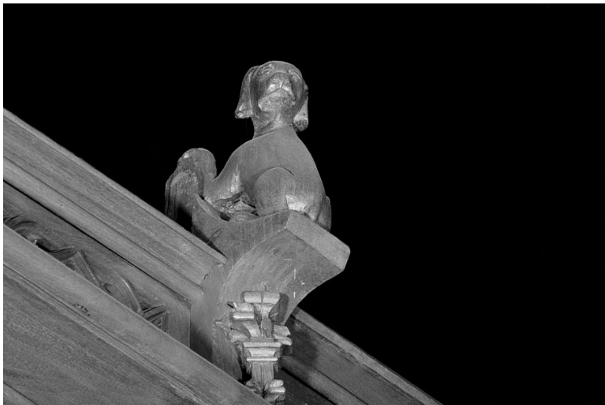
Vue de la troisième statuette : chien, vu de trois quarts gauche.