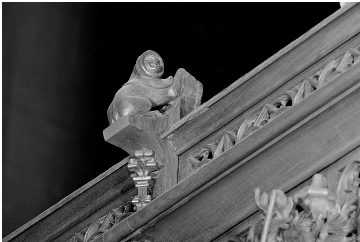
Vue de la douzième statuette : animal à visage humain.