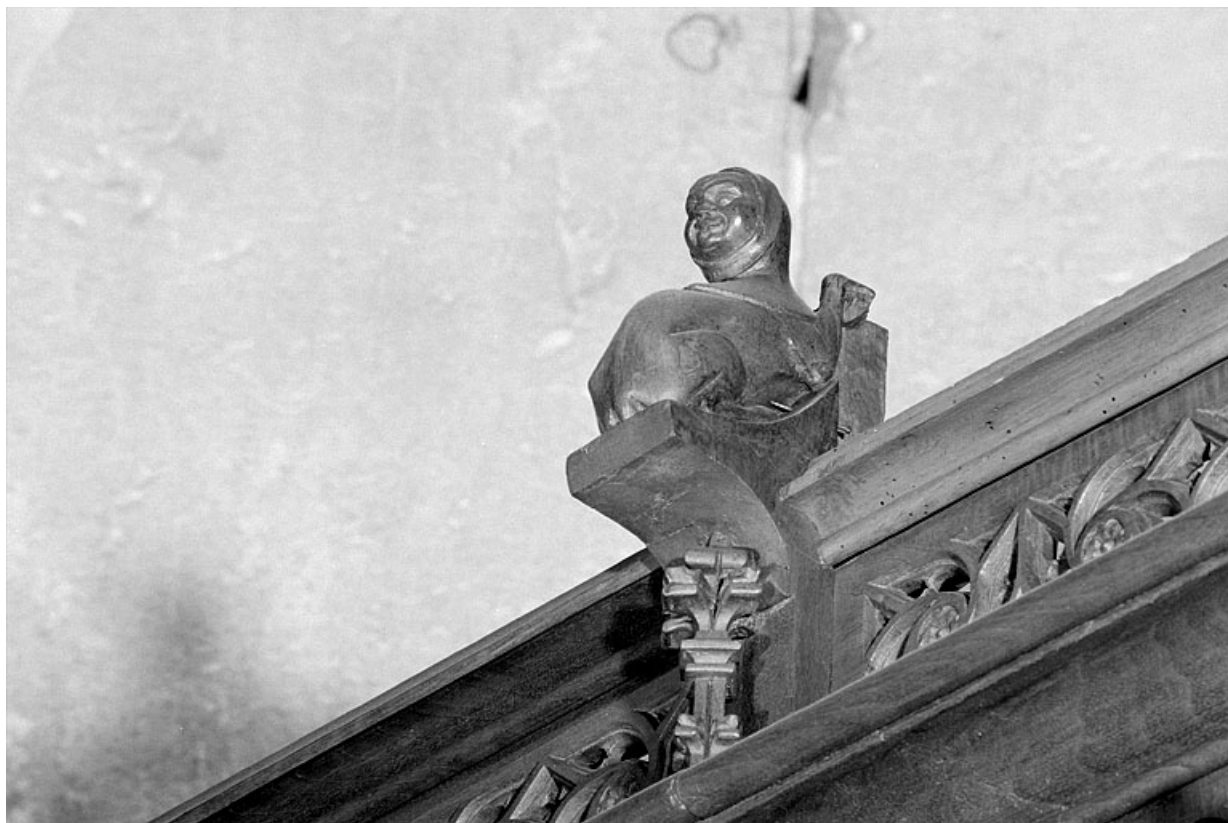
Vue de la quatrième statuette : animal à tête de femme.