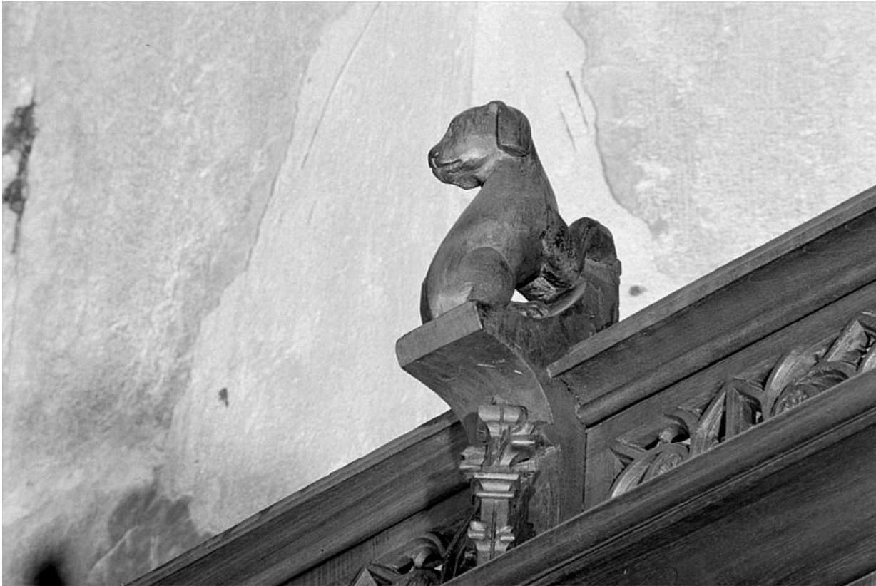
Vue de la troisième statuette : chien, vu de trois quarts droit.