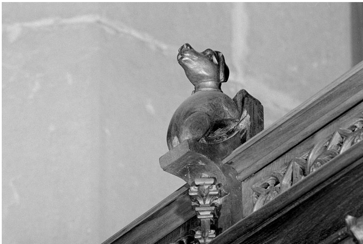
Vue de la sixième statuette : chien.